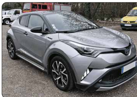
TOYOTA C-HR hybride, ba, 2017