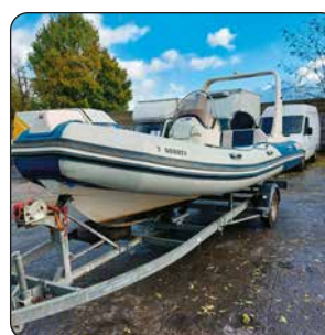
Bateau à moteur MERCURY, 2007