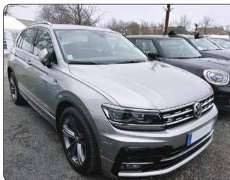
VOLKSWAGEN Tiguan, ba, 2019