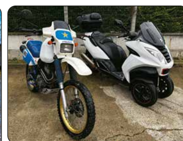
SUZUKI 600 DR, 1986 Scooter PEUGEOT Metropolis 400RS, 2014