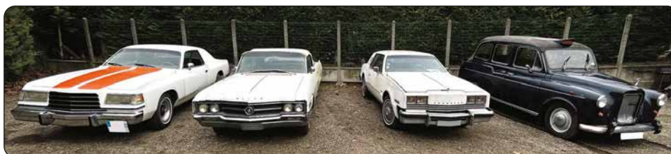
DODGE Magnum XE V8 5,9 l, ba, 1978 - BUICK 445 Wilcat OLDSMOBILE Tornado V8, ba, 1981 - Taxi anglais CARBODIES, ba, 1983

Frais de vente en sus des enchères : 15 % HT + frais de dossier 150 € TTC Règlement au comptant sous 48 h en espèces dans la limite disponible, CB (uniquement pour les particuliers), virement bancaire, chèque de banque avec lettre accreditive de la banque