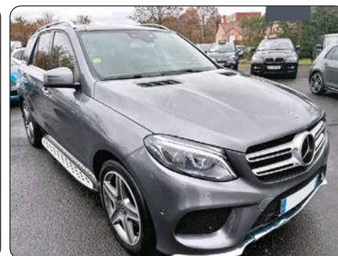
MERCEDES Classe GLE 350 D, ba, 2018