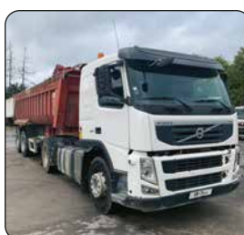
Ensemble tracteur VOLVO FM 450 Euro 4, ba, 2011 + remorque 2 essieux avec bâche