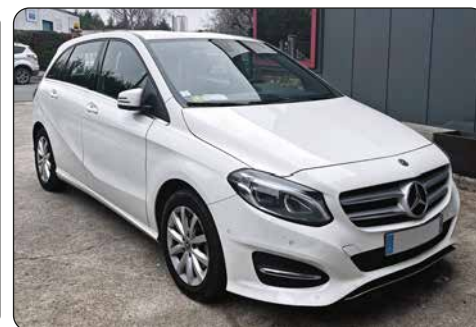
MERCEDES Classe B, ba, 2018