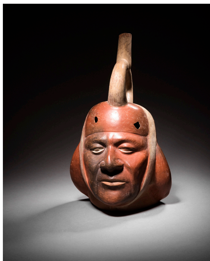
VASE-PORTRAIT CULTURE MOCHICA, NORD DU PÉROU INTERMÉDIAIRE ANCIEN, 200-600 AP. J.-C. Céramique à engobe blanc crème et brun-rouge, zone noircie par le feu Estimation : 8 000 - 10 000 €

VENTE AUX ENCHÈRES PUBLIQUE - DROUOT - SALLE 4