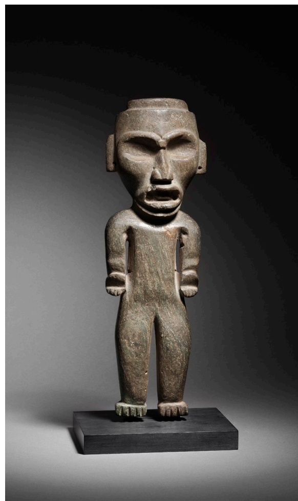
FIGURE DEBOUT CULTURE PRÉ-TEOTIHUACAN, ÉTAT DE GUERRERO, MEXIQUE PRÉCLASSIQUE RÉCENT, 300-100 AV. J.-C. Pierre schisteuse verte veinée de blanc à surface brillante Estimation : 40 000 – 50 000 €

Ces œuvres énigmatiques possèdent un attrait esthétique qui attise la curiosité du monde de l'art depuis le début du XX e siècle. Leurs formes inédites, au graphisme épuré, étaient une source d'inspiration pour des artistes comme André Breton, Tristan Tzara ou le sculpteur Henri Moore. Avec plus de trois millénaires d'histoire et une complexe combinaison de cultures et de styles, l'art précolombien est entouré de mystères et suscite toujours les convoitises.