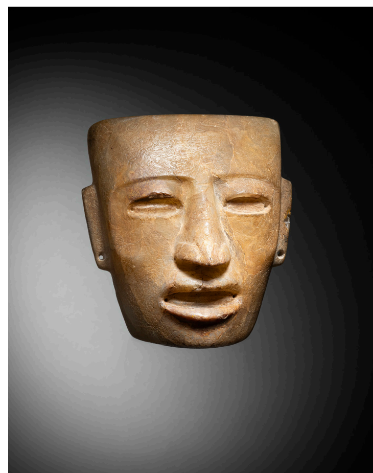
MASQUE ANTHROPOMORPHE CULTURE TEOTIHUACAN, VALLÉE DE MEXICO, MEXIQUE CLASSIQUE, 450-650 AP. J.-C. Albâtre semi-translucide Estimation : 60 000 – 80 000 €