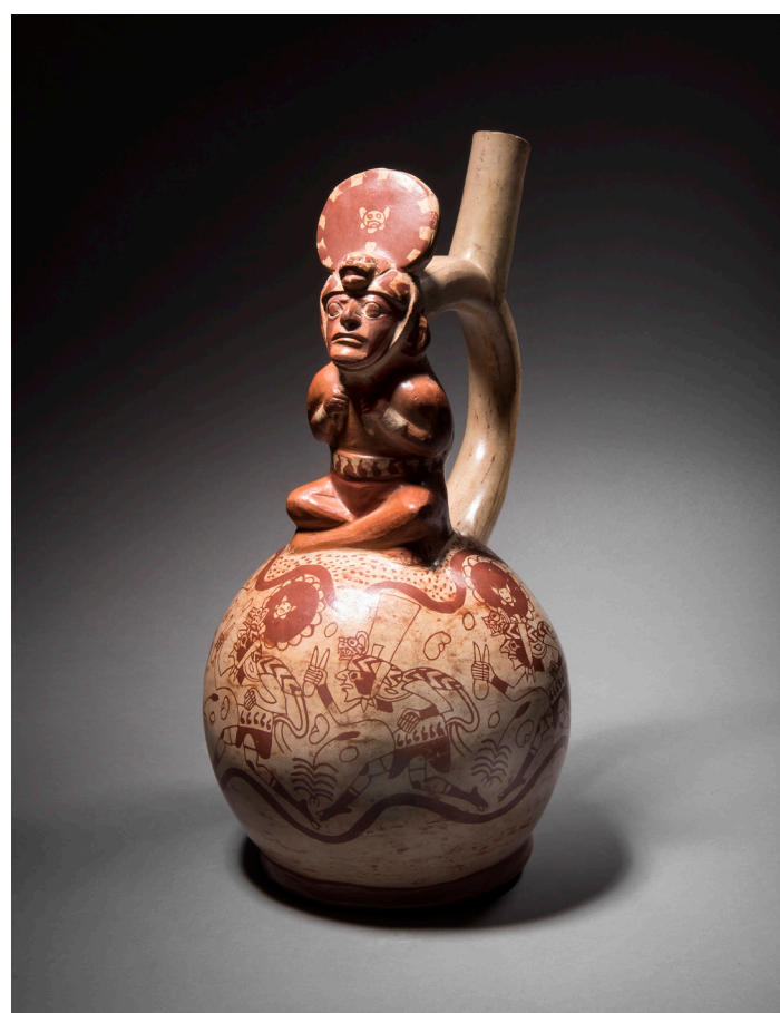
VASE DÉCORÉ D'UN PERSONNAGE ASSIS EN TAILLEUR CULTURE MOCHICA, NORD DU PÉROU INTERMÉDIAIRE ANCIEN, 200-600 AP. J.-C. Céramique à engobe blanc crème et rouge brique. Personnage brun-rouge et brun orangé Estimation : 8 000 – 10 000 €