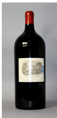
Imperial (6 L.) of CHÂTEAU LAFITE ROTHSCHILD 1889 1 er Grand Cru Classé Pauillac Lodged in it's original domaine's wood box. Estimate: €4,000-6,000