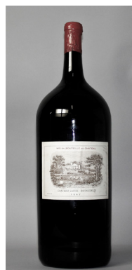
Double magnum (3 L.) of CHÂTEAU LAFITE ROTHSCHILD 1 er Grand Cru Classé Pauillac 1947 Back slip stating « Bottle reconditioned by the Cellar Master at the Château in 1993 » Estimate: €5,000-6,000