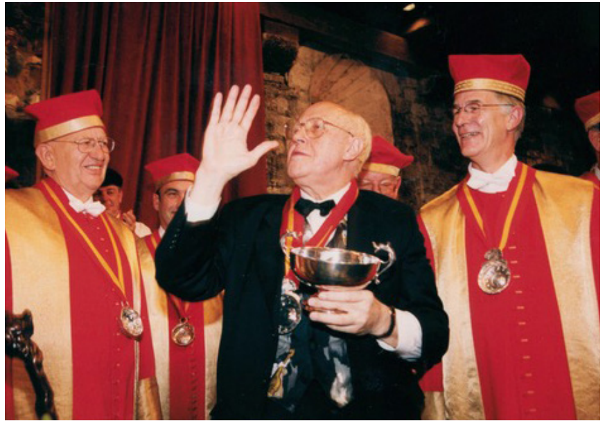
Fraternity of the Chevaliers du Tastevin, Mstislav Rostropovich, at the center