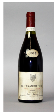
Bottle of NUITS S t GEORGES 1 er cru « Les Meurgers » Henri JAYER 1985 Estimate: €2,000-3,000