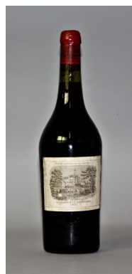
Bottle of CHÂTEAU LAFITE ROTHSCHILD 1 er Grand Cru Classé Pauillac 1803 Back slip stating « Bottle re corked by the Cellar Master at the Château in 1992 » Estimate: €6,000-8,000