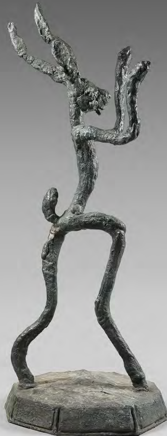
Barry Flanagan (1941-2009) Monument to Letters , 2005 Estimation : 150 000 - 180 000 €

La vente réunira également plusieurs œuvres remarquables du XXe siècle, parmi lesquelles une Nature morte de Mela Muter (estimation : 40 000 - 60 000 €), dont la matière généreuse et les empâtements expressifs témoignent de la force de son écriture picturale. Les amateurs de modernité pourront également découvrir Aquarium de Pierre Bonnard, réalisé en 1906 (estimation : 30 000 - 50 000 €), une œuvre délicate où l'artiste explore déjà les jeux de lumière, de couleur et de transparence qui feront la singularité de son œuvre.