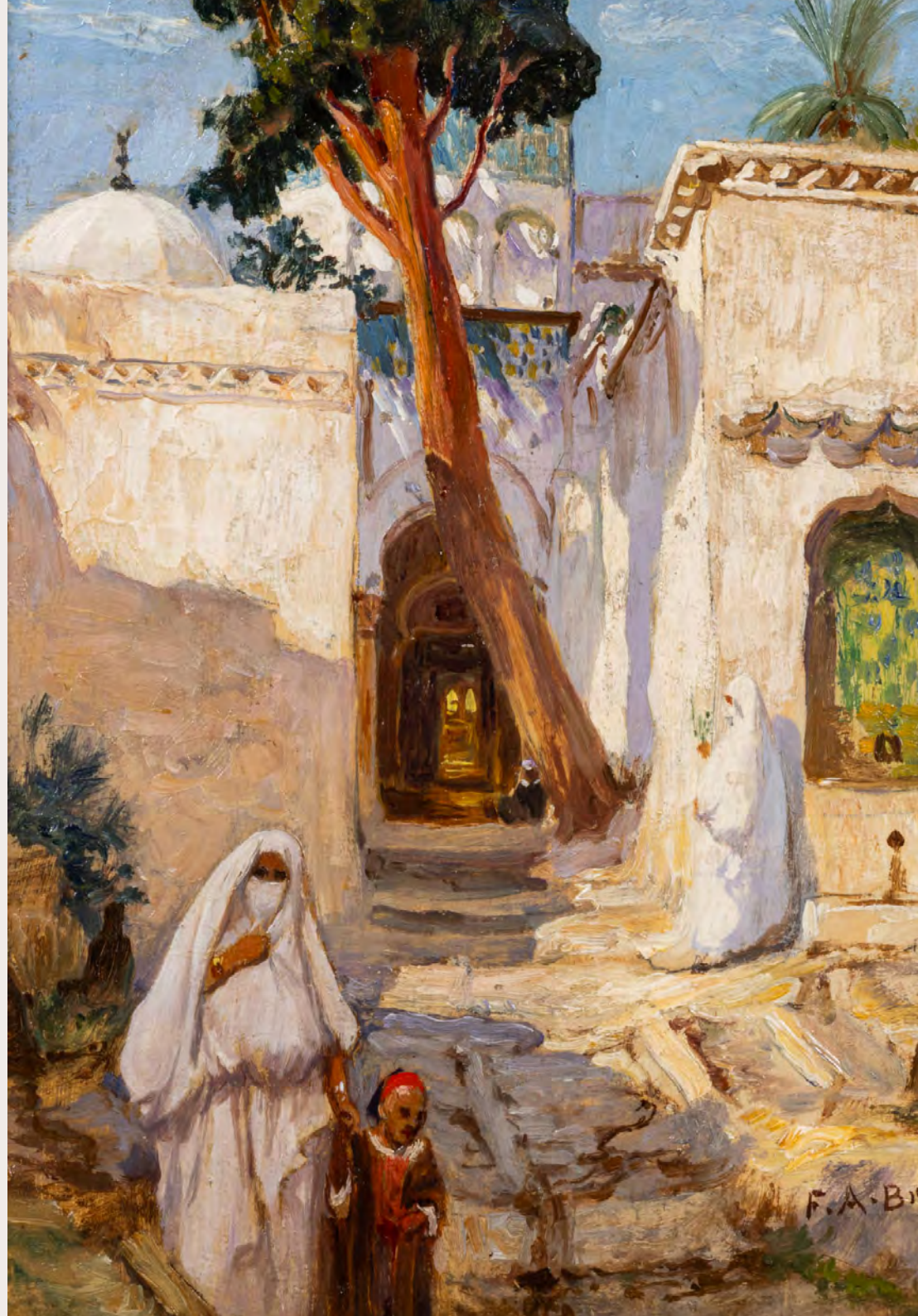
Frederick Arthur Bridgman (1847-1928) Mosquée de Sidi Abd El Rahmane Estimation : 15 000 - 20 000 €

À travers ces œuvres, la vente offre un panorama nuancé des regards portés sur l'Orient et l'Afrique, entre fascination esthétique, observation du quotidien et recherche de nouveaux horizons picturaux.