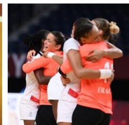
La joie de l'Équipe de France de handball féminin à Tokyo