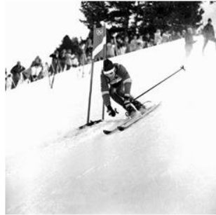
Les exploits de Jean-Claude Killy à Grenoble en 1968