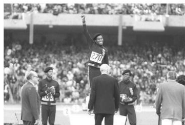
Le poing levé de Lee Evans