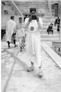
La star de la natation aux Jeux de 1924 : Johnny Weissmuller avant qu'il ne devienne Tarzan