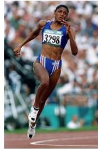
Marie José Pérec, aérienne et magnifique d'élégance en plein effort