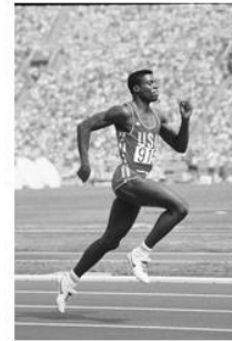
La classe de Carl Lewis