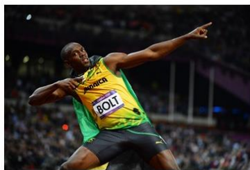
La foudre d'Usain Bolt