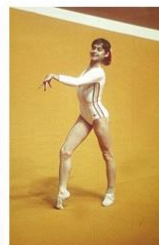
La grâce de Nadia Comaneci