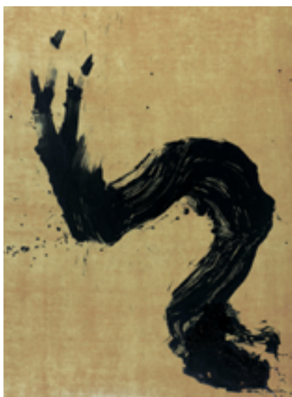
Fabienne VERDIER (née en 1962) Arborescence, variation n°6 , 2009 Pigment et encre sur toile, signée, titrée et datée Peinture du 5 décembre 2008 au verso H. 135 cm — L. 183 cm