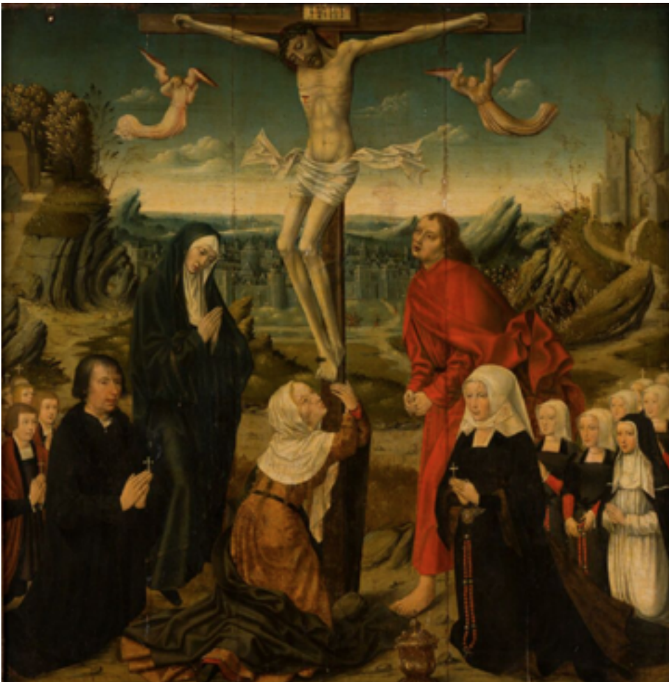
Atelier d'Adriaen YSENBRANT (1480-1551) Le Christ au Golgotha entouré de deux anges, La Vierge, Marie-Madeleine et adorant Huile sur panneau, 3 planches parquetées H. 76 cm – L. 74,5 cm