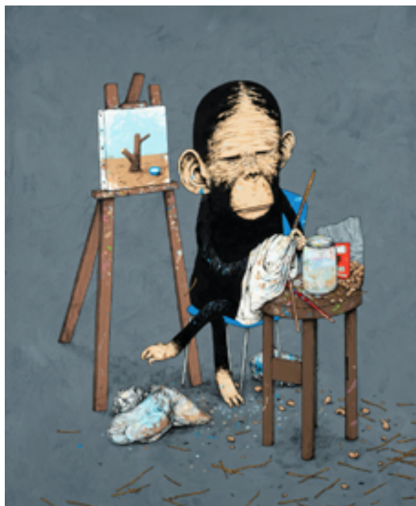
DRAN (né en 1979) Stradivarus , 2017 Huile sur toile, signée et titrée au dos H. 100 cm – L. 81,5 cm