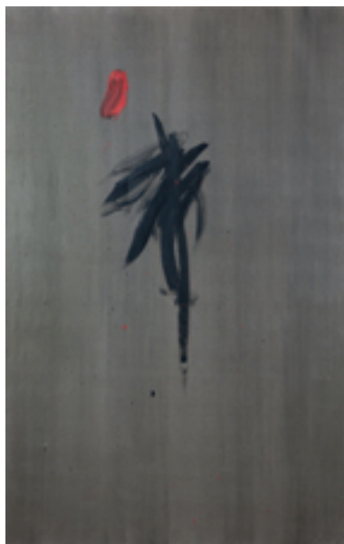
Jean DEGOTTEX (1918-1988) IMPA-VIDE (II) , 1959 Huile sur toile, signée en bas à droite, contresignée, titrée et datée au verso H. 199 cm — L. 130 cm