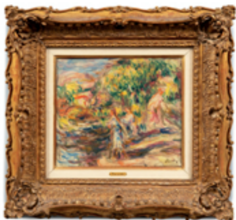
Pierre-Auguste RENOIR (1841-1919) Laveuse , 1916 Huile sur toile, porte le cachet de la signature en bas à droite H. 30 cm — L. 35 cm