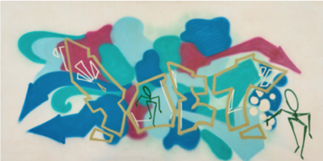
DONDI WHITE (1961-1998) From words to man , 1984 Peinture aérosol sur toile, datée et signée au dos H. 125 cm – L. 250 cm.