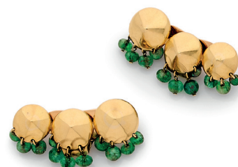
Paire de boucles d'oreilles en or jaune 750 millièmes, chacune à décor de « paillettes » retenant en pampille des petites boules d'émeraudes Estimation : 3 000 - 4 000 €

Pierre BALMAIN (1914-1982) affectionnait particulièrement concevoir des costumes de scène, et notamment pour Dalida. La chanteuse vouait au couturier une amitié et une admiration sans pareilles. Elle lui rendit hommage en ces mots : Pierre Balmain, c'était pour moi la vie en rose, en soie, en dentelle et quelquefois en strass... Et Dieu créa la femme, c'est du moins ce qu'on dit, alors sûr, il a aussi créé Pierre Balmain ! Il aurait pu lui dire : "Tu es Pierre et sur cette pierre je bâtirai la haute couture" . (Collectif 40 Années de Création Pierre Balmain. Musée de la mode et du costume Palais Galliera, 1985, p. 23.).