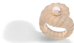
Bague en calcédoine gravée de godrons et à décor de tourbillon, le centre orné d'une perle de culture Estimation : 2 000 - 3 000 €