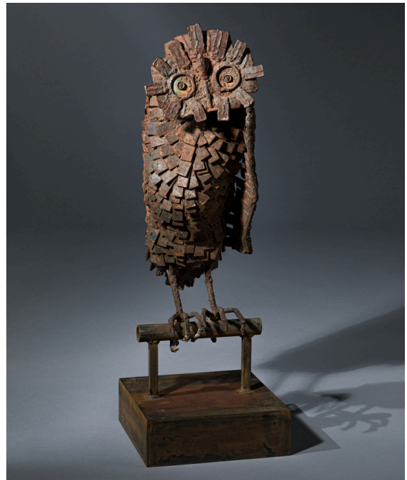
CÉSAR Chouette, 1955-1960 Sculpture en fer, signé sur une aile 64 x 22 x 20 cm Est. 10,000 - 15,000 €