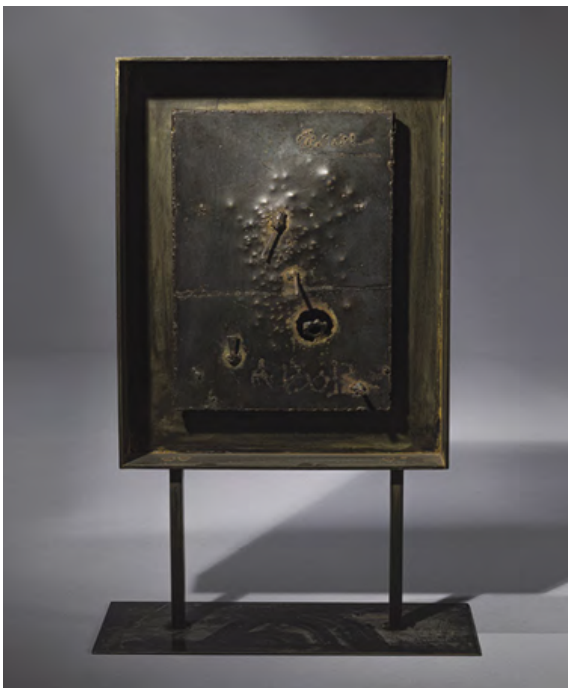
CÉSAR Sans titre, 1957 Plaque de fer, 1957 Fer (soudé et perforé), signé et dédié « à Bob » (Robert Calé) en bas à droite 37 x 26,5 cm Est. 10,000 - 15,000 €