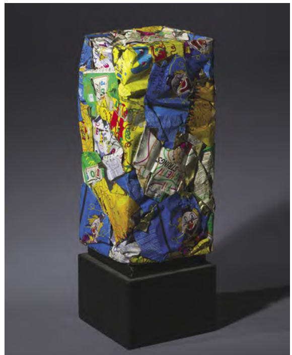
CÉSAR Compression, c. 1995 Compression de bombes de Carnaval Est. 7,000 - 10,000 €