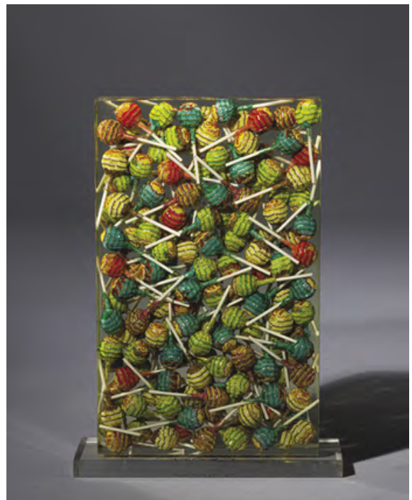
ARMAN Chupa Chups, 1999 Multiple : Inclusion de sucettes dans de la résine Est. 1,500 - 2,000 €