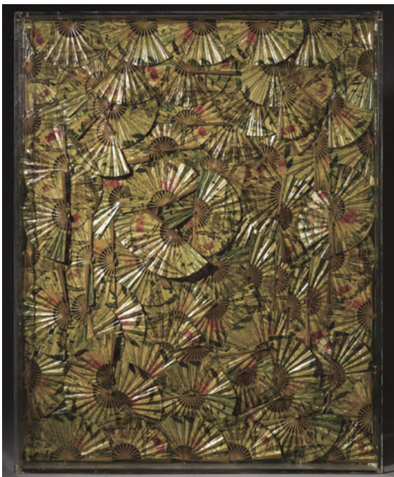
ARMAN Eventails, c.1995 Accumulation dans une boîte en plexiglass d'éventails créés en 1929 pour l'inauguration du Palais de la Méditerranée à Nice et du casino de Juan-les-Pins Est. 25,000 - 35,000 €