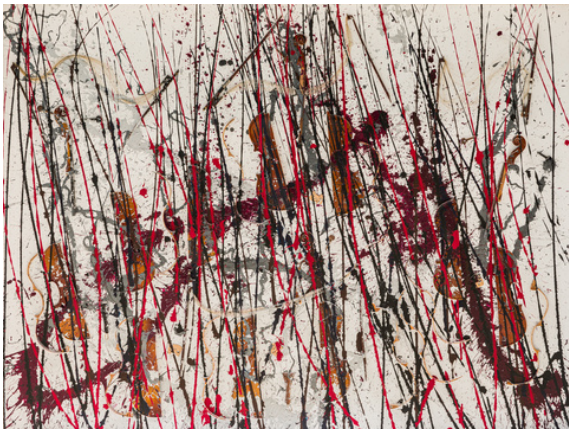
ARMAN (1928-2005) Footing painting, 2000 Morceaux de violons, archets, acrylique et technique mixte sur toile marouflée sur panneau 150 x 200 cm x 7 cm Est. 25,000 - 30,000 €