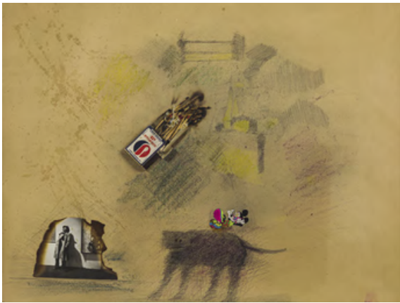
CÉSAR Allumettes calcinées, 1974 Collage et technique mixte sur papier contrecollé sur carton Est. 2,000 - 3,000 €