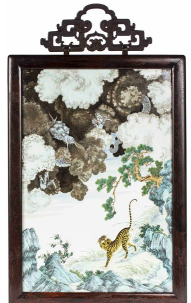
119 600 €* CHINE - Période Qing (1644-1912) Paire de panneaux en porcelaine et émaux de la famille rose. Aguttes, le 9 décembre 2019 Expert : Cabinet Ansas & Papillon