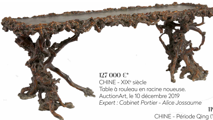
127 000 €* CHINE - XIX e siècle Table à rouleau en racine noueuse. AuctionArt, le 10 décembre 2019 Expert : Cabinet Portier - Alice Jossaume