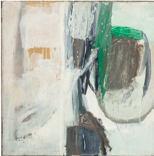
Lot 11 Peinture, 1962 Huile sur toile signée 80 x 80 cm Est. 6,000 - 10,000€