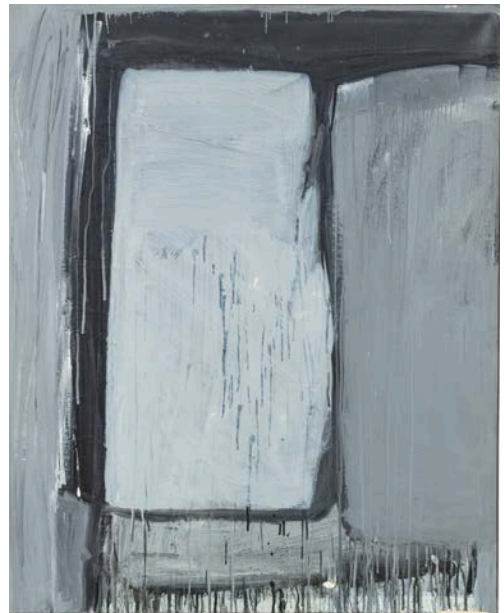
Lot 13 Peinture, circa 1964 Huile sur toile 100 x 81 cm Est. 8,000 - 12,000€