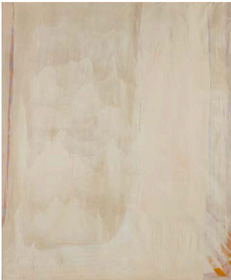
Lot 14 Peinture n°2, 1965 Huile et papiers collés sur toile 220 x 180 cm Est. 20,000 - 30,000 €