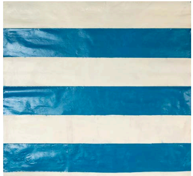
Lot 15 Sans titre, vers 1966 Laque sur toile (bleu) 237 x 227 cm Est. 40,000 - 60,000€