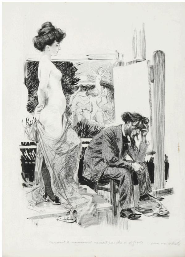
Frantisek Kupka Cependant le mouvement ne doit pas être difficile pour un artiste 1902 Est. 10,000 - 12,000 €