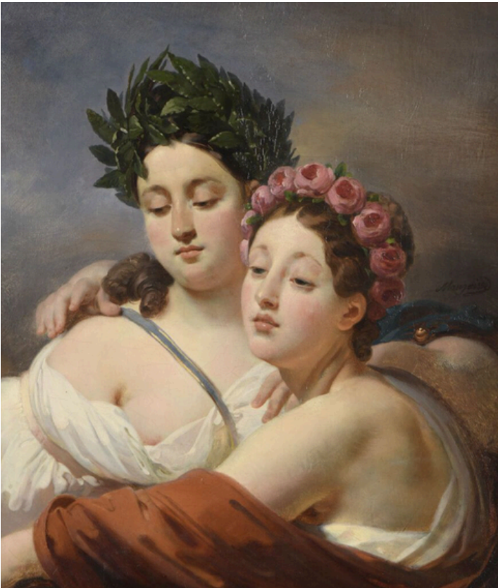
Lot 20 Jean-Baptiste Mauzaisse Etude pour un plafond du Louvre Est. 2,000 - 3,000€