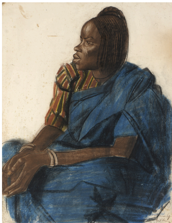
Alexandre Jacovlev Femme assise, Fort Lamy Est. 15,000 - 20,000€