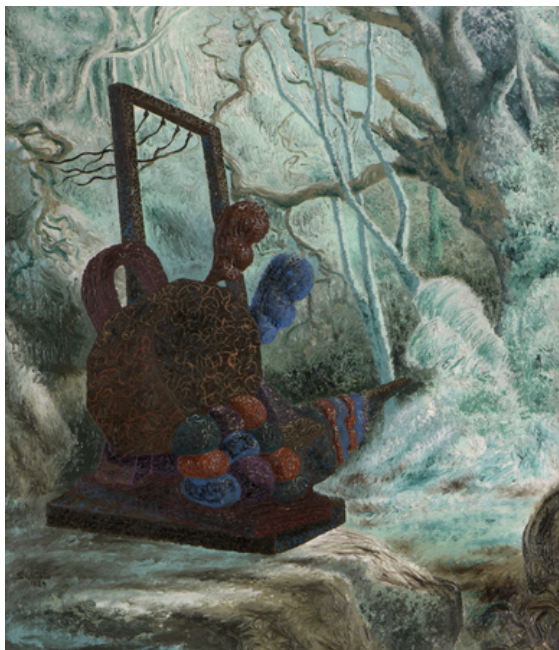
Alberto Savinio Machine pour féconder les arbres, 1929 Est. 150,000 - 200,000€