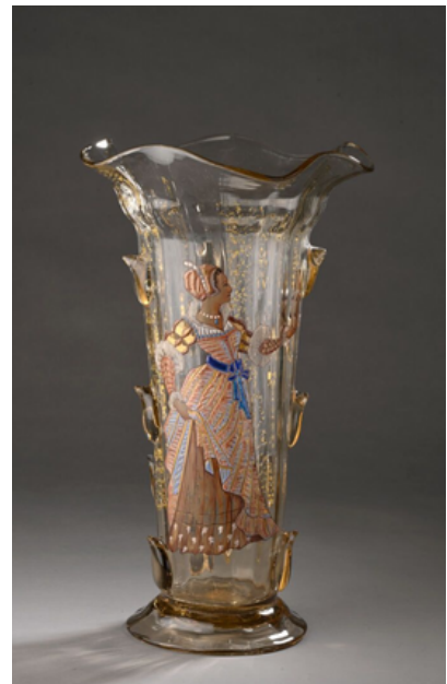
Lot 107 Emile Gallé Grand vase conique à décor de femme en costume médiéval Est. 2,000 - 3,000€