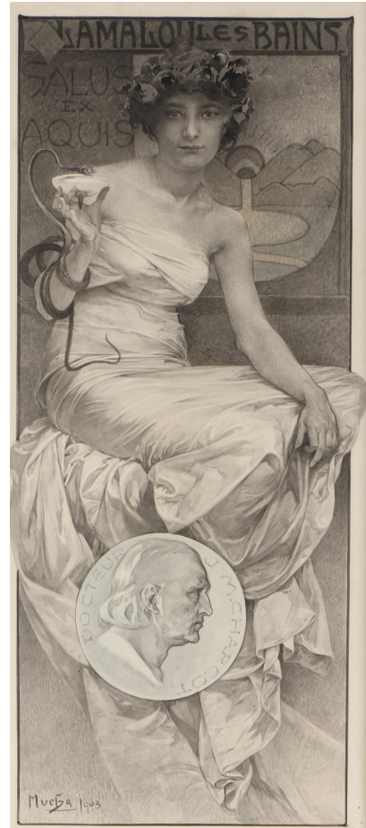
Lot 96 Alfons Mucha Lamalou les Bains Est. 8,000 - 12,000€