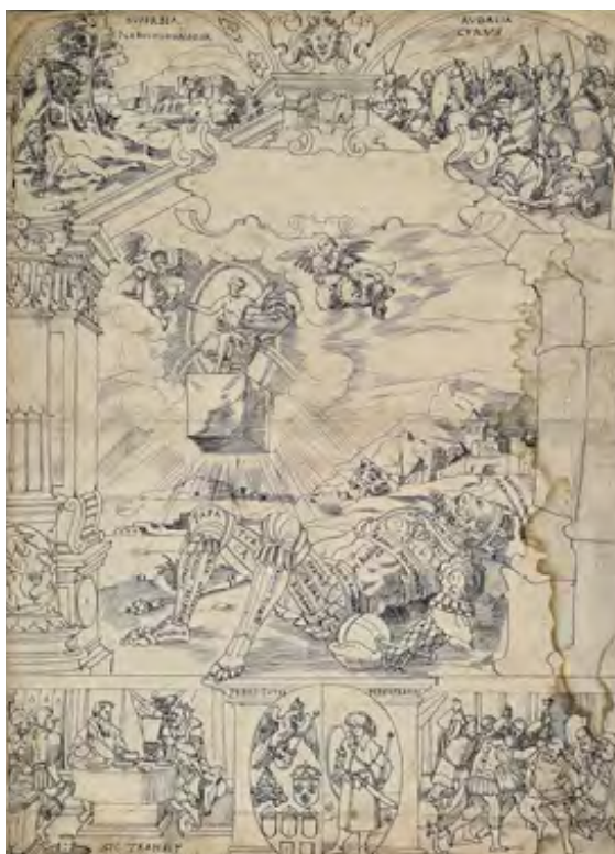
Hieronymus Vischer Le pouvoir temporel soumis au Christ 1589 Est. 8,000 - 12,000€