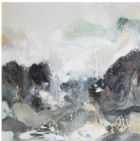
Chu TEH-CHUN (1920-2014) Sans titre aux couleurs Céladon (détail) 1985 Huile sur toile. Estimation : 80 000 - 150 000 € Vente le 21 juin 2019 Copages Auction