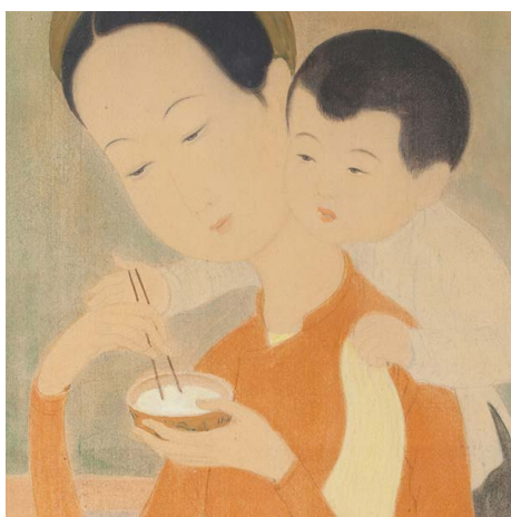
MAI TRUNG THU (1906-1980) Le rideau vert ou Le Bol de riz (détail) Encre et couleurs sur soie contrecollée sur carton, signée du cahet de l'artiste et datée 1942. Estimation : 30 000 - 40 000 € Vente le 12 juin 2019 Gros & Delettrez Expert : Cabinet Ansas – Papillon d'Alton