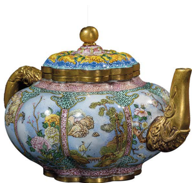
CHINE - XVIII e siècle Petite théière de forme polylobée, à décor en émaux dit « falangcai » sur cuivre. Estimation : 40 000 - 60 000 € Vente le 12 juin 2019 Gros & Delettrez Expert : Cabinet Ansas – Papillon d'Alton