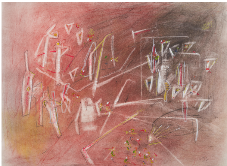
Roberto MATTA (1911-2002) Tôt ou tard , 1989 Pastel, crayon et mine de plomb H. 50 cm — L. 65 cm (la feuille)