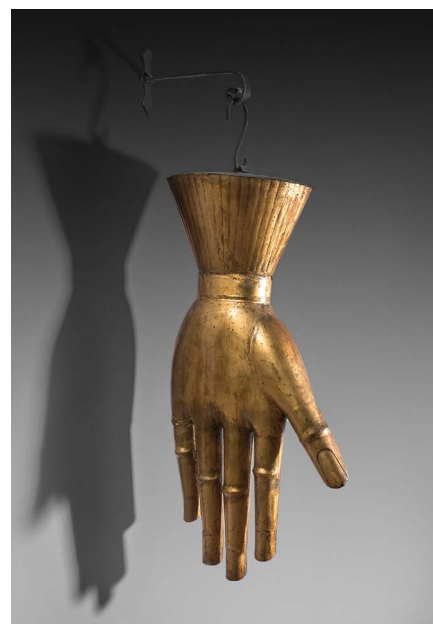
Enseigne « Au gant d'or » Époque Second Empire Estimation : 500 - 600 €