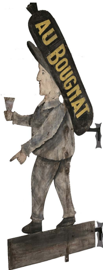
Enseigne du marchand de bois et charbon « Au Bougnat », circa 1880 Estimation : 200 - 220 €