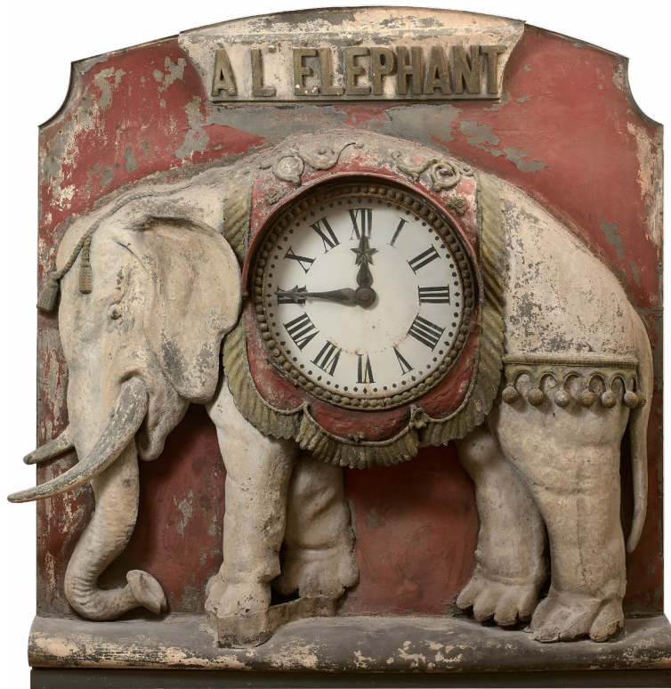
Enseigne de fabricant de fournitures pour cafés et bistrot « À l'éléphant » Vers 1840 Estimation : 1500 - 1600 €