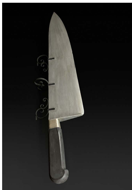
Enseigne de la manufacture de Coutellerie « Tichet » Fin du XIX e siècle Estimation : 150 - 180 €