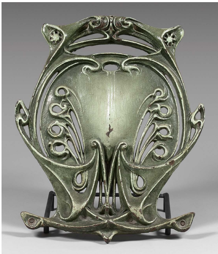
Hector Guimard (1867-1942) Écusson de garde-corps de balustrade d'une station de métropolitain parisien Circa 1900 Estimation : 1 000 - 1 200 €

Parmi les 210 lots dédiés à Paris, quoi de plus emblématique de Paris que le fameux « M » du Métropolitain ? Réalisation parfaitement reconnaissable du maître de l'Art Nouveau, Hector GUIMARD (1867-1942) , un écusson en fonte ornant l'entrée d'une station du chemin de fer Métropolitain sera l'une des pièces maîtresses de cet ensemble (estimation 1 000 – 1 200 €).