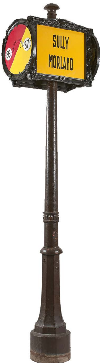
Potelet d'arrêt d'autobus « Sully Morland », vers 1930 Estimation : 600 - 650 €