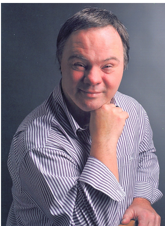
Pascal Duquenne

Jeudi 4 octobre, la maison Doutrebente proposera, pendant la nocturne de Drouot, une vente aux enchères au profit de la Fondation Jérôme Lejeune, qui œuvre au service des personnes porteuses d'une déficience intellectuelle d'origine génétique. Cette initiative est parrainée par Pascal Duquenne, célèbre acteur du film Le Huitième Jour pour lequel il a reçu le prix d'interprétation masculine au Festival de Cannes en 1996, ainsi qu'Ari Vatanen, coureur professionnel et Champion du monde des Rallyes.