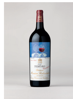
Château Mouton Rothschild, 2014, Premier Grand Cru Classé, AOC Pauillac Estimation : 900 - 1 200 €