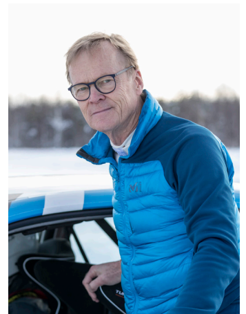
Ari Vatanen