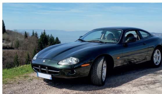
JAGUAR XK8 4l coupé, moteur V8, 300 CV Estimation : 10 000 - 12 000 €

VENTE AUX ENCHÈRES PUBLIQUE - DROUOT - SALLE 9 Jeudi 4 octobre - 19h