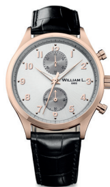
Montre William L et son écrin Modèle Vintage Style Small Chronograph Estimation : 80 - 120€