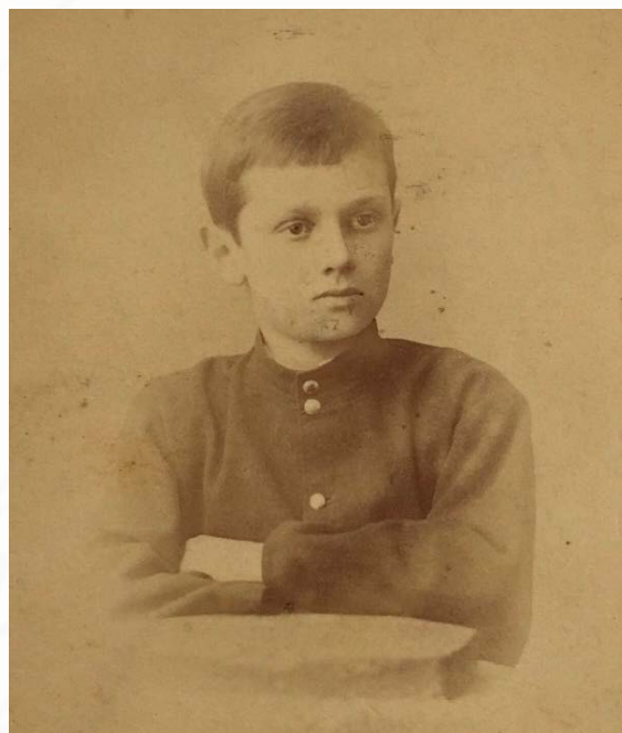
Portrait d'Alexandre Koltchak enfant daté au dos 1886 Estimation : 700 - 1 000 €