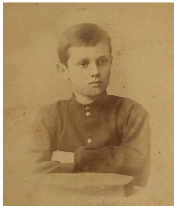
Фотография Александра Колчака, 1886 Оценка: 700 - 1 000 евро