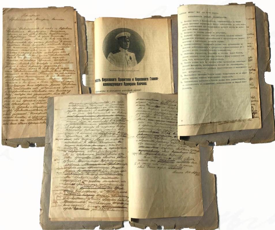
Колчак, Александр Васильевич (1874-1920) Приказы, постановления и воззвания Адмирала Колчака, № 8, серая папка с редчайшими документами.

На этом аукционе будет выставлена неизвестная историкам рукопись, хранившаяся в семье с момента ее написания, в ней содержится текст прокламации Временного Всероссийского Правительства в Омске: уникальное подтверждение масштаба амбиций этого человека по отношению к будущему своего народа. Он описывает объединенную Россию, входящую в круг мировых демократий, чье правительство противостоит большевистской системе, «отвергающей все принципы морального и патриотического долга». Он объявляет «временное» Всероссийское Правительство, которое «будет владеть полномочиями до тех пор, пока русский народ, освобожденный от большевизма, не выберет подходящую ему форму правления». В этой рукописи рассматривается аграрный вопрос, который «должен быть решен в согласии с народом», а также социальные и экономические проблемы.