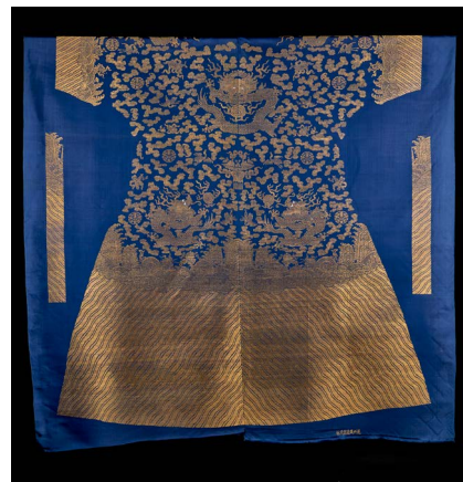
Patron de robe de mandarin, Chine, fin de la dynastie Qing (1644-1911) Estimation : 15 000 / 20 000 €

Un col brodé, Chine, ethnie Miao. (Estimation : 500 / 600 €)