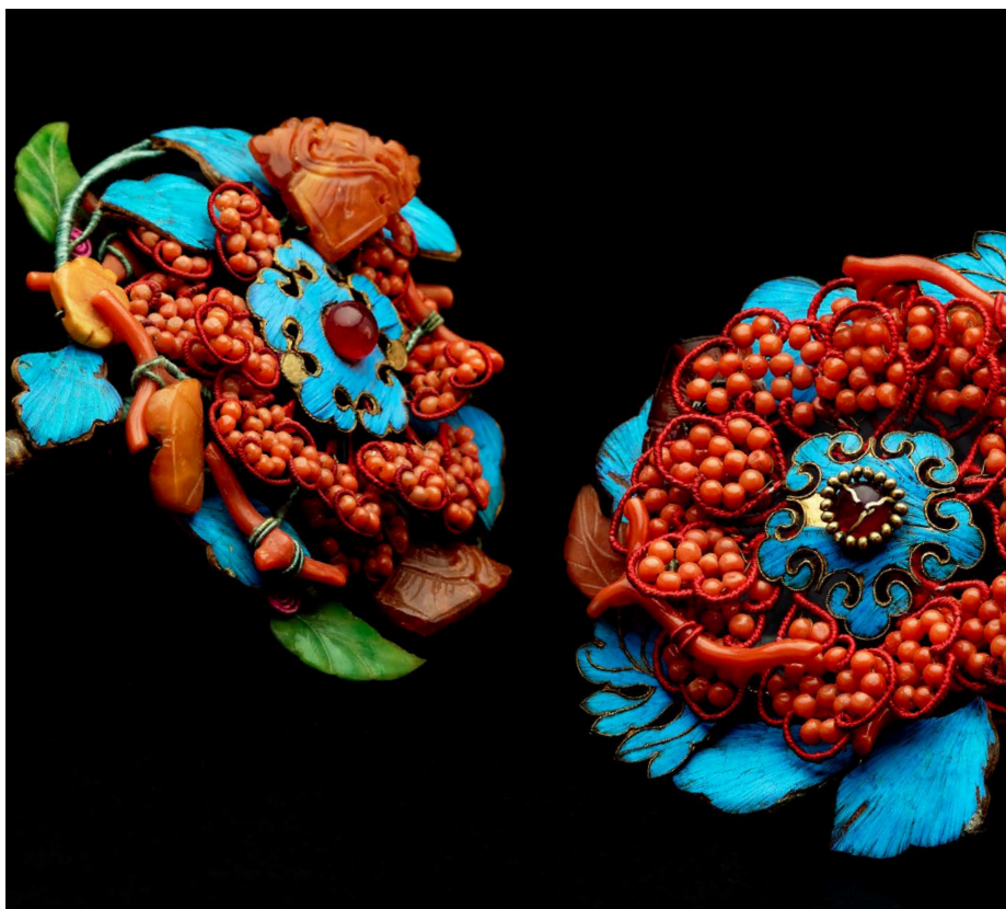
Épingles à cheveux, Chine, XIX e siècle Plumes de martin-pêcheur, perles, corail pierres. Estimation : 2 000 / 3 000 €

600 pièces rassemblées par passion et curiosité par Zaira – galeriste bruxelloise – et Marcel Mis au cours de leurs voyages, pendant trois décennies, seront présentées par Leclere – Maison de ventes. Ces bijoux, textiles et objets du quotidien retracent, à travers les différentes périodes, les savoir-faire artisanaux de l'empire du milieu et du pays du soleil levant.