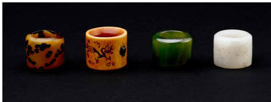
Bagues d'archer, Chine, dynastie Qing (1644-1911) Estimation : 600 / 1 200 €