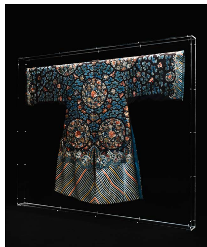
Robe brodée, Chine, dynastie Qing (1644-1911) Estimation : 3 000 / 5 000 €