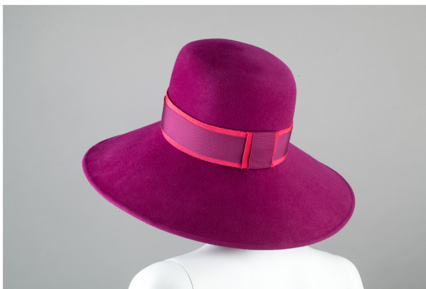
Alexandre Barthet Paris Chapeau pour le film Grace of Monaco Estimation : 1 000 / 1 500 €

Elle comprendra notamment des pièces provenant de la collection de la baronne Alain de Rothschild et, parmi les accessoires, un chapeau réalisé par le modiste Alexandre Barthet, porté par Nicole Kidman dans le film Grace of Monaco .