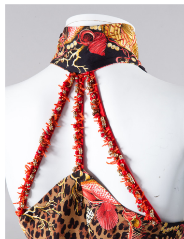
Gianni VERSACE couture, Collection Printemps/Été 1992, Robe Panthère Estimation : 12 000 / 13 000 €