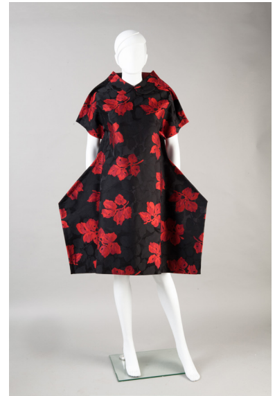
Collection Automne/Hiver 2012, Robe 2D Estimation : 2 000 / 3 000 €