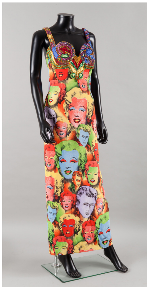
Gianni VERSACE couture, Collection Printemps/Eté 1991, Robe Marilyn Estimation : 32 000 / 34 000 €