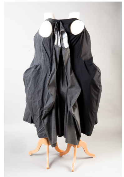
Collection Printemps/Été 2011 « No Theme (multiple personalities, Psychological Fear) », robe déstructurée Estimation : 1 500 / 2 000 €