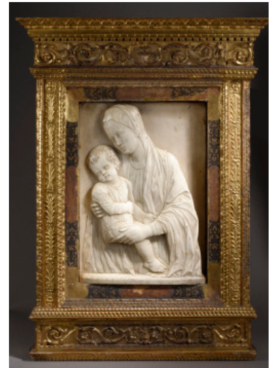
Antonio RIZZO (1430-1499), attribuée à Vierge à l'Enfant en marbre blanc. Collection Achille Fontaine. Chez Daguerre, le 10 novembre Estimation : 150 000 / 200 000 €