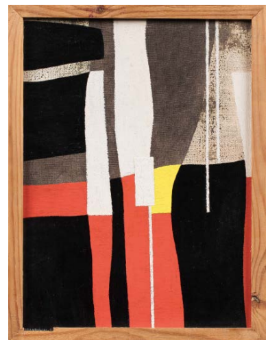
Enrico PRAMPOLINI (1894-1956) Mesures, 1951 Estimation : 6 000 / 8 000 €