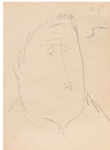
Michel LARIONOV (1881-1964) Portrait de Guillaume Apollinaire , v. 1914 Estimation : 6 000 / 8 000 €