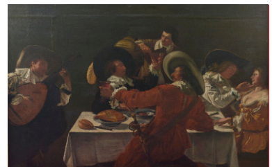
École flamande Scène de Taverne Estimation : 12 000 / 15 000 €

Vente aux enchères publique – Hôtel Drouot – Salle 5 et 6 Vendredi 10 novembre - 11 h