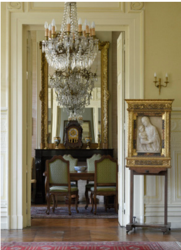
Intérieur de la demeure familiale de la famille Fontaine

Archive de la famille Fontaine (ne figurera pas dans la vente).