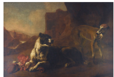
Jan Baptist WEENIX (1621-1659) Deux chiens se disputant des entrailles Estimation : 30 000 / 50 000 €