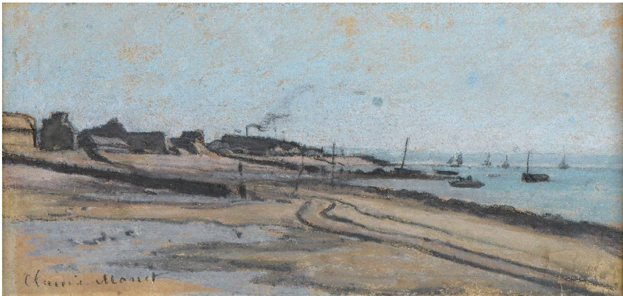
Claude Monet, Saint-Adresse, vue sur le Perrey, Pastel, 15,5 x 30,8 cm

LA MISE EN VENTE D'UN MAGNIFIQUE PASTEL DE CLAUDE MONET PERMET LA DÉCOUVERTE D'UN DESSIN INCONNU DU PÈRE DE L'IMPRESSIONNISME