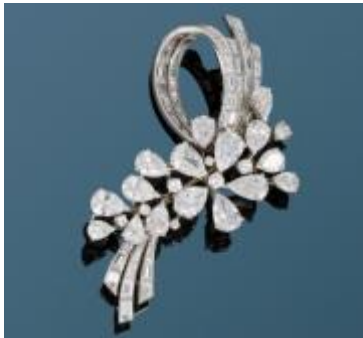
Broche à motif floral. Diamants, platine et or gris. Estimation : 40 000 / 60 000 €