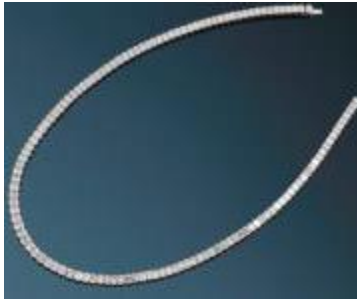
CHAUMET – Collier Rivière de diamants 50 carats Monture en Or gris et platine. Estimation : 100 000 / 120 000 €