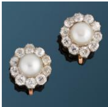
Boucles d'oreilles en diamants et perles fines montées sur or jaune et platine.