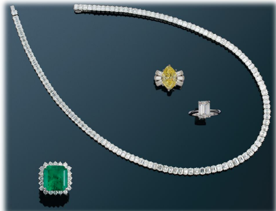
CHAUMET - Collier Rivière de diamants 50 carats - Monture en Or gris 18K (750 millièmes) et platine 950 millièmes. Estimation : 100 000 / 120 000 €

EXPOSITIONS sur rendez-vous - Millon Trocadéro 5, Avenue d'Eylau - PARIS XVI