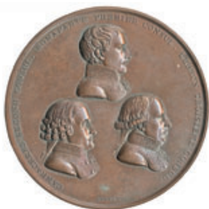
288 B réduit