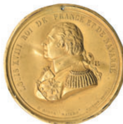
288 C réduit