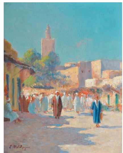
Eugène Jules DELAHOGUE

7 Place animée - Les souks Deux huile sur panneaux formant pendants, signé en bas à droite et signé en bas à gauche, 24x19 cm chaque. 2 500/3 500 €