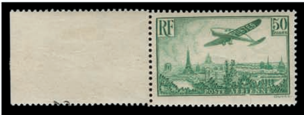
Du n° 104