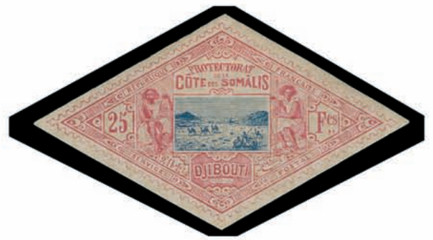
Du n° 149