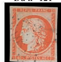
Du n° 121