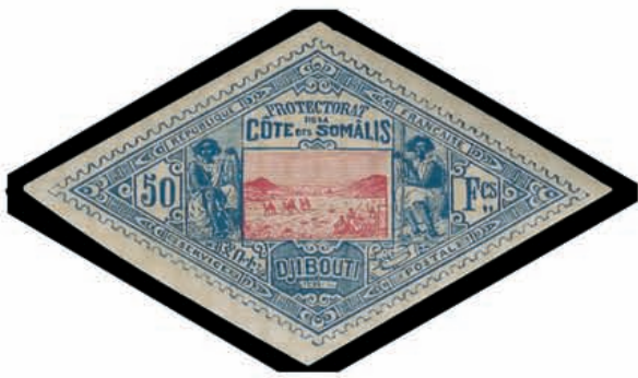
Du n° 149