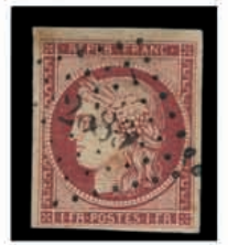
Du n° 120