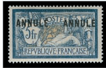
Du n° 104