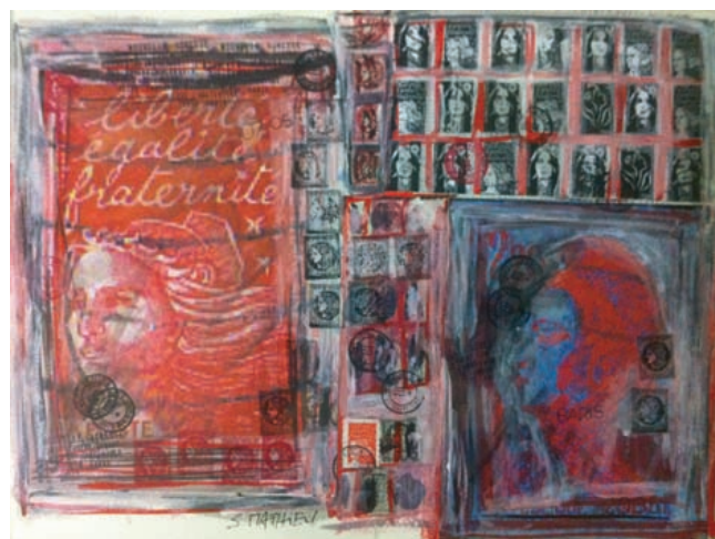
Tableau hors catalogue

7 rue Rossini Salle de Ventes aux Enchères