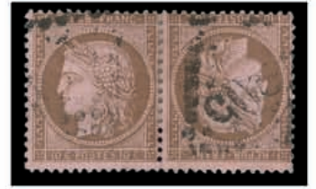
Du n° 104