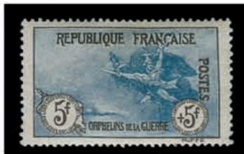
Du n° 120