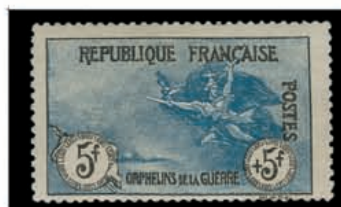
8 Du n° 121