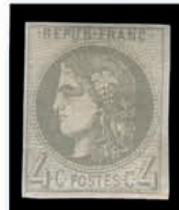
Du n° 120