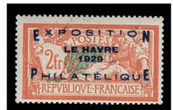
Du n° 121