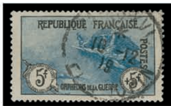
Du n° 126