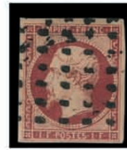
Du n° 120