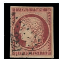
Du n° 121