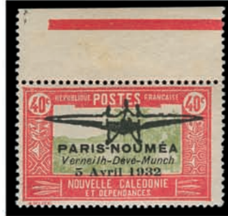
Du n° 150