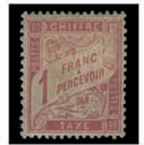
Du n° 104