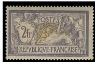
Du n° 121