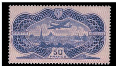
Du n° 121