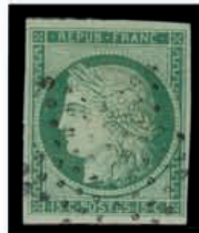
Du n° 120