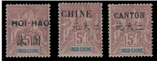
Du n° 149