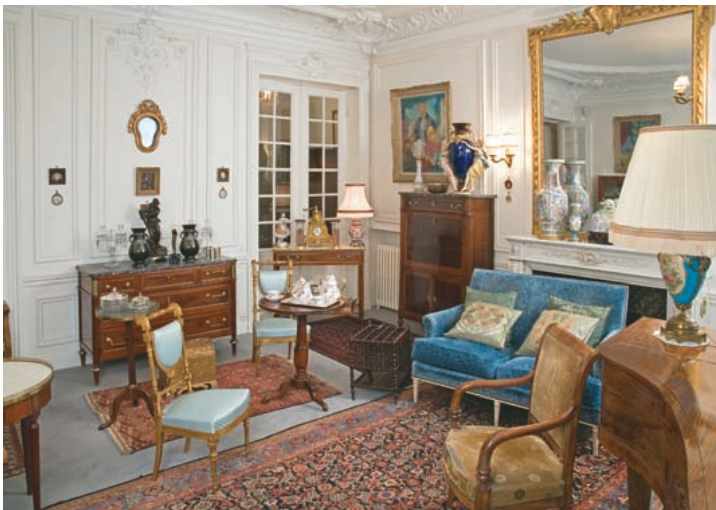
(*) Mobilier et objets d'art provenant d'un appartement parisien.

242 Petite table de campagne en acajou et placage d'acajou blond à plateau évidé à pans coupés, elle ouvre à un tiroir latéral et repose sur quatre pieds gaines amovibles à vis. Travail du XIX e siècle. (accidents). Haut. : 80 - Larg. : 57 - Prof. : 38 cm. 300 / 400 €