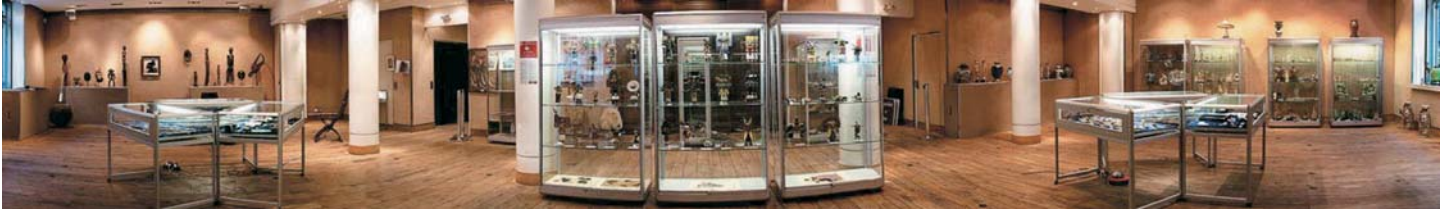
Salle des ventes Rossini 7, rue Rossini 75009 Paris