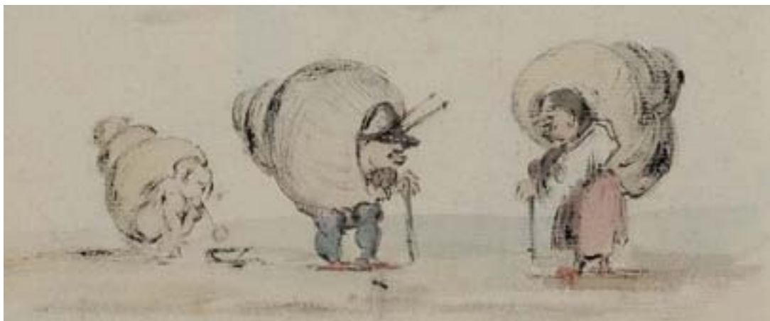
Détail du lot 96