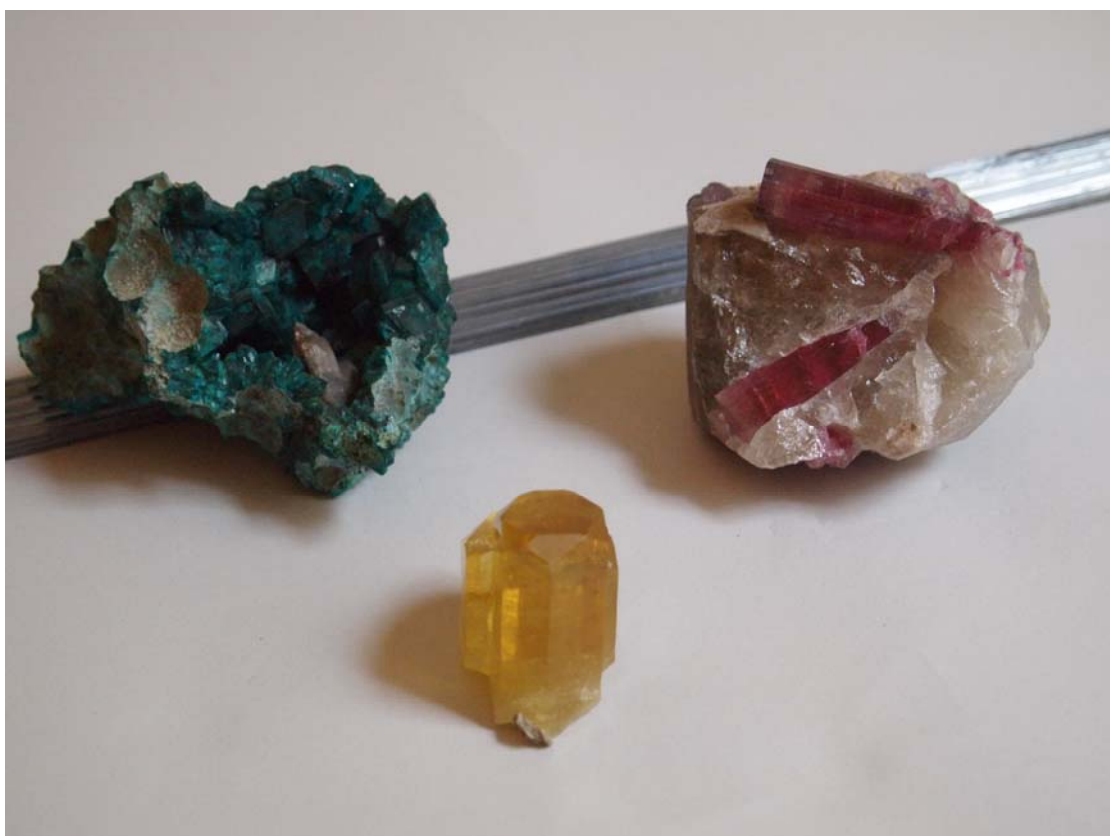
N° 131 Bis