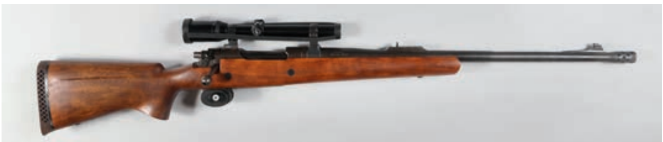
103 - A Square, Annibal , n° de série : 357694, calibre : 416 Weatherby - Montage Crochet et lunette Zeiss Diavari-C 1,5-4,5X18 et frein de bouche Canon : 61, crosse : 360, poids : 5,7 kg