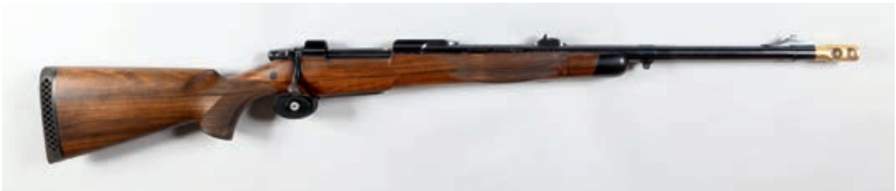
94 - CZ , 550, n° de série : 22022002, calibre : 500 - Jeffery Grain d orge de battue en Ivoire Canon : 60, crosse : 370, poids : 5,250 kg Arme signée Perouze pour Monsieur Meyrignac 2 000/2 500 €