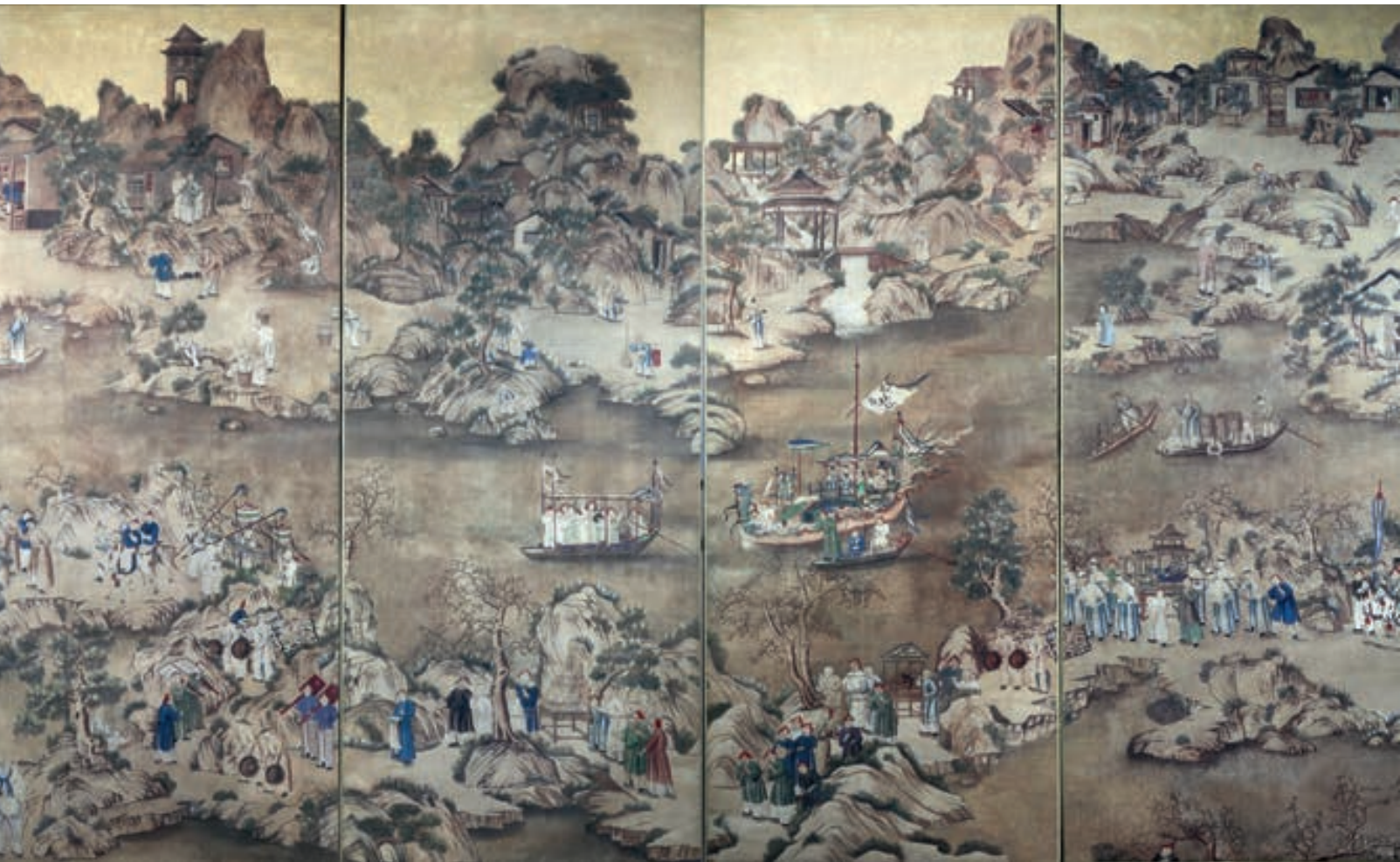
157 - Ensemble de huit lés de papiers-peints, à décor de paysages d'après les décors de Canton du XVIIIème siècle 248 x 100 cm chaque On y joint deux encadrements à décors de combattants