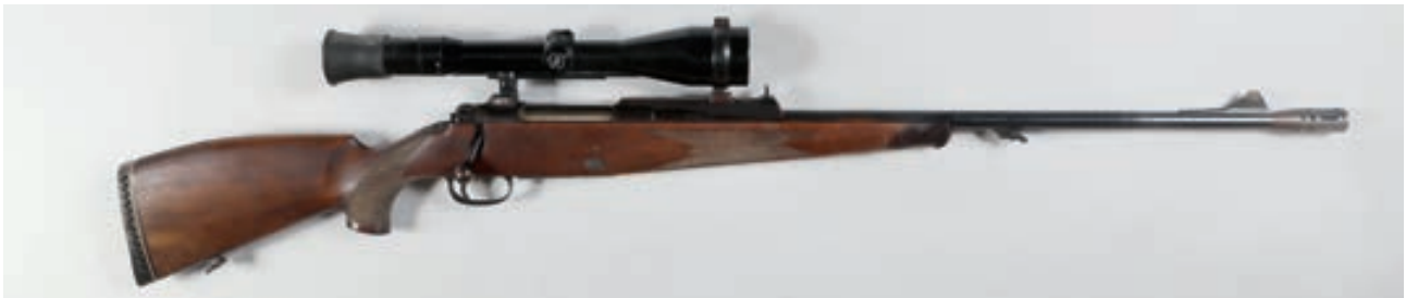
97 - Mauser, 77 , n° de série : 01889, calibre : 9,3X64 Lunette zeiss Diavari 2,5-10X52 avec deux chargeurs Canon : 61, crosse : 350, poids : 3,9 kg Frein de bouche supradax montage crochet Stecher