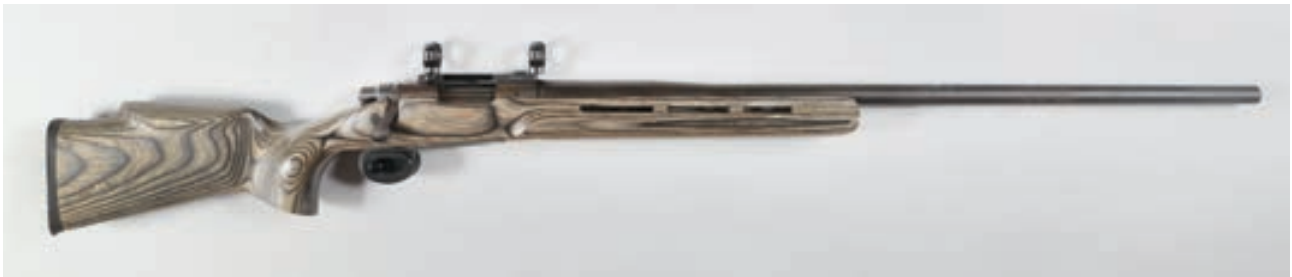
89 - Remington, 700 , n° de série : G6287295, calibre 220 ACKLEY - Canon Varmint montage fixe en 25,4 Crosse bois lamellé collé, Canon : 77, calibre : 370, poids : 5,1 kg