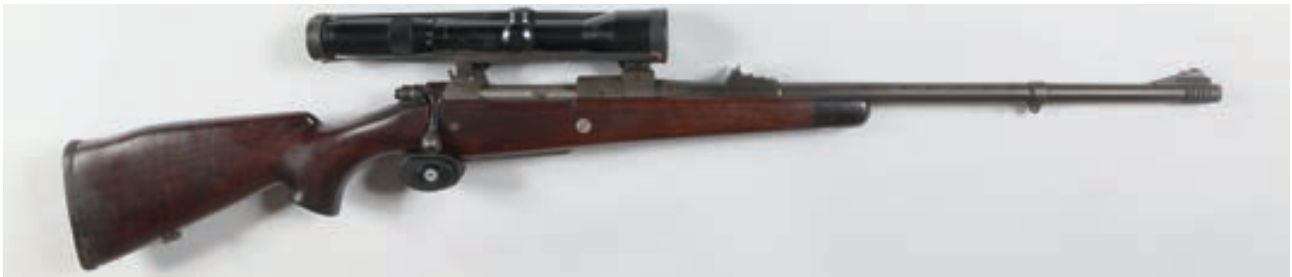
101 - CZ, Oelleton , n° de série : 08045, calibre : 458 - Gun And Amno Frein de bouche et lunette Nickel à rail en 1,5-6X42 Canon : 61, crosse : 370, poids : 4,9 kg Etat de l arme moyen