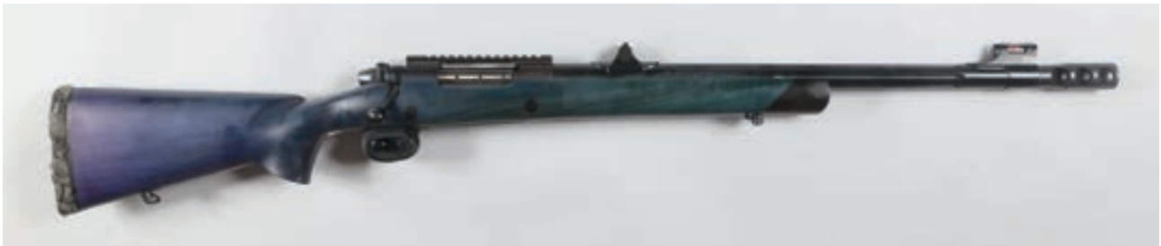
113 - Weatherby, Mark V Customisé , n° de série : P62437, calibre : 475 Atkinson et Maquart - Canon Fluté, frein de bouche, œillette et crosse synthétiques. Arme réalisée pour Monsieur Meyrignac, Montage Piccatiny Canon : 56, crosse : 370, poids : 5,6 kg Pièce unique pour Monsieur Meyrignac