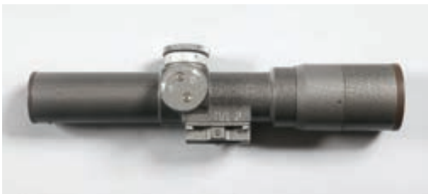
129 - Russe , n° de série : N9302204 1 Lunette Russe