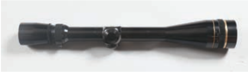
131 - Leupold, Vari-X 6,5-20, n° de série : 221721D 1 Lunette de Tir Leupold pour le tir a longue distance