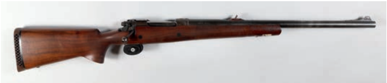
93 - A Square , Annibal, n° de série : 43944, Calibre : 500 - A Square Arme d'origine Canon : 61, Crosse : 390, poids : 5 kg Arme d'origine 1 300/1 800 €