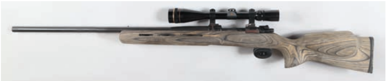
102 - Mauser, 1944 , n° de serie A202, calibre : 224 Clark - Canon Varmint , crosse synthétique, montage sur Rail 11 mm avec Lunette Leupold VariX3 en 6,5 X20 Canon : 73, crosse : 375, poids : 5,7 kg Arme d'origine état neuf