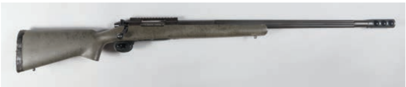
107 - Weatherby, Mark V , n° de série : H105889, calibre : 416 Weatherby - Frein de bouche et montage pivotant - Canon : 66, crosse : 360, poids : 4,8 kg Frein de Bouche Montage Piccatiny, Stecher weatherby, crosse synthétique verte