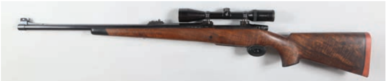
98 - CZ, Bush par armurerie du Maine , n° de série : 2001, calibre : 505 Gibbs Noyer 5 étoiles - Boitier CZ, Hausse 3 Feuillet (manque feuillet 100) - Lunette Swarovski 3-10x42 Habicht et Montage amovible devant ébène Canon : 66, crosse : 360, poids : 7,730 kg