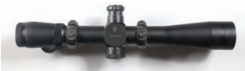
133 - Leupold, Mark 4 3,5-10x40, n° de série : 200682N 1 Lunette Leupold Mark 4 neuve en 3,5-10x40 Réticule lumineux