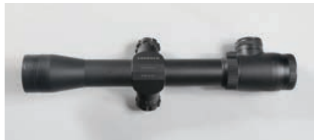
130 - Leupold, 3X9 à réticule lumineux , n° de série : 286798M 1 Lunette a réticule lumineux en état neuf