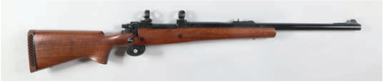
92 - A Square , n° de série : 216302, calibre : 500 A Square - Un montage amovible Canon: 61, Crosse : 365 poids : 4,950 kg 700/900 €