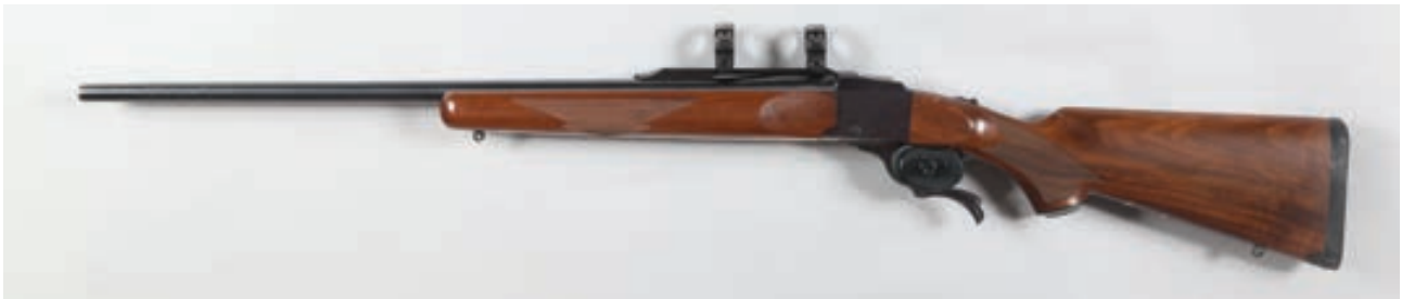
90 - Ruger, Numéro 1 , numéro de série :13394721, calibre : 243 WIN - Arme d'origine avec montage fixe sur rail Canon : 66, Crosse : 360, poids : 4 kg Arme d'origine état neuf