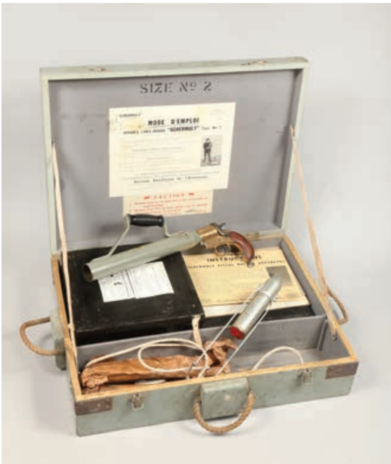
134 - Coffret en bois avec lance-Amarre Sermuly type 2 Boite complète avec corde, lance amarre, pistolet et notice. (1965) Munition Fusée international n°2