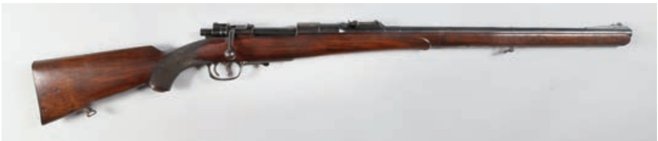
95 - Mauser , 98 Stutzen, n° de série : 99505, calibre : 10,75X68 - Canon : 60, crosse : 380, poids : 3,6 kg Arme originale Mauser avec stecher (quelques munitions et kit rechargement) 300/400 €