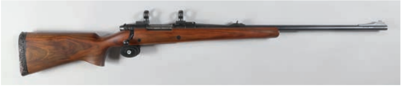
104 - Weatherby, Mark V , n° de série : P62386, calibre : 460 Weatherby - Frein de bouche et montage amovible avec collier en 25,4 Canon : 66, crosse : 360, poids : 4,6 kg Crosse non quadrillée et renforcée