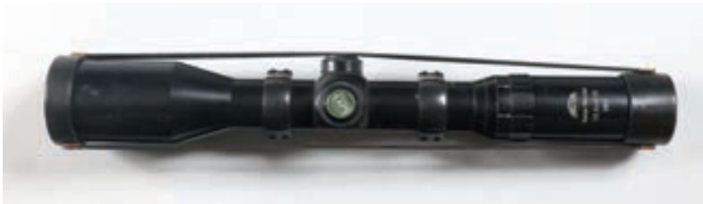
132 - Karl Kaps, ASLAR 1,5-6x42, n° de série : 2852 1 Lunette Karl Kaps en 1,5-6x42 avec montage pivotant