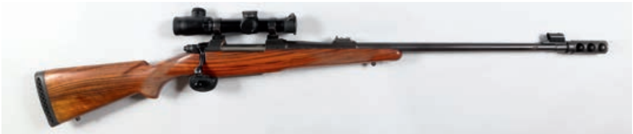
110 - CZ , 550, n° de série : 19702, calibre : 375 MERIGNAC - Frein de bouche et lunette Leupold à reticule lumineux en 2,5 X 5 sur Montage CZ Canon : 61, crosse : 370, poids : 5,730 kg Quelques cartouches fournies pour rechargement