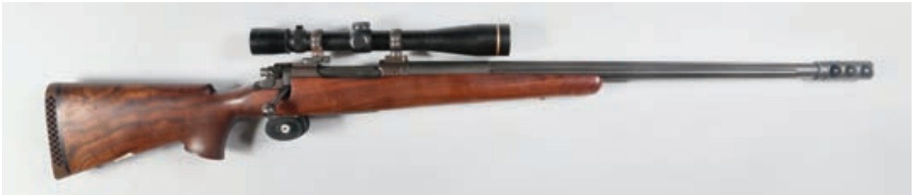
108 - A Square , Hamilcar, n° de série :25098, calibre : 300 Weatherby - Carabine et lunette Leupold VX3 en 6,5x20 crosse en beau noyer et canon Fluté Canon : 66, crosse : 370, poids : 5,550 kg