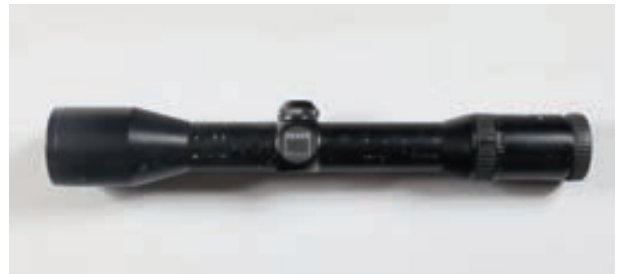
128 - Zeiss, Diavari Z 1,5-6x42 T , n° de série : 617952 1 Lunette Zeiss Diavari Z en 1,5-6x42 T - quelques éclats de peinture