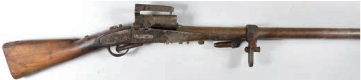
114 - Canardière , Probablement belge, n° de série : 131, calibre : 4 Canardière probablement Belge, état d'origine avec lot de cartouches Canon : 120; Crosse 330, poids : 7 kg env.