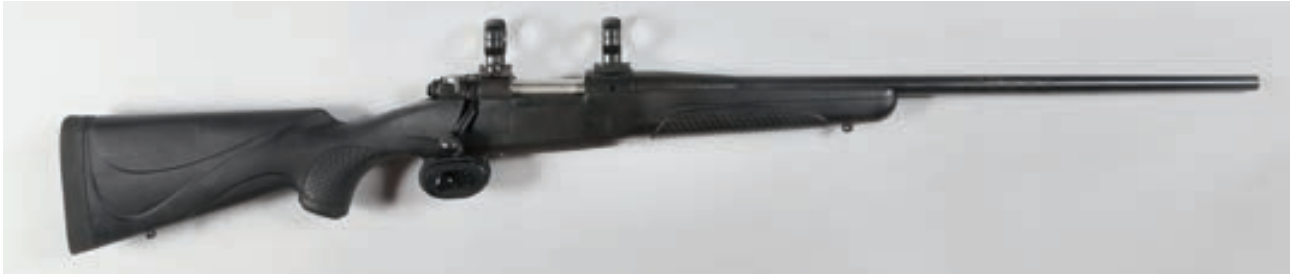
88 - Winchester, 70 , crosse : G2526804, numéro de série : 223WSM - Crosse synthétique, montage fixe diamètre 25,4 Canon : 56, Crosse : 355, poids : 3,1 kg Arme d'origine état neuf