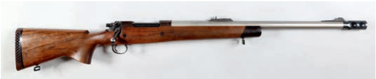
109 - Asquare , Annibal, n° de série : W237232, calibre : 577 Tyrannosaur - Frein de Bouche Canon : 61, crosse : 350, poids : 6,1 kg Crosse non quadrillée et renforcée hausse à feuillets