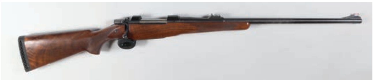
91 - CZ, 550 , n° de série : E2692 ; calibre : 416 - Canon : 66, crosse : 370, poids : 4,3 kg Arme d'origine état neuf