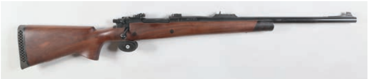
105 - A Square, Annibal , n° de série : 96, calibre : 470 Capstick - Hausse 3 feuillets Joli noyer Montage pivotant, devant ébène Canon : 61, crosse : 370, poids : 4,6 kg Arme en état proche du neuf