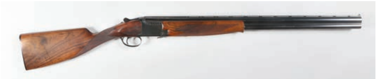
126 - Browning, B25 , n° de série : 63216S77, calibre 12 Etat neuf - Canon : 70, crosse : 365, poids 3,100 kg Arme en état neuf, mono détente crosse anglaise 1/2 et 3/4 avec étui jambon