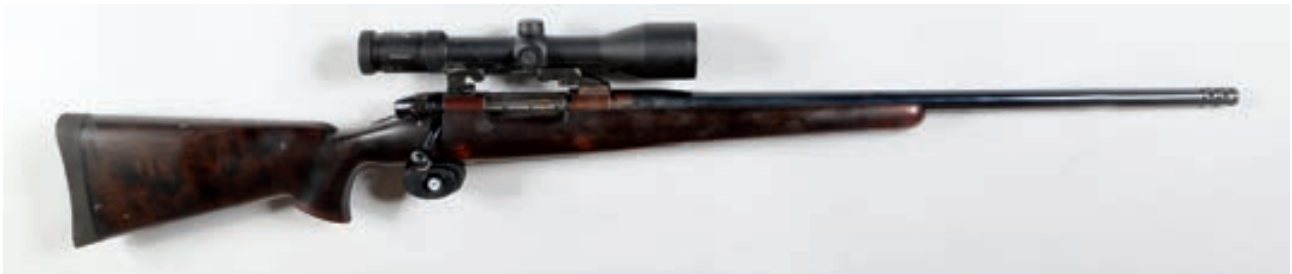
106 - Weatherby, Mark V , n° de série : H212607, calibre : 416 Weatherby - Montage pivotant et lunette Zeiss Diavari 2,5-10x50 à réticule lumineux et frein de bouche Canon : 61, crosse : 380, poids : 5,2 kg Etat proche du neuf