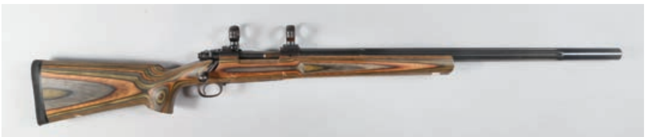
111 - Winchester , 70 Custom, n° de série : 525293, calibre : 6,5.300 Meyrignac - Crosse Synthétique en Micarta et montage en diamètre 25,4 canon fluté Canon : 56, crosse : 365, poids : 5,2 kg Arme unique pour Monsieur Meyrignac