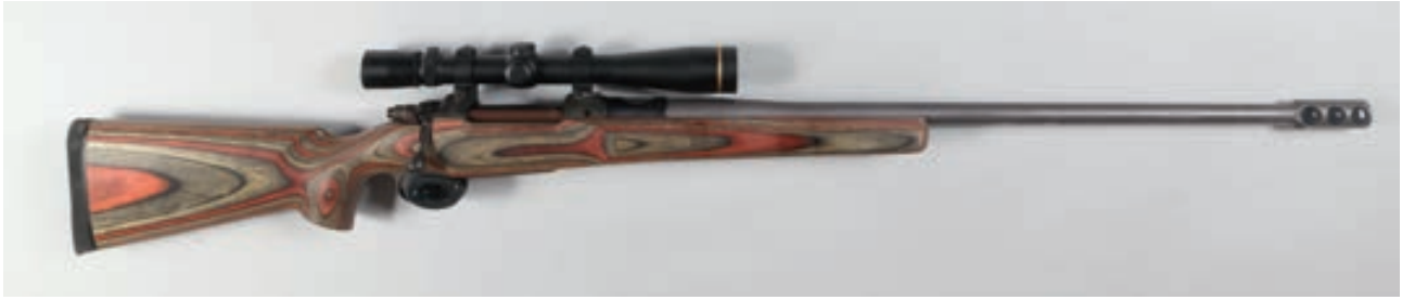
125 - Carabine CZ 602 ZKK calibre en Mérignac, n° de série : 24823 calibre 338 - canon de 71 cm et frein de bouche, crosse en lamellée collée de 380 mm, stetcher et lunette Leupold VX 3 en 6.5-20x40 Canon : 71, calibre : 380, poids : 6 kg