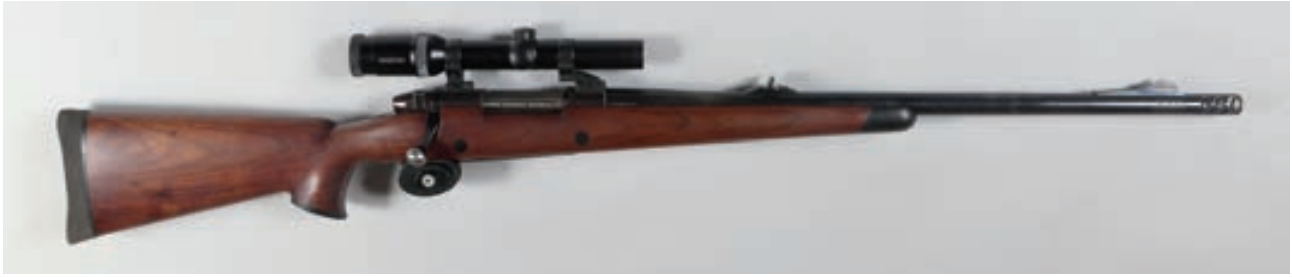
100 - Weatherby, Mark V , n° de série : P62420, Calibre : 460 Weatherby - Montage pivotant EAW et lunette Swarovski Habicht 1,25-4x24 devant ébène et frein de bouche Canon : 61, crosse, 370, poids : 5,250 kg