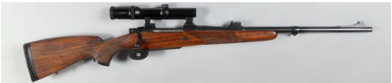
99 - CZ , n° de série : 18731, calibre : 458 Lott, Montage pivotant et lunette Swarovski Habicht 1,25-4X24 à rail, hausse à triple feuillets Canon : 61, Crosse : 375, poids : 4,750 kg Arme en état proche du neuf