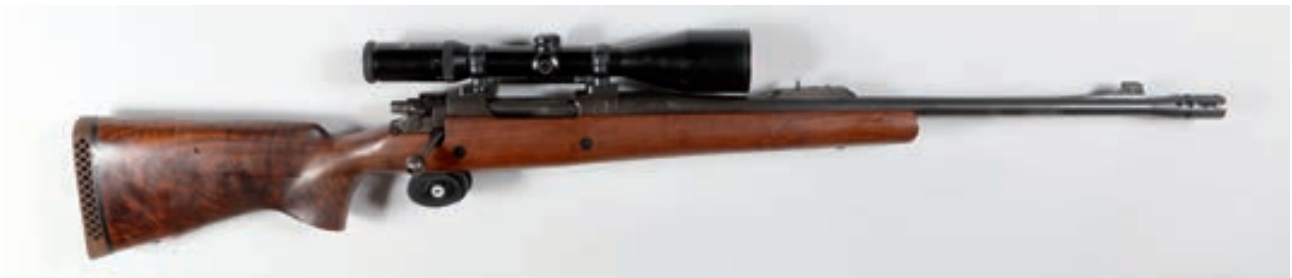
96 - A Square, Annibal , n° de série : 236496, Calibre : 338 - A square Frein de bouche, montage pivotant lunette Schmitt & Bender 2,5-10x56 à réticule lumineux, joli noyer Canon : 56, calibre : 370, poids : 5,2 kg