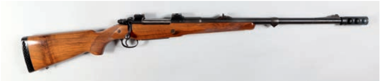
112 - CZ, 602ZZK , n° de série : 25347, calibre : 416PPM - Frein de bouche et montage pivotant Canon : 56, crosse : 365 poids : 4,450 kg Frein de Bouche montage eaw