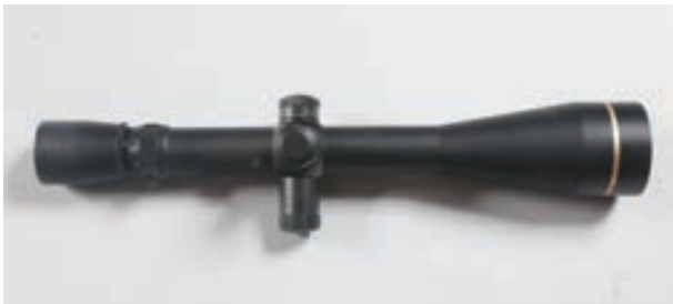
127 - Leupold, Vari-X 6,5-20X50 , n° de série : 244115K 1 Lunette de Tir Leupold Neuve pour le tir à longue distance avec réglage de paralaxe