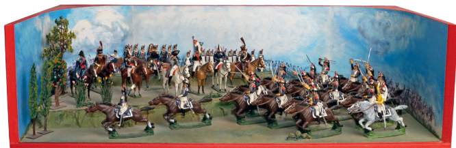
Boîte diorama « BATAILLE DE FIEDLAND ». 300 / 400 €