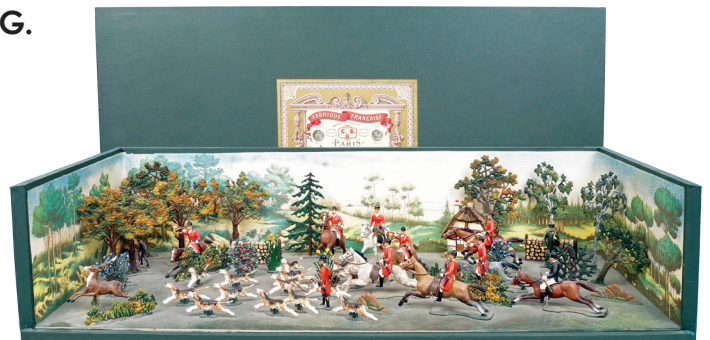
BOÎTE diorama « CHASSE À COURRE ». Réf. : 709. 300 / 400 €