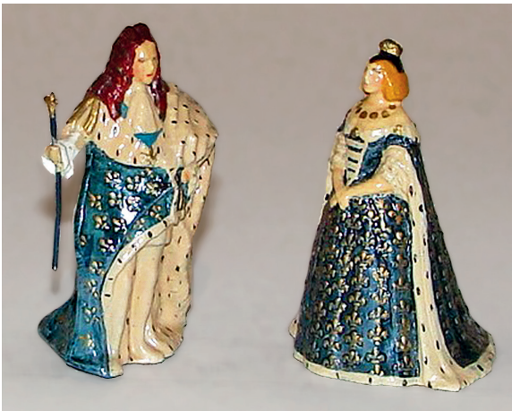
Louis XIV et Marie-Thérèse d'Autriche en costume de Sacre. 200 / 300 €