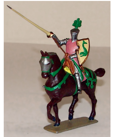
Chevalier à la joute (repeints). 300 / 350 €