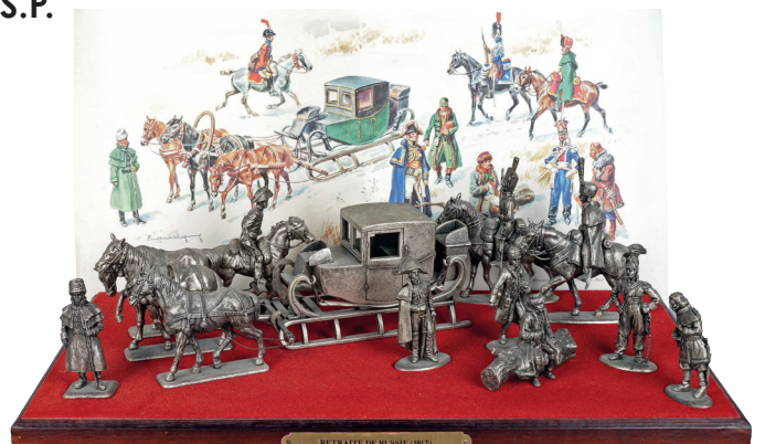
La bataille de Russie. 60 / 80 €