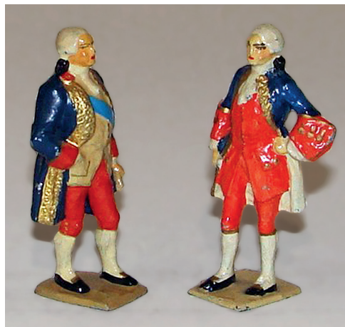
La Pérouse – Suffren. 200 / 300 €