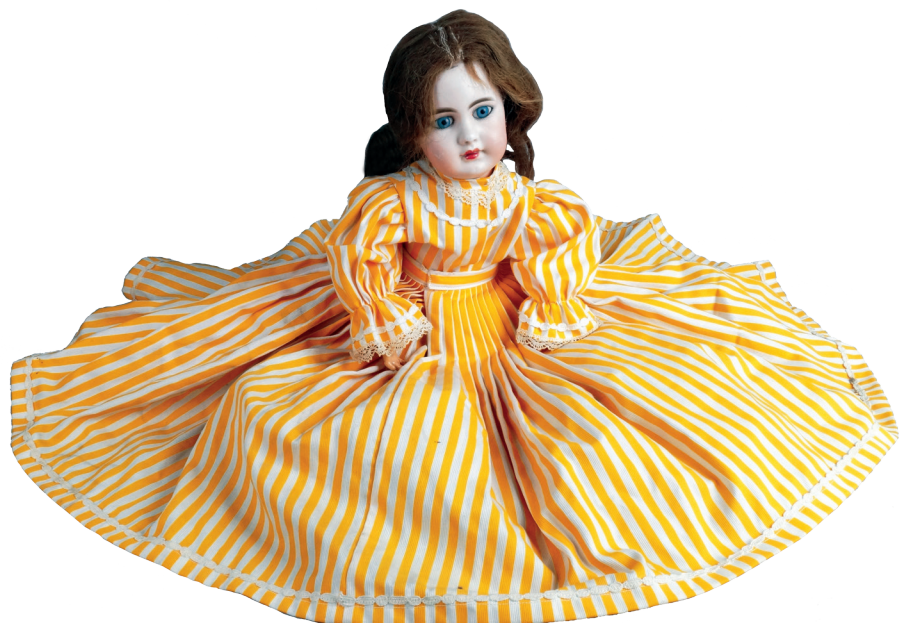
BÉBÉ de fabrication allemande avec tête en biscuit coulé, bouche ouverte, yeux fixes bleus en verre, moule 939 de la maison SIMON & HALBIG (circa 1888), corps d'origine entièrement articulé en composition et bois (un doigt accidenté main gauche), oreilles percées ornées de clous d'oreille sertis d'une pierre rouge, perruque en cheveux naturels. Haut. : 52 cm 350 / 400 €