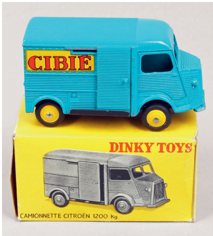
CITROËN CAMIONNETTE 1200K CIBIE. Réf. 561. A.b. 80 / 120 €