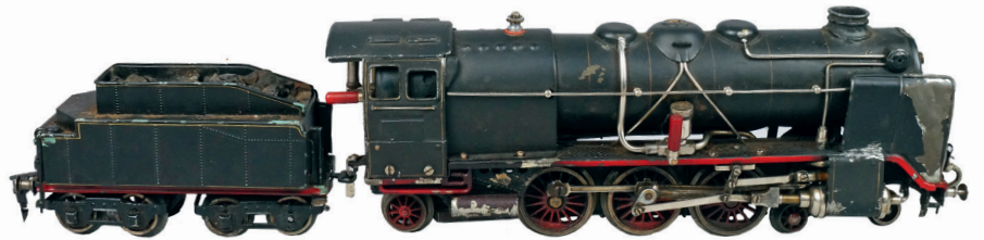
ÉCARTEMENT "O" LOCOMOTIVE 231 « MÄRKLIN HR 4229/0 » avec son tender, deux essieux, livrée noir, liseré rouge. (Accidents). 800 / 1 000 €