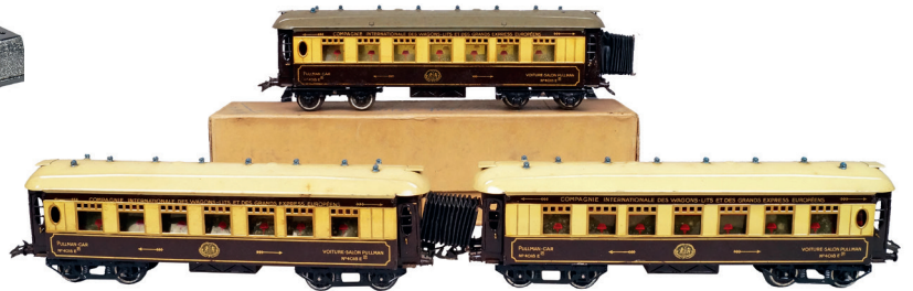
ÉCARTEMENT "O" TROIS VOITURES Hornby "Étoile du Nord" CIWL. 200 / 300 €