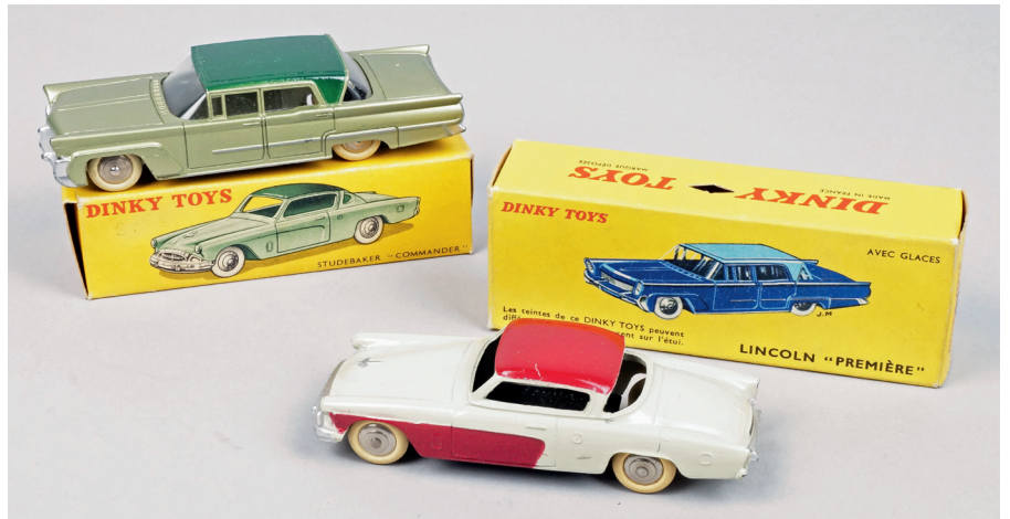
STUDE BAKER - "COMMANDER", réf. : 540. A.b. - LINCOLN première, réf. : 532. A.b. 120 / 180 €