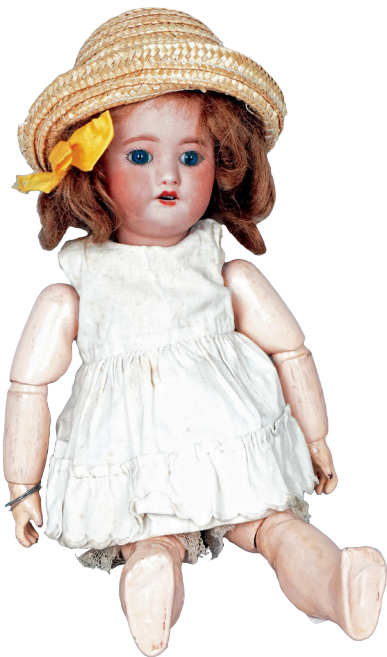
BLEUETTE avec tête en biscuit bouche ouverte yeux fixes marquée "SFBJ 60 Paris 8/10", corps articulé d'origine marqué 2 et 1. (Trait de cuisson sur le front). Haut. : 27 cm 300 / 400 €