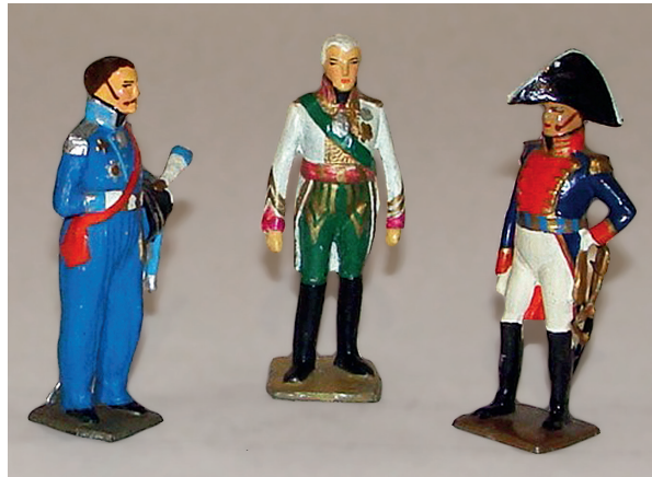
Larrey – Général Platov – François II d'Autriche. 200 / 300 €