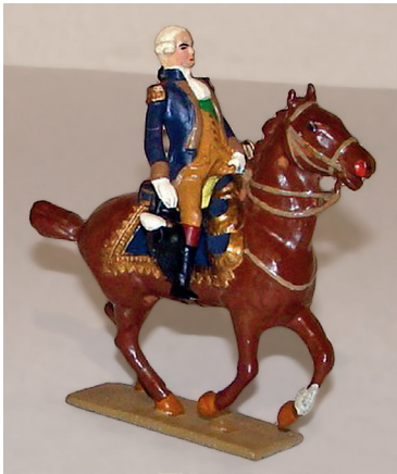
La Fayette à cheval. 300 / 350 €