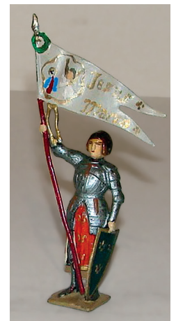
Jeanne d'Arc. 200 / 250 €