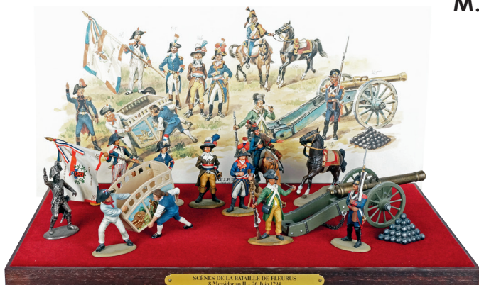
Scène de la bataille de Fleurus. 60 / 80 €