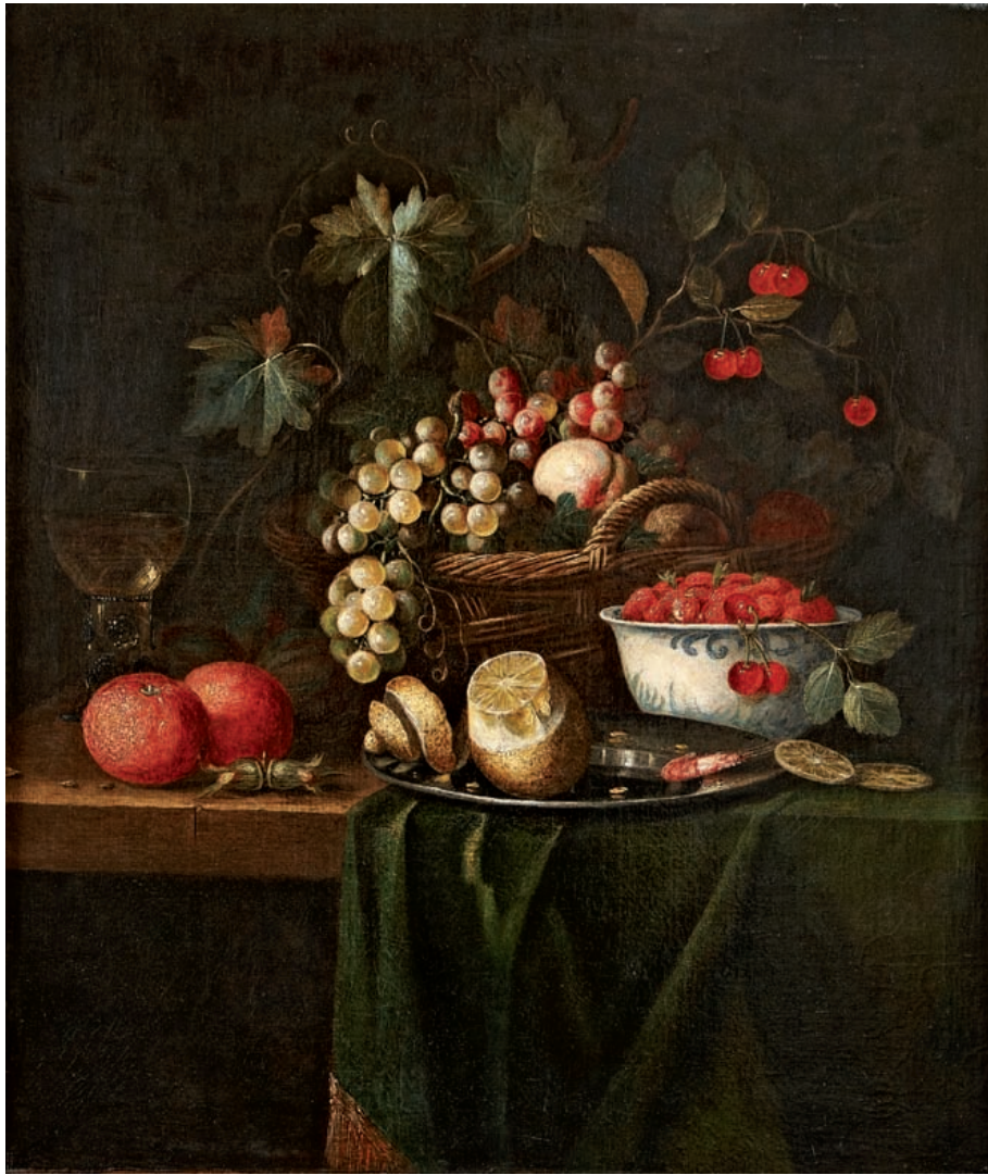
27 Ecole FLAMANDE du XVIIIème siècle Nature morte aux fruits sur une table Toile 70 x 60 cm