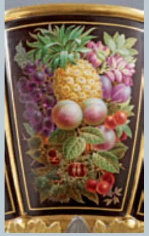
Voir détails reproduits en première et quatrième de couverture