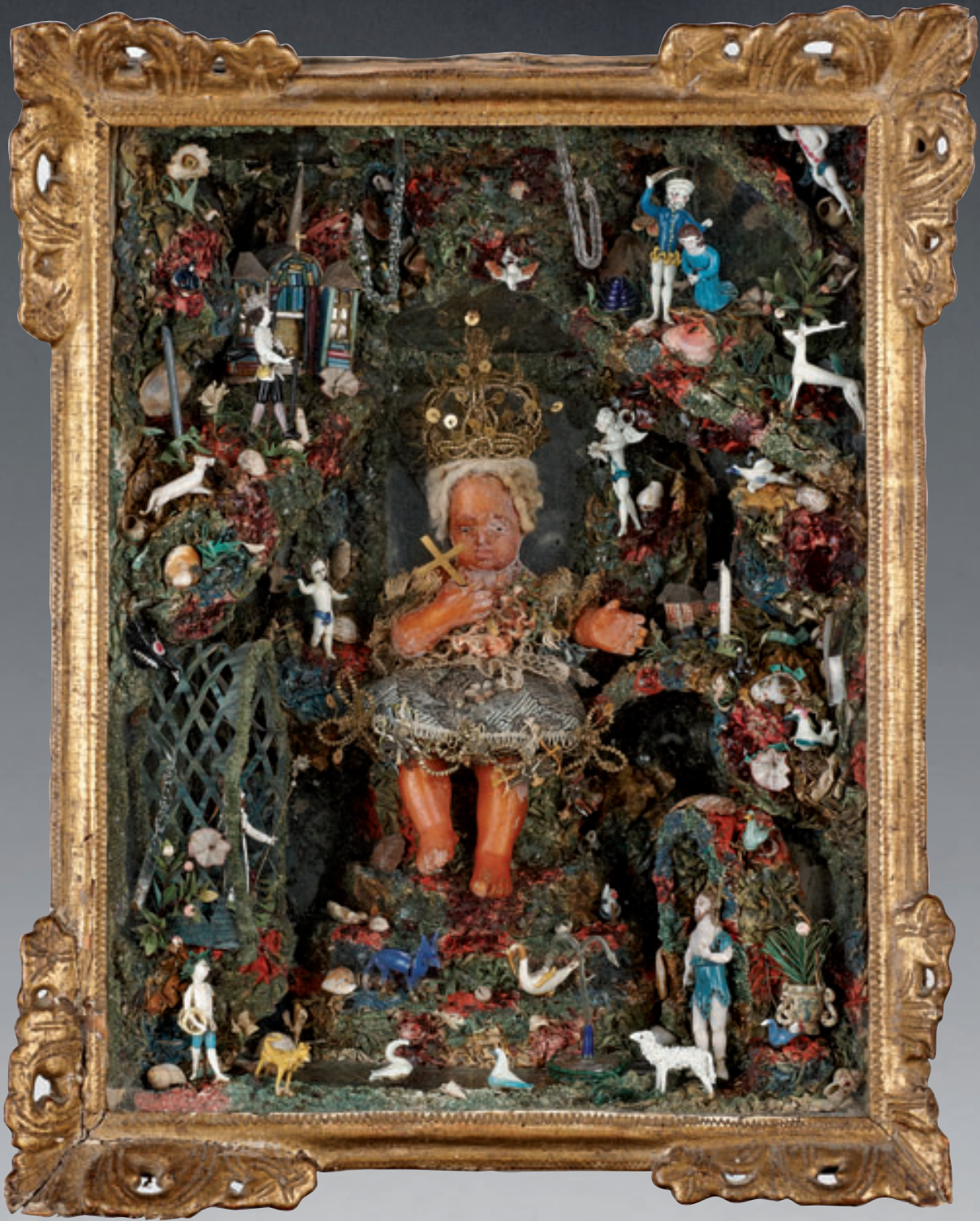
1 VERRE FILE DE NEVERS. Présentée dans une boîte vitrine rectangulaire avec cadre en bois doré, « une Nativité » avec l'Enfant Jésus en cire couronné couché sur un miroir tenant une croix dans sa main droite, il est vêtu d'une tunique à fils d'argent, au-dessus église en bois (moelle de sureau) peinte, nombreux personnages, animaux et objets, en verre émaillé dit "verre filé" : un homme une canne à la main devant l'église, de l'autre côté un homme épée levée sur une femme les yeux bandés à genoux (probablement Sainte Tanche qui eut la tête tranchée par un domestique à qui elle se refusait), nombreux angelots, un berger et son mouton, un moine dans une chapelle, un homme un panier à la main, parmi les animaux : mouton, chien, âne, poules, pélican, canards, Parmi les objets : vase fleuri, jet d'eau, bougeoirs, et draperies. XVIIIème siècle.