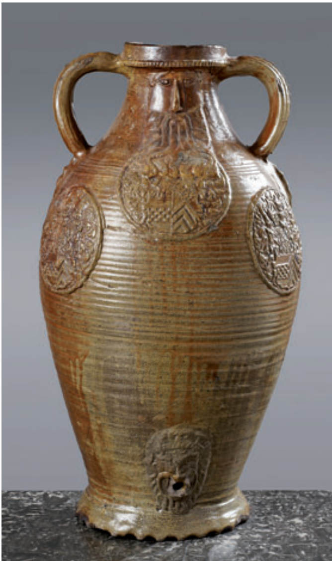
95 Raeren. Grande amphore à deux anses latérales en grès à glaçure beige à paroi annelée, deux masques d'homme barbu en relief sous le col, la panse ornée de six médaillons contenant une armoirie répétée et la date 1613. Début du XVII ème siècle. H. 61 cm. Petits éclats. 3 000/5 000 €