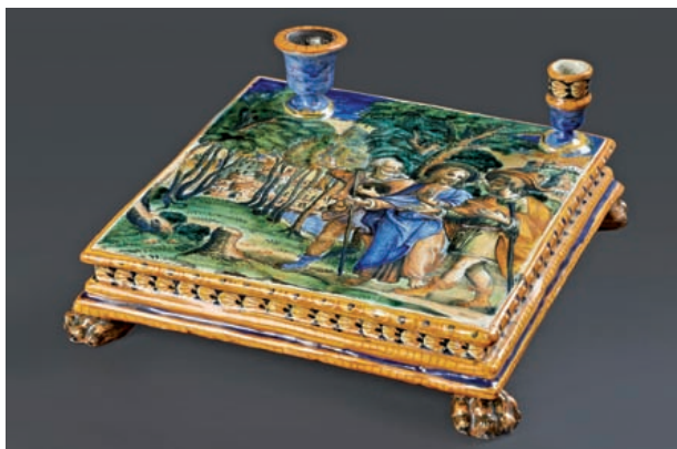
Détail du lot 47