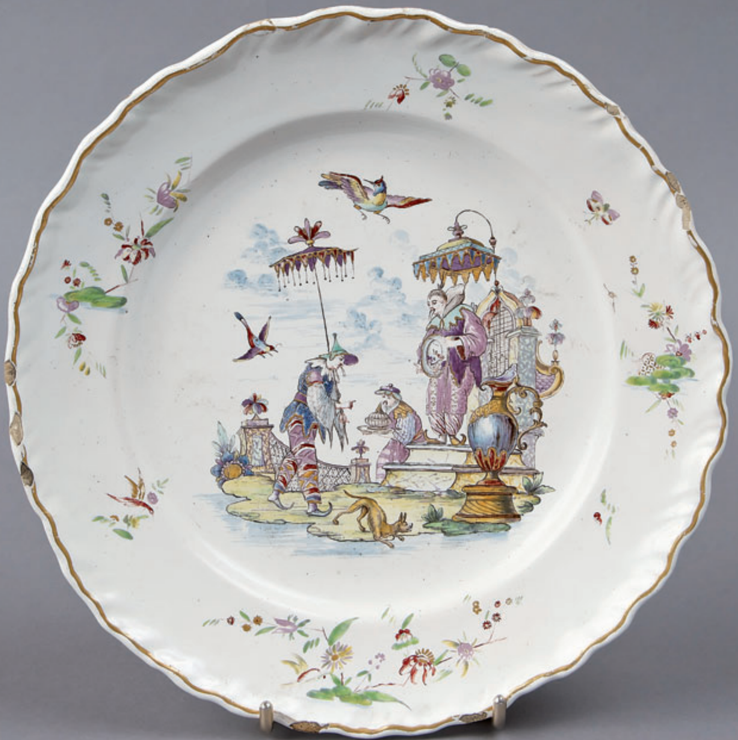
110 ITALIE, assiette à bordure contournée, à décor polychrome d'une scène animée de chinois, oiseaux en vol. Sur l'aile tiges fleuries et filet or. XVIII e siècle. D. 24 cm.