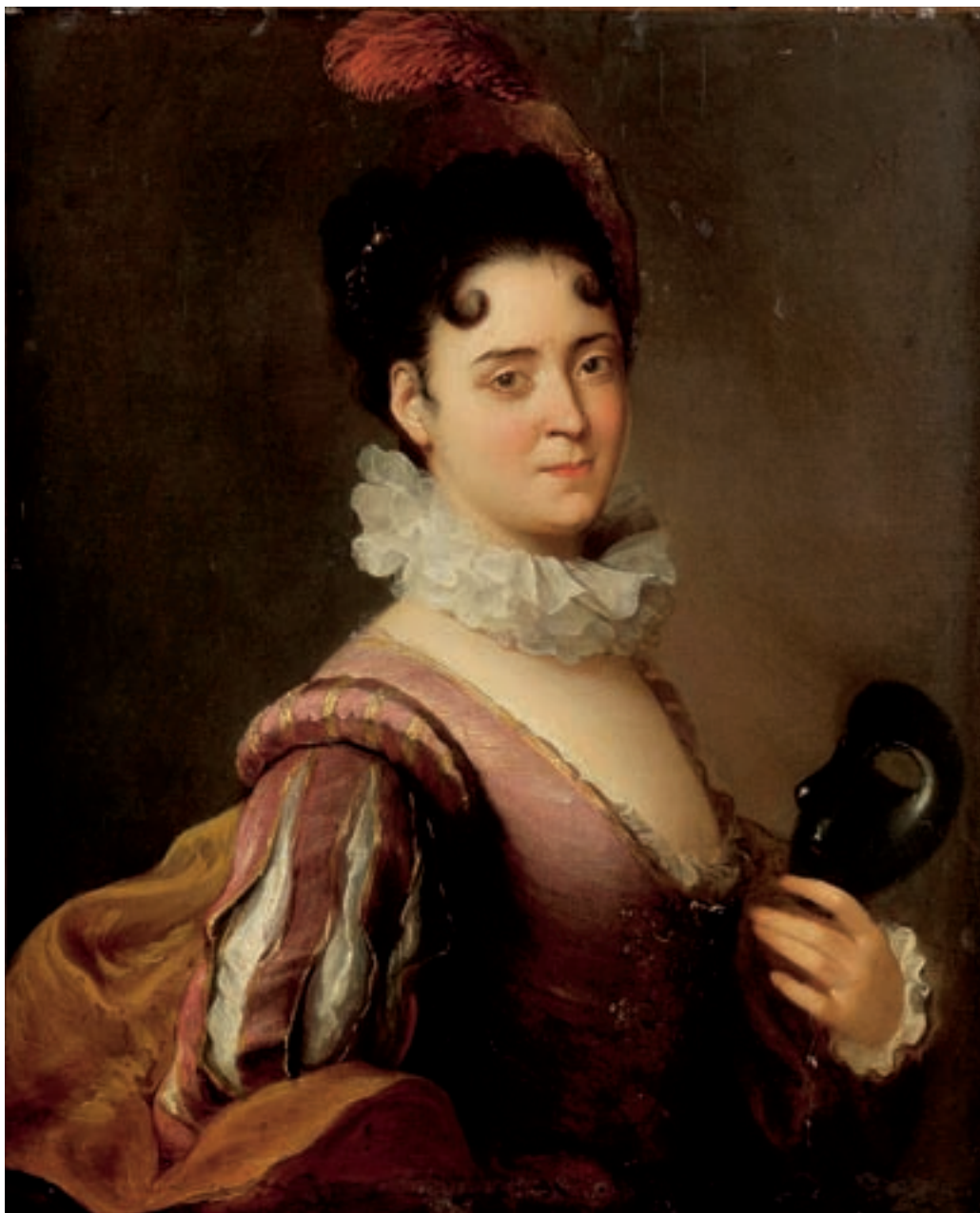
120 Alexis GRIMOU (Romont vers 1680 – Paris après 1733) Portrait de femme au masque Toile. Signé et daté en bas à gauche Grimou / 1709 . Restaurations 74 x 59,5 cm