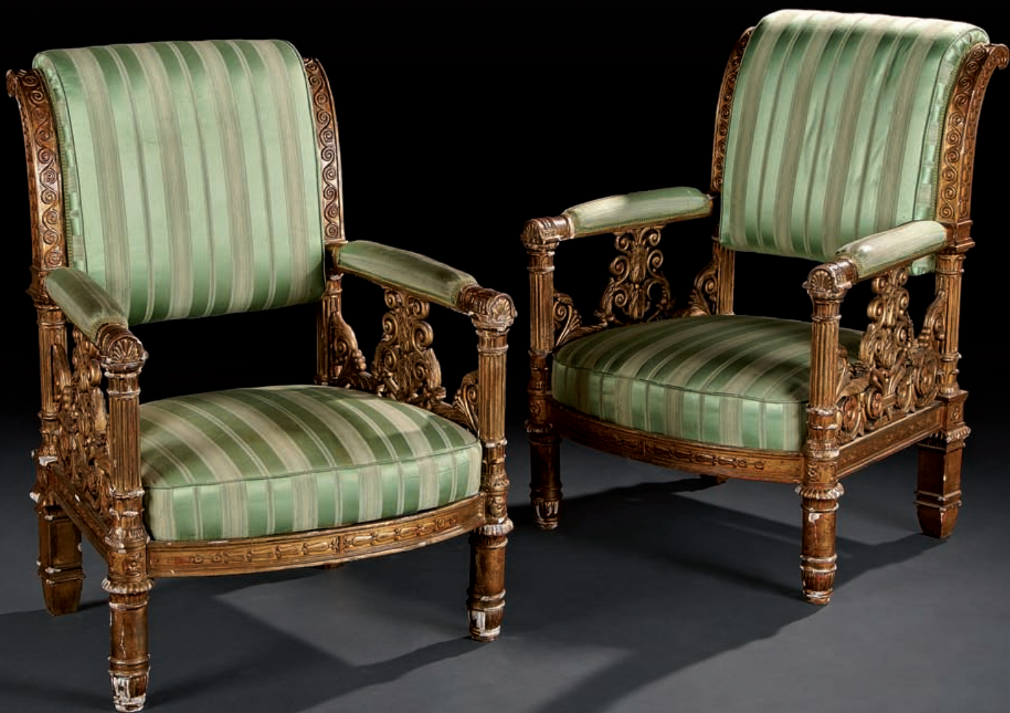
*48 PAIRE DE FAUTEUILS d'apparat en bois doré, les dossiers renversés sont sculptés de frises de volutes ; les bases d'accoudoirs en colonne sont surmontées de motifs semi-circulaires. Sous les accoudoirs, d'importants motifs ajourés à décor de rinceaux, volutes feuillagées et fleurs. Pieds avant colonne décorés de godrons, pieds arrière à section quadrangulaire. Attribués à Karl-Friedrich SCHINKEL. Allemagne vers 1820. H. 91 ; L. 69 cm 6000/8000 €