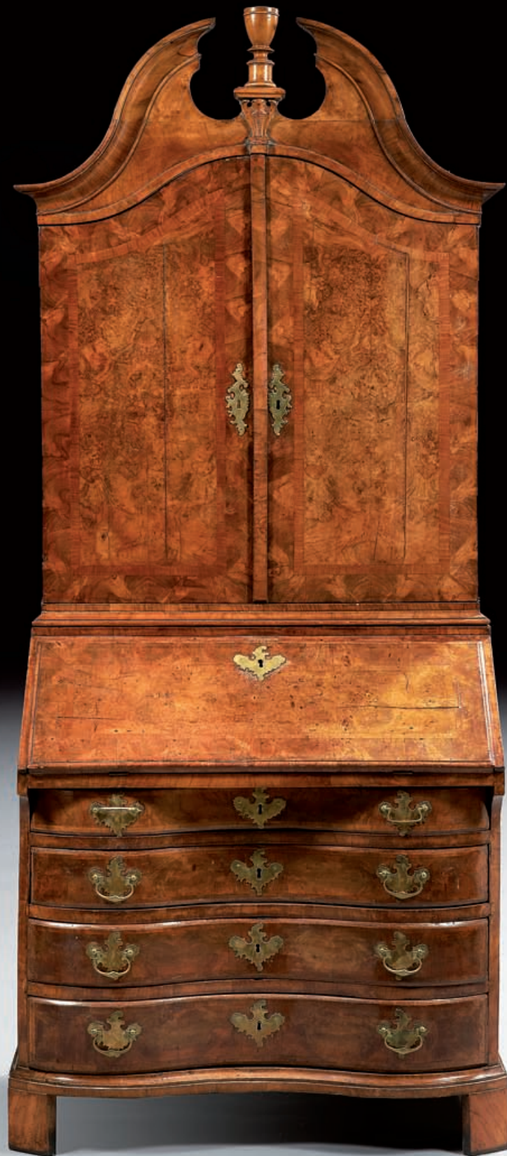
99 MEUBLE SCRIBAN en placage de noyer et ronce de noyer ouvrant en partie basse par quatre rangs de tiroirs surmontés d'un abattant et en partie haute, cette dernière en retrait, par deux vantaux. Italie du Nord ou Allemagne du Sud. Début XIXème siècle. 236 x 98 x 60 cm. (Restaurations et quelques parties refaites).