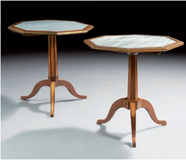
80 - 81