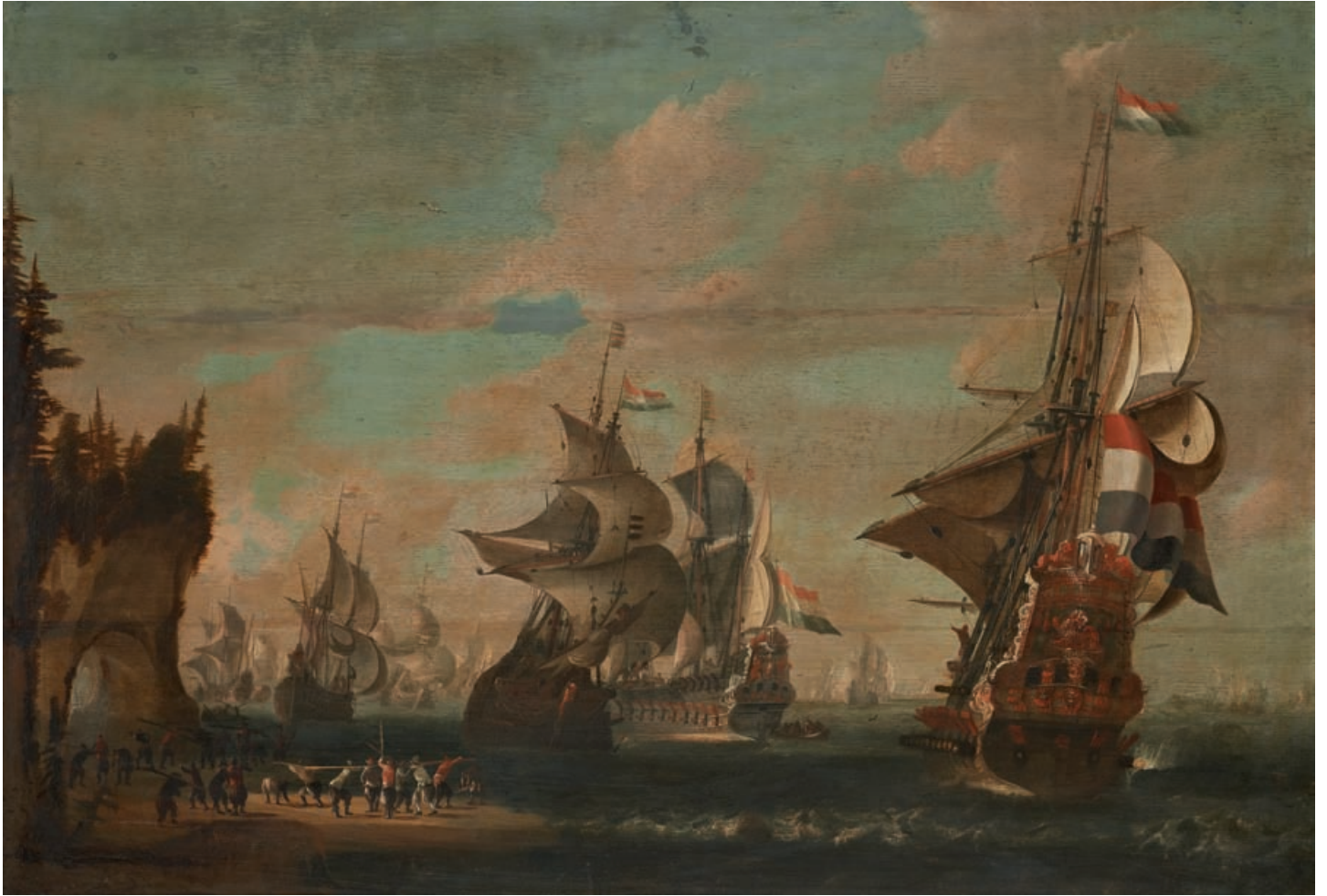
12 J. P. GRUYTER Actif au XVII ème siècle La flotte hollandaise en rade dans un paysage du Nord Huile sur panneau, signée en bas à gauche. 72 x 105 cm