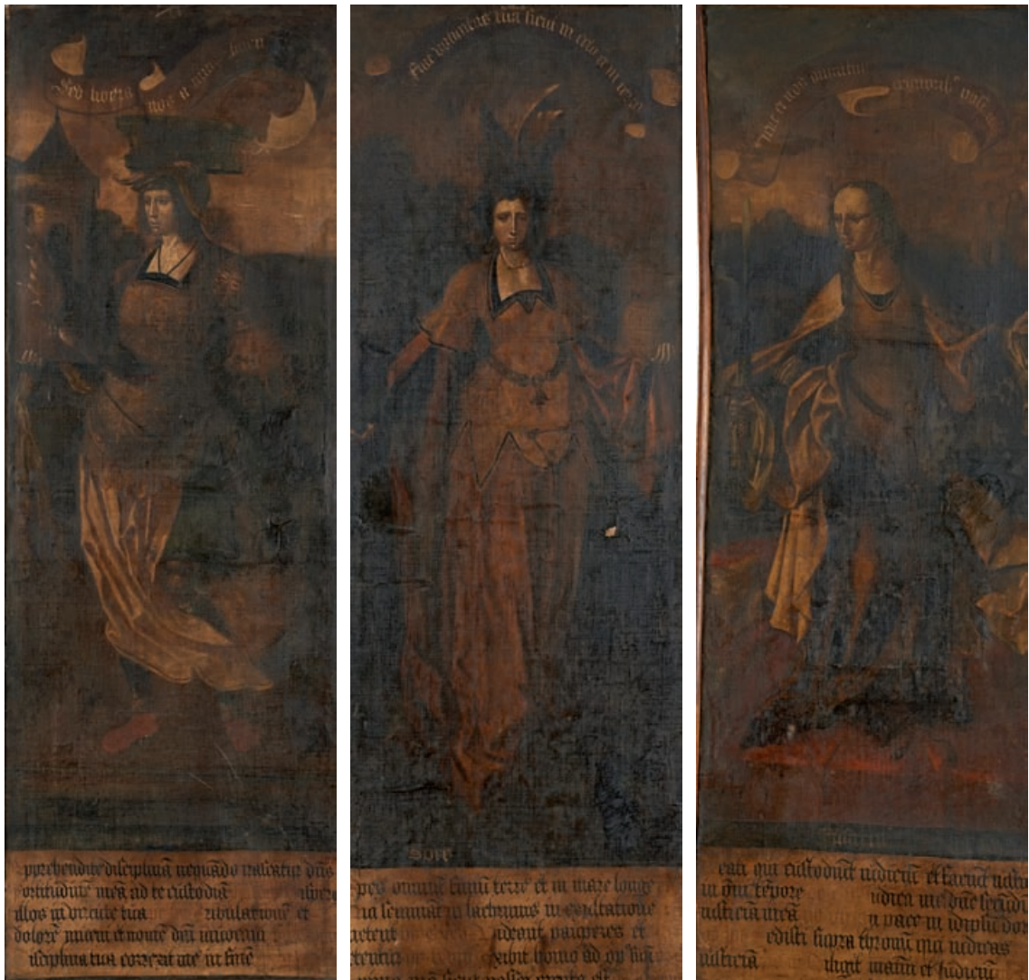
7 Ecole SUISSE du XVIème siècle, suiveur de Niklaus Manuel DEUTSCH Les trois vertus théologiques associées aux quatre vertus cardinales : La foi ; L'espérance ; La charité ; La prudence ; La tempérance ; La force ; La justice Série de sept toiles, sur leurs toiles d'origines 106 x 38 cm Inscriptions Accidents et soulèvements