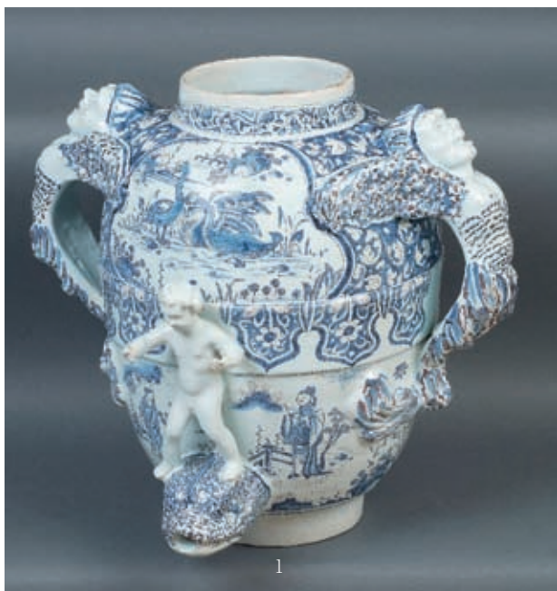
Voir reproduction Planche I