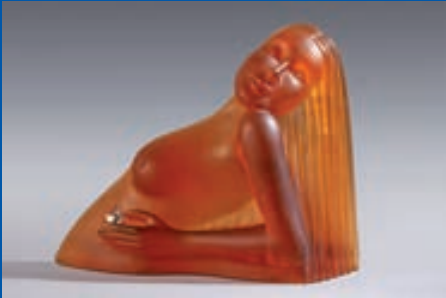
Le Soleil - Dan DAILEY