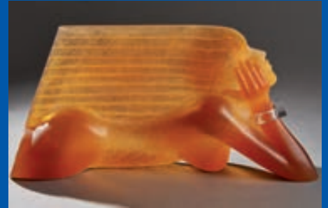
Le Vent - Dan DAILEY

DROUOT RICHELIEU SAMEDI 29 NOVEMBRE SALLE 13 À 14H