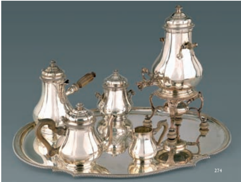
274 IMPORTANT SERVICE À THÉ-CAFÉ quatre pièces en argent bordé de godrons. Avec sa fontaine à thé, son support et sa lampe, et plateau de service de forme contournée, chiffré au centre en métal argenté de même modèle. Orfèvre G. BOIN TABURET. Poids brut des pièces pesables : 2.576 kg Longueur du plateau : 64 cm