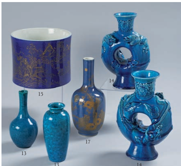
15 Porte-pinceaux "bitong" en porcelaine émaillée bleu poudré et or à décor d'un paysage lacustre et montagneux. Epoque XIXe siècle. H. 15 cm. 500/600 €