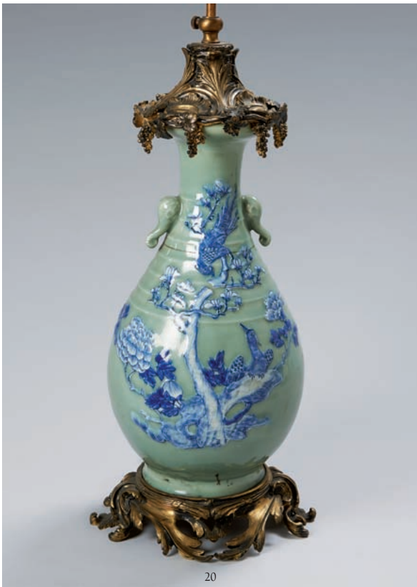
20 Vase balustre en grès émaillé céladon décoré en léger relief d'un oiseau sur un branchage en bleu. Fin du XIX e siècle. H. 58 cm. Monture rocaille en bronze doré au col et à la base. 600/800 €