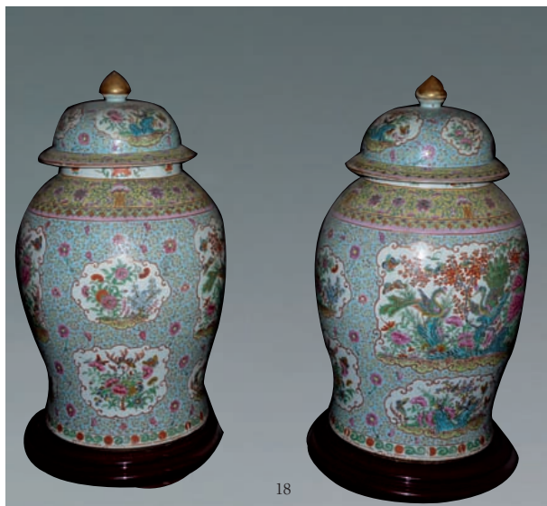
18 Paire d'importantes potiches couvertes en porcelaine décorée en émaux polychromes dans le style de la famille rose de réserves d'oiseaux et papillon survolant des fleurs sur fond bleu turquoise et lotus parmi les rinceaux. L'épaulement et le bord des couvercles ornés de caractères "shou" stylisés parmi les lotus sur fond jaune. Canton. Epoque XIXe siècle H. 62 cm 3 000/4 000 €