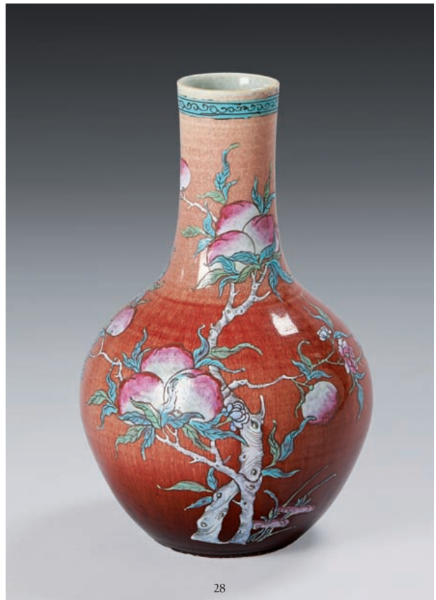
28 Vase de forme bouteille en porcelaine émaillée rouge flammé décorée en émaux polychromes dans le style de la famille rose de branches de pêches de longévité. Epoque XIX e siècle H. 36 cm. 1 500/2 000 €