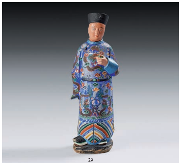
29 Statuette de mandarin debout en grès émaillé polychrome, vêtu d'une robe dragon bleue et tenant une tabatière. La tête mobile. Canton. Epoque XIX e siècle (Egrenures). H. 25 cm. 400/600 €