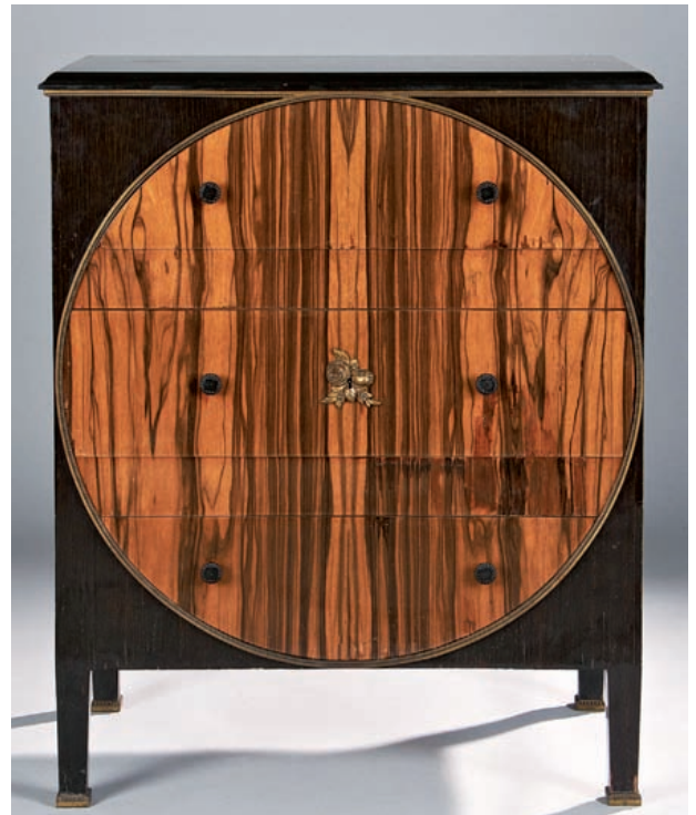
ARTS DÉCORATIFS DU XXÈ 210 665 €

VOS OBJETS D'ART SERONT NOS PROCHAINS RECORDS