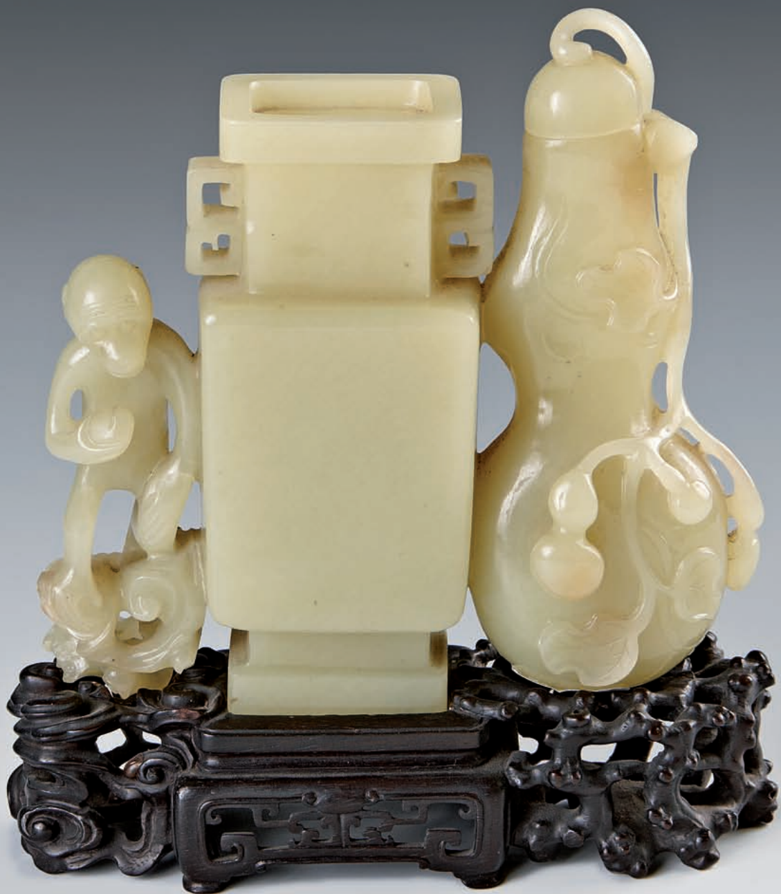
5 Double vase en néphrite jaune formé par un vase rectangulaire à deux anses, un vase couvert en forme de gourde dans son feuillage accompagné par un singe debout sur un rocher et tenant une pêche de longévité. Chine, XVIIIe siècle. (Manque un couvercle, petits accidents). H. 12,2 cm. Socle en bois sculpté.