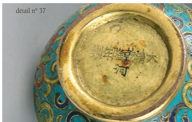
détail n° 37

29 Partie de collier formé par des plaques de cuivre et émaux peints de paires de cailles et millet, paire de carpes, chauves-souris, melons, plaques sonores, pêches de longévité, pruniers en fleurs, pivoines, perle sacrée et billes de verre. Chine, XIXe. (Accidents et manques). 800/1200 €