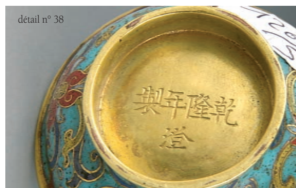
détail n° 38

30 Importante statuette en bronze laqué or, Guanyin assis en padmasana sur un socle en forme de double lotus sortant des flots dans un socle hexagonal, les mains faisant le geste de l'assurance, vitarka mudra et de la méditation, dhyana mudra. La coiffe est ornée d'une couronne dans laquelle se trouve l'image de bouddha. Chine, époque Ming, XVIIe. H. 44 cm. 3000/4000 €