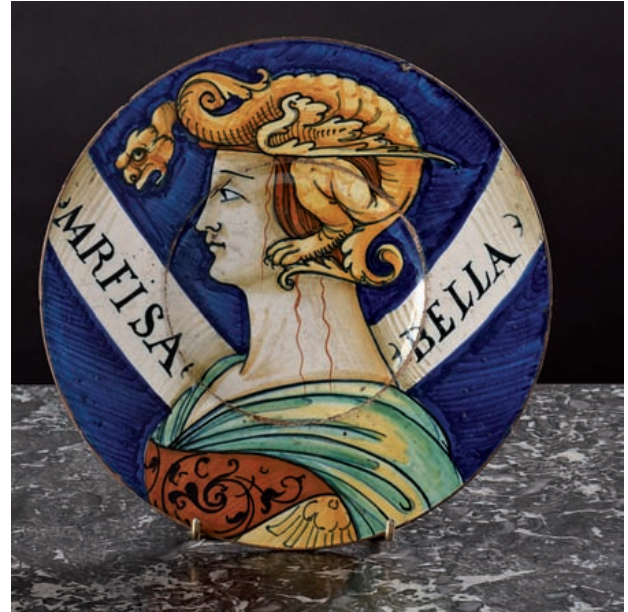
PORCELAINES. FAIENCES 44 610 €