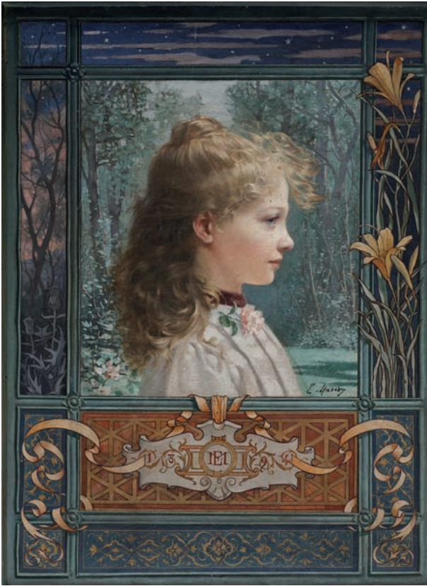
TABLEAUX MODERNES 18590 €