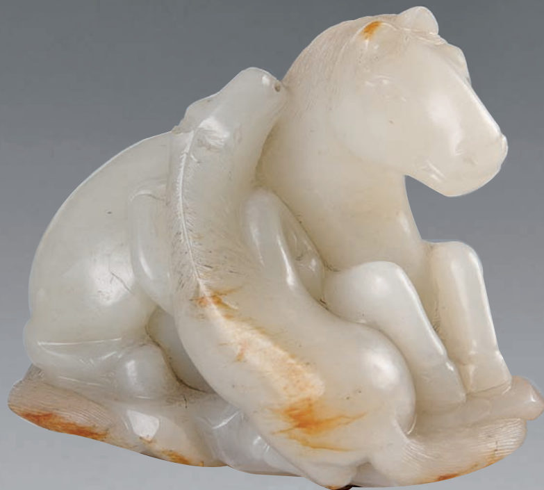
1 Groupe en néphrite blanche et rouille, jument et son poulain couchés. Chine, XVIIIe siècle. (Petites égrenures). H. 6,5 cm. L. 7,8 cm.