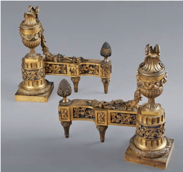
OBJETS D'ART ET MOBILIER 8 930 €