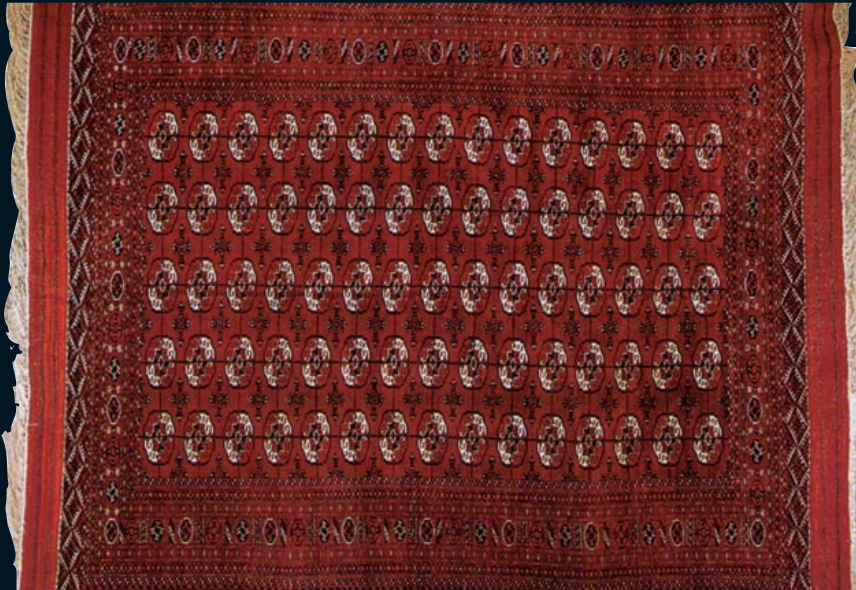
TEKKE Boukhara Russe royal début XX siècle