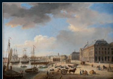
J-P ALAUX attribué à Vue de la Place de la Bourse et du Pont de Pierre. 31,5 x 46,5 cm