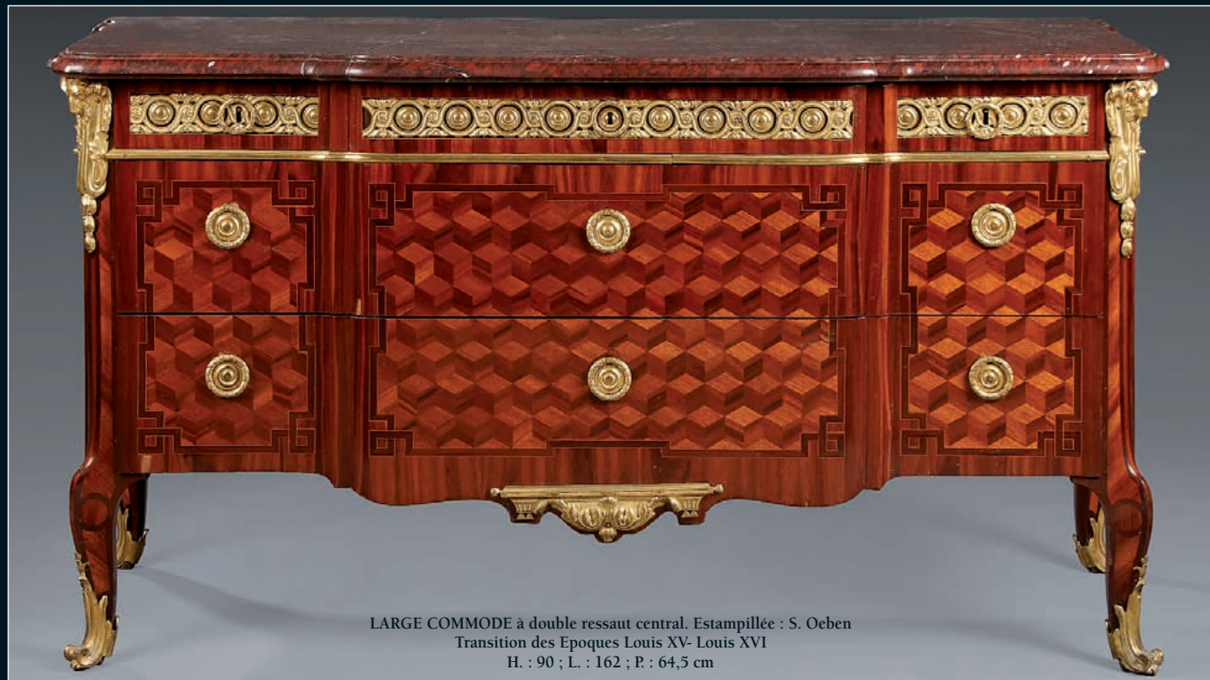
LARGE COMMODE à double ressaut central. Estampillée : S. Oeben Transition des Epoques Louis XV- Louis XVI H. : 90 ; L. : 162 ; P. : 64,5 cm

CATALOGUE EN LIGNE www.gazette-drouot.com www.auction.fr