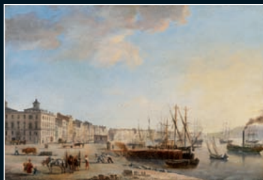
J-P ALAUX attribué à Vue du quai des Chartrons à Bordeaux 31 x 45,5 cm

Sur ordonnance du juge des tutelles : Collection de Mme J. Terrasson