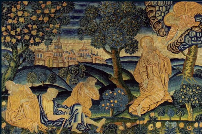
Tapissérie au petit point France Vers 1680 - 1720 H. 2,15 - 3,4 m

LISTE SUR DEMANDE À L'ÉTUDE LISTE VISIBLE SUR www.auction.fr