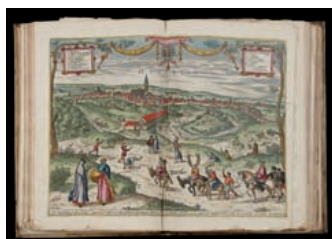
LIVRES - JOUETS mai