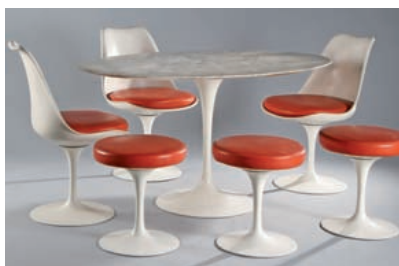
TABLEAUX MODERNES ARTS DÉCORATIFS DU XX e DESIGN Vendredi 13 mai - salle 4