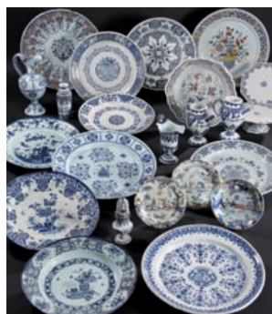
PORCELAINES - FAIENCES Lundi 11 avril - salle 9