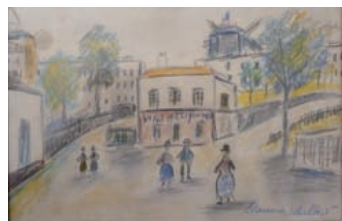
TABLEAUX MODERNES ET CONTEMPORAINS mai