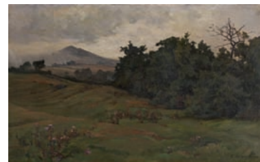
E. de MARTENNE , peintre du Morvan son matériel photographique, son atelier avril

Pour inclure vos objets dans une de ces vacations : Tél. 01.47.70.50.90 – Fax. 01.48.01.04.45 – pescheteau-badin@wanadoo.fr