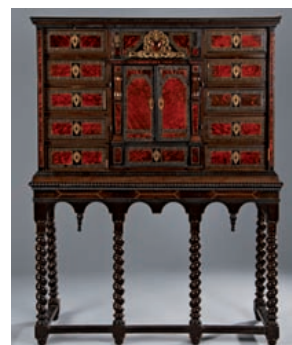
DESSINS, TABLEAUX ANCIENS OBJETS D'ART - MOBILIER Vendredi 6 mai - salle 4