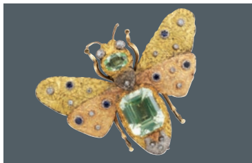
BIJOUX - OBJETS de VITRINE ORFÈVRERIE Jeudi 26 mai - salle 8