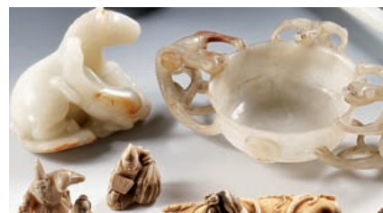
ARTS ASIATIQUES Juin