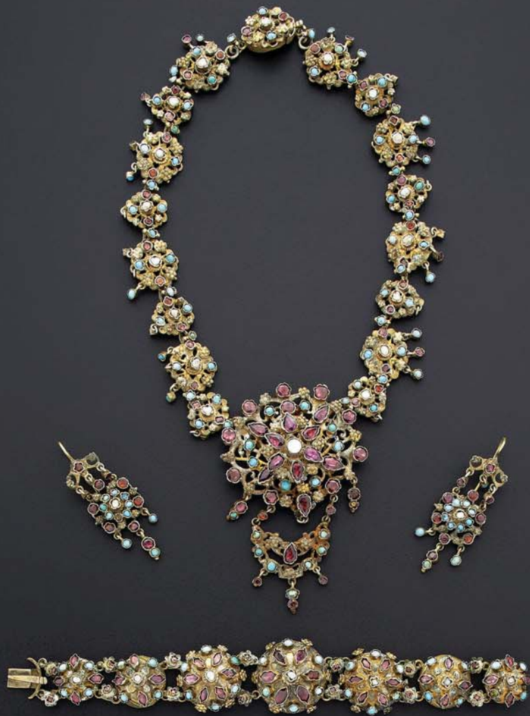
153 Parure en argent et vermeil à décor de rosaces serties de turquoises cabochons, grenats sous clinquants, certains en pampille. Elle comprend : un collier draperie, un bracelet et une paire de boucles d'oreille [systèmes pour oreilles percées]. Travail étranger du XIXème siècle, probablement austro-hongrois. Hauteur des boucles d'oreilles : 50 mm Longueur du bracelet : 17 cm Longueur du collier : 25. 5 cm Poids brut total : 136 g