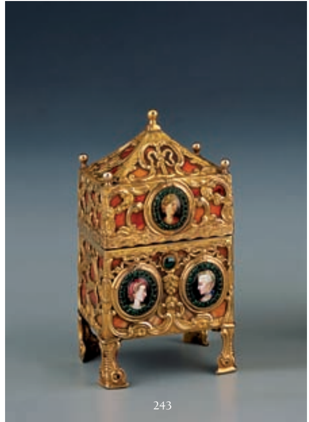
243 PRECIEUX NECESSAIRE A PARFUMS rectangulaire, monté en or ajouré ciselé d'animaux et personnages sur fond de cornaline. Il pose sur quatre pieds et présente sur le devant, trois médaillons à profil de femme polychromes entourés de verre vert taillé. Il contient différents éléments dont deux flacons, montés en argent, métal et or. Travail réalisé vers 1770, probablement anglais, dans le goût de James COX. (Très petits accidents). Hauteur : 11 cm. 5.000/6.000 € Voir reproduction ci-dessus