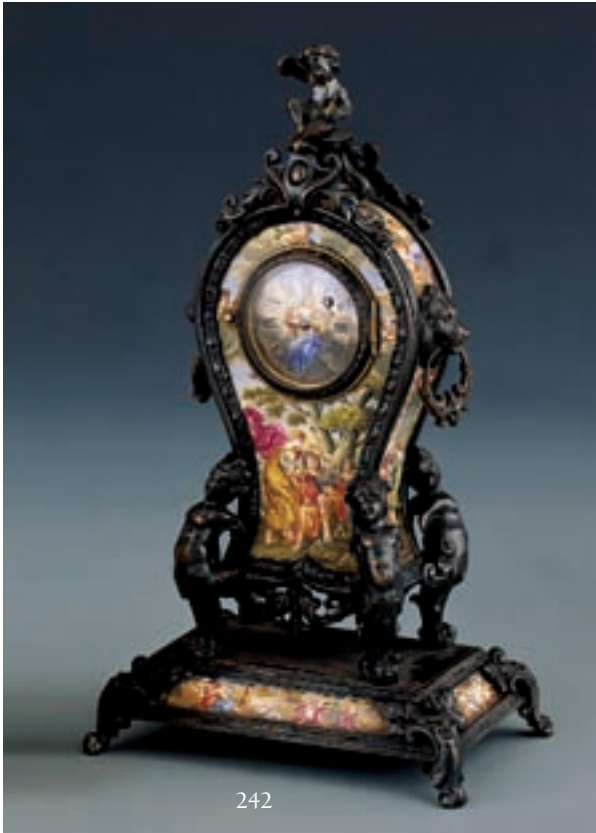
242 PETIT CARTEL en argent ciselé appliqué d'émaux polychromes à décor de personnages dans le style Antique. Travail réalisé vers 1865, probablement Austro-Hongrois. Hauteur : 18,5 cm. Poids brut : 483 gr. 700/1.000 € Voir reproduction ci-dessus