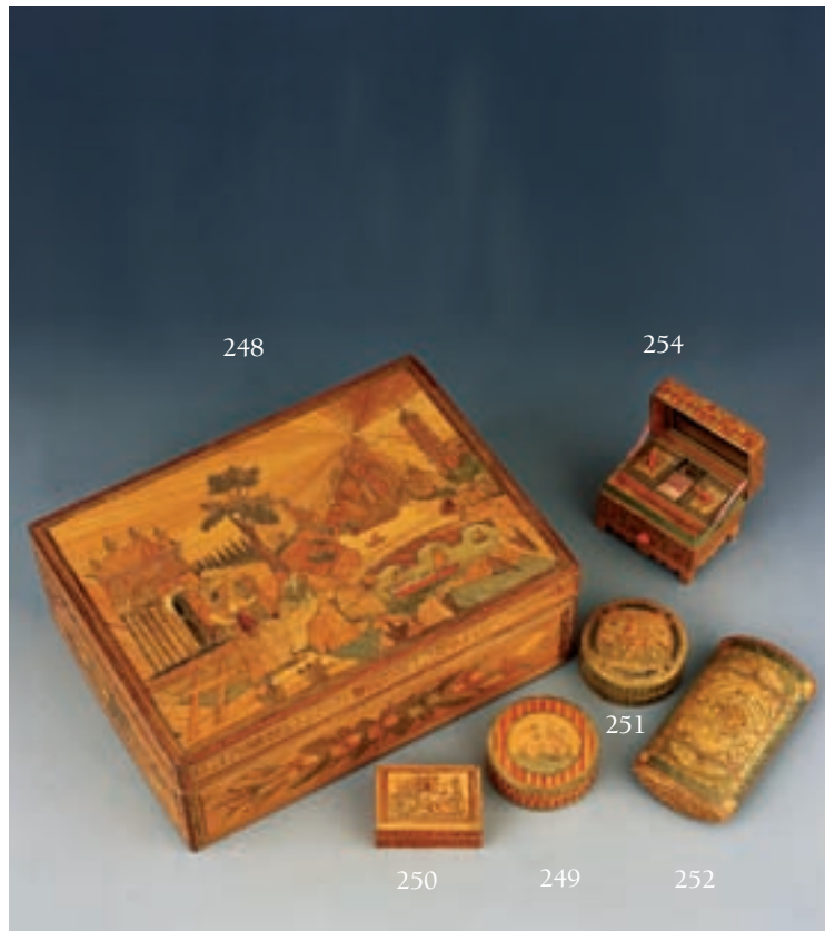
248 COFFRET À COUTURE rectangulaire en marqueterie de paille, décor sur le couvercle de bouquet et d'architecture sur les cotés. L'intérieur dévoile quatre compartiments ornés sur leur couvercle de fleurs et de maisons, vers 1800.

L : 28, l : 22, h : 9 cm (accidents) 100/150 € Voir reproduction ci-dessus