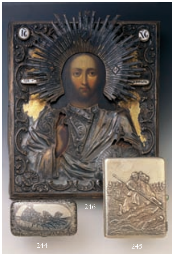
244 TABATIERE rectangulaire en argent niellé, chiffrée C.D., le couvercle décoré d'une troïka.

MOSCOU, 1888. Poids : 118 gr. 150/250 € Voir reproduction ci-dessus