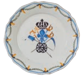
31 NEVERS. Assiette à bord contourné à rare décor patriotique polychrome dit "au tiers roulant" représentant une large fleur de lys au centre surmontée de la couronne royale, encadrée de la représentation de la réunion des Trois Ordres, la représentation est doublée pour la noblesse et le clergé avec deux épées, une croix papale et une crosse d'évêque, et triplée pour le Tiers Etat avec trois outils agraires : faux et bêche surmontant les deux roues d'une charrue. Fin du XVIIIème siècle, époque révolutionnaire. D : 23 cm 500/600 € Infimes égrenures.

La double représentation du Tiers Etat était une demande expresse faite au roi qui finira par l'accepter à contre coeur. Seul modèle connu ou un chapeau de paysan remplace les fleurs de lys.