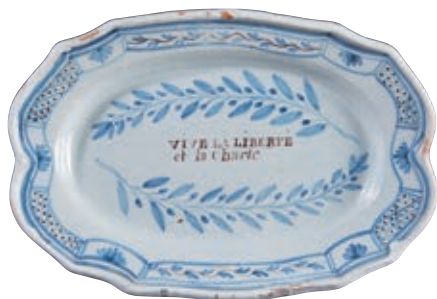
77 PARIS OU FORGES LES EAUX. Plat ovale à bord contourné dit "cul noir" à décor patriotique en bleu de branches d'olivier encadrant l'inscription en manganèse "VIVE LA LIBERTE et la Charte". Quadrillages alternés de fleurs sur l'aile. Fin du XVIII ème siècle, époque révolutionnaire. L : 35,5 cm 300/400 € Deux égrenures.

Bibliographie C. BONNET, Faïences révolutionnaires. Collection Louis HEITSCHTEL, p.207 n°452.