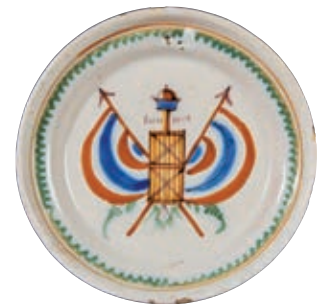
128 ROANNE. Assiette à bord circulaire à décor patriotique polychrome au centre d'un faisceau de licteur surmonté d'une pique avec un bonnet phrygien et d'une inscription "l'union", encadré de deux drapeaux tricolores évoquant la cocarde. Fin du XVIIIème siècle, époque révolutionnaire. D : 22 cm 400/600 € Un cheveu et trois égrenures.

Bibliographie C. BONNET, Faïences révolutionnaires. Collection Louis HEITSCHHEL, p.197 n°414.