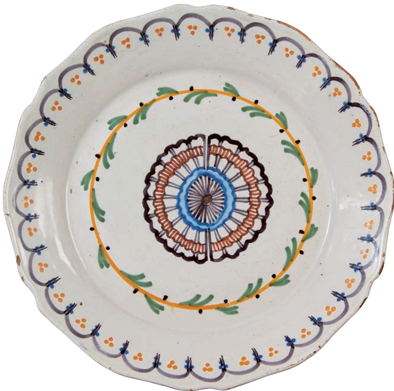
153 NEVERS. Assiette à bord contourné à décor patriotique polychrome "à la cocarde tricolore" dans un encadrement de guirlandes de fleurs. Sur l'aile, arceaux bleu et groupe de trois points jaune.

Fin du XVIIIème siècle, époque révolutionnaire.