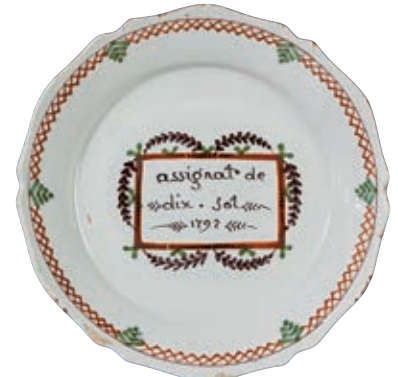
107 NEVERS. Assiette à bord contourné à décor patriotique polychrome d'une vignette portant l'inscription "assignat de dix sol 1792" dans un encadrement de guirlande de fleurs. Quadrillages et fougères en bordure.

Fin du XVIIIème siècle, époque révolutionnaire.