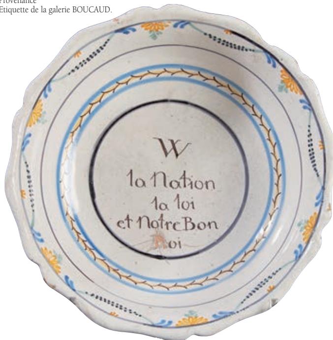
46 NEVERS. Jatte à bord contourné à décor polychrome dans un médaillon central de l'inscription en manganèse "W la nation la loi et notre Bon Roi". Le R de "Roi" est effacé. Fin du XVIIIème siècle, époque révolutionnaire. D : 30 cm 2 000/2 500 € Trois éclats au revers.

Exceptionnelle inscription que l'on peut dater entre 1789/1791, reprenant le serment civique et qui a été mutilée (grattage de la lettre R de Roy).