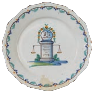
121 NEVERS. Assiette à bord contourné à décor patriotique polychrome de l'inscription " la loi et la justice" dans un médaillon fleuri posé sur une stèle gravée de pointillés évoquant des inscriptions et de la date 1793. Derrière apparaissent de chaque côté, les plateaux vides d'une balance. Fin du XVIIIème siècle, époque révolutionnaire. D : 22,5 cm 1 000/1 200 € Quelques égrenures.

Pièce rare car portant la date de 1793, ce décor habituellement est daté 1791 ou 1792.