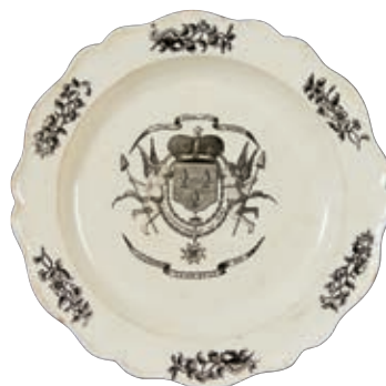
52 ANGLETERRE. LEEDS. Assiette en faïence fine à bord contourné à décor patriotique imprimé en noir représentant le blason fleurdelisé surmonté de la couronne royale, encadré de l'Ordre du Saint Esprit, et une inscription "LA CONSTITUTION OU LA MORT" entourée de deux anges portant une pique avec un bonnet phrygien. Deux inscriptions à la base et au sommet "LA NATION LA LOI ET LE ROY" " VIVRE LIBRE OU MOURIR" Fin du XVIIIème siècle, début de l'époque révolutionnaire. D : 25,5 cm 200/300 €

Modèles similaires Musée de Moustiers : un plat long ovale. Musée Leblanc-Duvernoy à Auxerre (ancienne collection Garnier) : un corps de soupière.