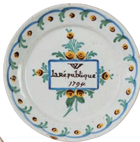
168 NEVERS. Assiette de forme calotte à décor patriotique polychrome de l'inscription "W la République 1794" dans une vignette rectangulaire sur fond de fleurs. Guirlandes fleuries sur l'aile. Fin du XVIIIème siècle, époque révolutionnaire. D : 21 cm 1 000/1 200 € Une égrenure.

Bibliographie C. BONNET, Faiences révolutionnaires. Collection Louis HEITSCHTEL, p.163 n°307, un saladier.