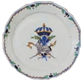
29 NEVERS. Assiette à bord contourné à décor patriotique polychrome représentant les symboles des Trois Ordres, d'un agneau couché sur des épis de blé, surmonté d'une fleur de lys et de la couronne royale et encadré d'une crosse et d'une épée. Fin du XVIIIème siècle, époque révolutionnaire. D : 22,5 cm 300/400 € L'agneau est un symbole du Tiers Etat, il symbolise l'élevage et l'agriculture comme le confirme la présence d'épis de blé à la base de notre pièce.

Bibliographie C. BONNET, Faiences révolutionnaires. Collection Louis HEITSCHHEL, p.78 n°37.