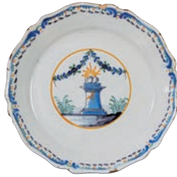
223 NEVERS. Assiette à bord contourné à décor polychrome d'une stèle surmontée de deux coeurs flammés, sommée de guirlandes de fleurs et feuillages. Fin du XVIIIème siècle. D : 23 cm 200/300 € Eclats en bordure. La stèle ou autel de la patrie, évoque probablement de mariage civil