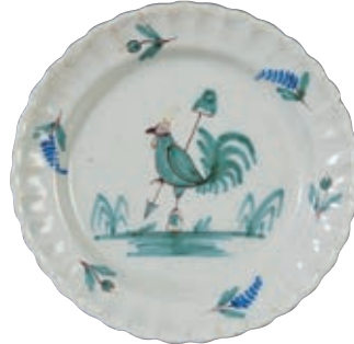
144 SUD OUEST. Assiette godronnée sur l'aile, à décor patriotique polychrome d'un coq perché sur une pierre tenant dans sa patte droite une pique sommée d'un bonnet phrygien. Fin du XVIIIème siècle, époque révolutionnaire. D : 24 cm 300/400 € Égrenure en bordure.

Très rares sont les décors patriotiques sur les faïences de cette région et ils représentent presque toujours un coq.