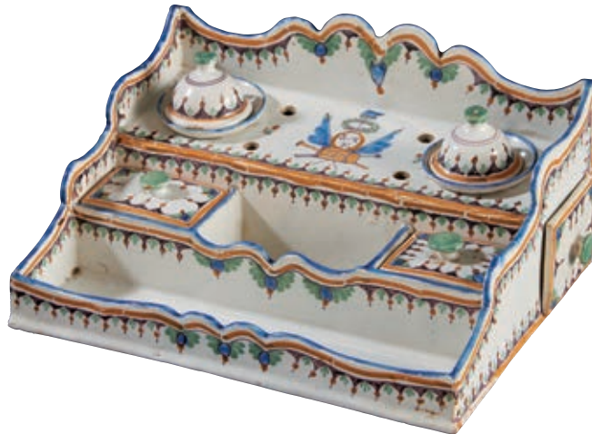
173 ROANNE. Ecritoire rectangulaire à dossier contourné, un grand tiroir de rangement sur le côté, un plateau à deux compartiments couverts, un plateau porte deux godets à encre couverts avec au centre décor polychrome d'un tambour et de fibres surmontés de deux drapeaux entourant un médaillon ovale portant les initiales "R.Q.F" surmonté d'une pique sommée d'un bonnet phrygien entouré d'une guirlande de lauriers. Fin du XVIIIème siècle, période révolutionnaire L : 22 cm - P : 18 cm Restaurations anciennes.

Modèle de commande, pièce unique exceptionnelle.