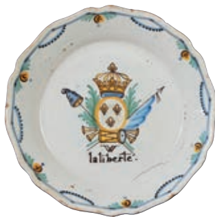
75 NEVERS. Assiette à bord contourné à décor patriotique polychrome d'un médaillon ovale à trois fleurs de lys surmonté de la couronne royale, encadré d'instruments de musique, d'un drapeau d'un côté, et d'une pique surmontée d'un bonnet phrygien de l'autre côté, surmontant l'inscription "W la liberté". Fin du XVIII ème siècle, époque révolutionnaire. D : 23 cm 300/400 € Ce décor est totalement inspiré du décor "aux drapeaux" prérévolutionnaire auquel on a ajouté un bonnet phrygien et le vivat de la liberté.

Il est rare de trouver un bonnet phrygien au bout d'une pique pour symboliser le Tiers Etat dans la représentation de la réunion des Trois Ordres.