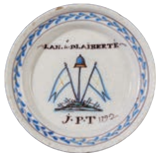
80 ROANNE. Assiette de forme calotte à décor patriotique polychrome de deux drapeaux de chaque côté d'une pique sommée d'un bonnet phrygien sur une terrasse et d'une inscription "LAN 4e DLAIBERTE" en haut, et en bas "J.P.T 1792". Fin du XVIII ème siècle, époque révolutionnaire. D : 22,5 cm 1 000/1 200 € Petite craquelure circulaire dans le fond, quelques égrenures. Pièce unique de commande.