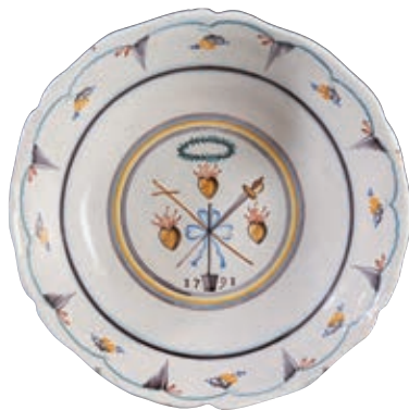
24 NEVERS. Jatte à bord contourné à décor patriotique polychrome dans un large médaillon central de trois coeurs ardents aux flammes jaunes disposés en triangle pointe en haut, encadrant les Trois Ordres réunis par un ruban (épée, croix et bêche médiane, fer en bas), portant la date 1791 surmontés d'une couronne de lauriers. Fleurs et chutes en bordure. Fin du XVIIIème siècle, époque révolutionnaire. D : 31,5 cm 2 000/2 500 € Les trois coeurs flammés signifient sans ambiguïté que les Trois Ordres sont encore réunis autour de la monarchie en 1791.

Bibliographie C. BONNET, Faiences révolutionnaires. Collection Louis HEITSCHHEL, p.121 n°174. J GARNIER, Les faiences patriotiques, N°IX FIG 293 p.117.