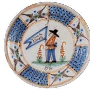
76 ROANNE. Assiette de forme calotte, à décor patriotique polychrome d'un marinier de Loire debout sur une terrasse entourée de fougères, tenant un drapeau sur lequel est inscrit "vive la liberté" et sous la terrasse la date 1791. Sur l'aile fougères alternées d'écaillés. Fin du XVIII ème siècle, époque révolutionnaire. D : 21 cm 400/600 €

Bibliographie C. BONNET, Faïences révolutionnaires. Collection Louis HEITSCHTEL, p.114 n°146.