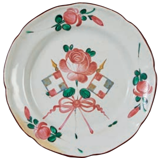
184 LES ISLETTES. Assiette à bord contourné à décor patriotique polychrome de petit feu d'une rose entourée de deux drapeaux tricolores noués par un ruban. Trois fleurettes sur l'aile. Fin du XVIIIème siècle, époque révolutionnaire. D : 22 cm Deux éclats restaurés en bordure.