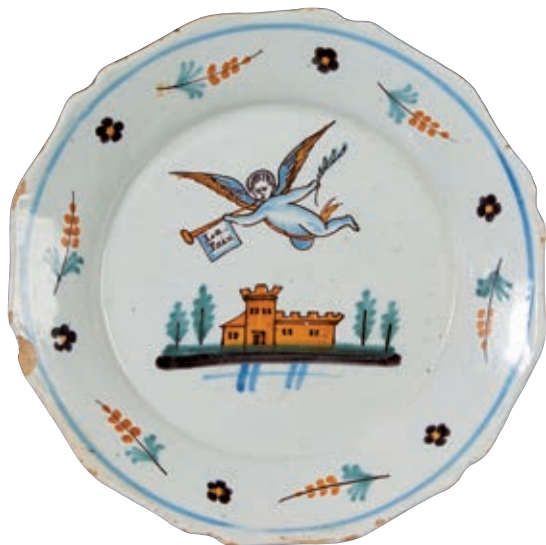
204 NEVERS. Assiette à bord contourné à décor patriotique polychrome d'une renommée tenant un rameau, (symbole de la paix), et soufflant dans une trompe portant l'inscription "La paix" survolant une forteresse flanquée de quatre pins. Fin du XVIIIème siècle, époque révolutionnaire. D : 22,7 cm 200/300 € Eclats en bordure.