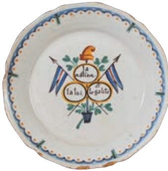
124 NEVERS. Assiette à bord contourné à décor patriotique polychrome de trois réserves ovales portant les inscriptions "la nation" "la loi" "et égalité" entourées de drapeaux tricolores, d'une bêche tête en bas sommée d'un bonnet phrygien. Fin du XVIIIème siècle, époque révolutionnaire. D : 22,5 cm 200/300 € Eclats en bordure .

Bibliographie C. BONNET, Faïences révolutionnaires. Collection Louis HEITSCHHEL, p. 81 n°51.