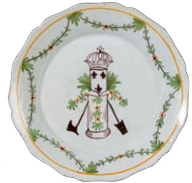
227 NEVERS (GENRE DE). Assiette à bord contourné à décor polychrome d'une colonne soutenant un blason à trois fleurs de lys surmonté de la couronne royale encadré d'une bêche et d'une hache. Fin du XIXème siècle. D : 23 cm 100/150 €