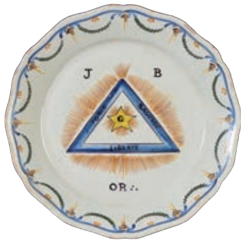
225 NEVERS (GENRE DE). Assiette à bord contourné à décor polychrome maçonnique représentant le Delta rayonnant portant l'initiale G dans un triangle. Les côtés du triangle portent les inscriptions "force sagesse liberté". Autour, les initiales J et B et OR avec trois points en triangle. Guirlandes de fleurs sur l'aile. Fin du XIXème siècle. D : 23 cm 100/150 €