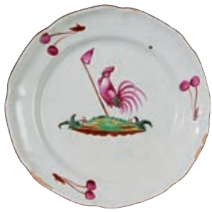
140 SAINT CLEMENT. Assiette à bord contourné à décor patriotique polychrome en petit feu d'un coq perché sur un tertre tenant une pique surmontée d'un bonnet phrygien. Trois groupes de deux cerises sur l'aile. Fin du XVIIIème siècle, époque révolutionnaire. D : 22,5 cm 300/400 € Égrenures.

Dans ce modèle, le bonnet phrygien est terminé par un pompon alors qu'il l'est habituellement avec des rubans tricolores.