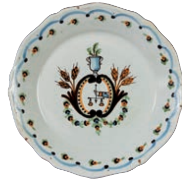
125 NEVERS. Assiette à bord contourné à décor patriotique polychrome d'un bras tendu tenant une balance dans une réserve rocaille encadrée de guirlandes de fleurs, surmontée d'un vase Médicis et encadré de six épis de blé. Fin du XVIIIème siècle, époque révolutionnaire. D : 22,5 cm 200/300 €

Bibliographie C. BONNET, Faïences révolutionnaires. Collection Louis HEITSCHHEL, p.134 n°225.