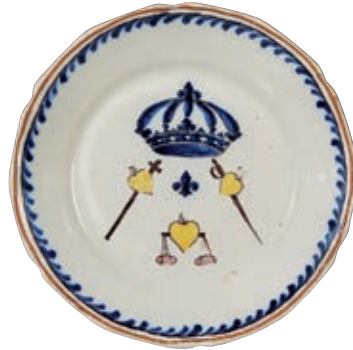
226 NEVERS (GENRE DE). Assiette à bord contourné à décor patriotique polychrome représentant une fleur de lys entourée de trois coeurs flammés portant chacun une croix, une épée et une balance, surmontés de la couronne royale. Fin du XIXème siècle. D : 22,5 cm 100/150 € Fêlure circulaire.