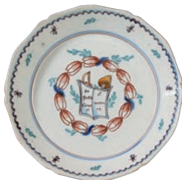
49 NEVERS. Assiette à bord contourné à décor patriotique polychrome d'un livre ouvert portant l'inscription "sagesse force et union 1792" posé sur une épée et un bonnet phrygien, dans un encadrement de fleurs bleu blanc rouge. Papillons et feuillages sur l'aile. Fin du XVIIIème siècle, époque révolutionnaire. D : 23 cm 600/800 €

Bibliographie C. BONNET, Faïences révolutionnaires. Collection Louis HEITSCHHEL, p.131 n°213.