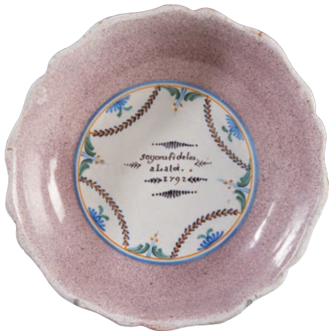
44 NEVERS (Manufacture de Bethléem). Grande jatte à bord contourné à fond moucheté manganèse décoré dans une réserve centrale entourée de filets tricolores d'une inscription en manganèse "soyons fideles a La loi. 1792". Fin du XVIIIème siècle, époque révolutionnaire. D : 34 cm 1 000/1 200 € Eclat à l'arrière.

Cette pièce de commande à décor moucheté et manganèse est attribuée à la manufacture de Bethléem dirigée par Seuzier en raison d'un gobelet à son nom conservé au musée de Nevers. Provenance Etiquette de la galerie BOUCAUD.