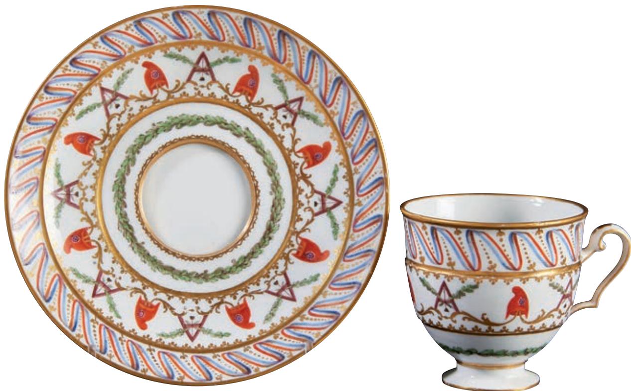
215 SEVRES. Tasse et sa sous-tasse en porcelaine dure à décor polychrome et or patriotique d'une frise de rubans tricolores ondulants ponctués de fleurettes or, guirlande de bonnets phrygiens alternés d'équerres maçonniques, et guirlandes de feuilles de chêne. Marquées Sevres RF en lettres entrelacées, vers 1794, marque du peintre IN cp (indéterminée). Fin du XVIIIème siècle, époque révolutionnaire. H de la tasse : 7,5 cm - D de la sous-tasse : 14,8 cm