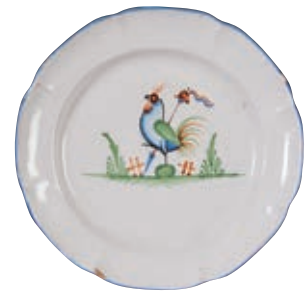
142 WALY. Assiette à bord contourné à décor patriotique polychrome d'un coq debout sur une terrasse tenant une pique sommée d'un bonnet phrygien et de rubans tricolores. Fin du XVIIIème siècle, époque révolutionnaire. D : 22 cm 300/400 € Égrenure.

Le décor "au coq" fréquent dans l'Est est plus rare sur des pièces de forme, il est traité en qualité fine. Le coq, figure emblématique, a une symbolique forte car il exalte le courage, et est en même temps protecteur, il veille comme le coq sur le clocher d'une église mais il appelle aussi à la vigilance.