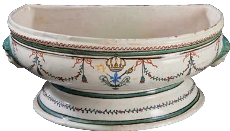
64 PARIS ET NEVERS. Corps de fontaine murale couverte de forme balustre sommé de deux dauphins affrontés encadrant une coquille, décor polychrome d'une divinité allégorique symbolisant la déesse de la justice auréolée d'étoiles tenant dans sa main gauche un glaive et dans l'autre main la balance dont les plateaux en équilibre supportent l'un, les ordres privilégiés représentés par un rosaire et une décoration militaire, l'autre, deux symboles du Tiers Etat, couvercle décoré d'un coq perché sur des rinceaux. H : 49 cm Bassin à deux anses en forme de têtes de femmes en léger relief, à décor polychrome des Trois Ordres réunis par une fleur de lys surmontée d'une couronne royale, et dans une banderole l'inscription "L'union Fait La Force" encadrée de guirlandes de fleurs. Décor identique "aux Trois Ordres" à l'intérieur. H : 18 cm - L : 42 cm 3 000/4 000 € Restaurations anciennes.