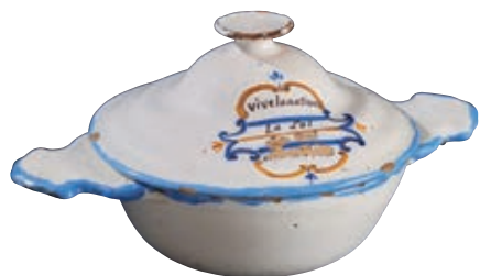
51 MOUSTIERS. Ecuelle à anses aplaties, le couvercle à décor patriotique en bleu, ocre et manganèse d'une inscription dans une réserve fleurie "vive la nation, La Loi", le mot roy effacé ainsi qu'un long mot en dessous. Fin du XVIIIème siècle, période révolutionnaire. L : 26 cm 1 000/1 200 € Egrenures.

Modèle similaire Musée de Roanne, ancienne collection Louis HEITSCHHEL.