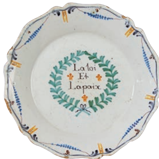
203 NEVERS. Assiette à bord contourné à décor patriotique polychrome de l'inscription "La loi Et La paix" entourée de trois fleurs de lys entre deux branches noués par un ruban. Guirlande et chutes sur l'ail. Fin du XVIIIème siècle, époque révolutionnaire. D : 22,5 cm 500/600 € Quelques égrenures.

Musée Carnavalet, un saladier avec le même décor mais portant l'inscription " Paix et liberté 1793" ce qui permet de dater celle-ci de 1793.