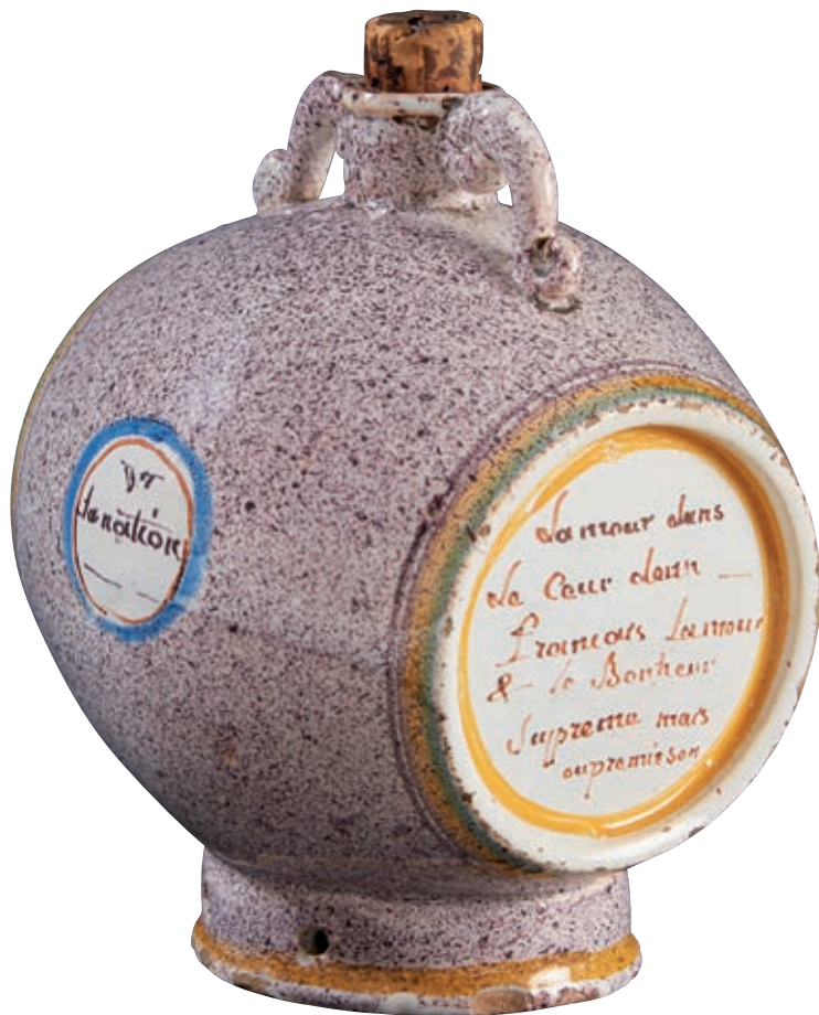
199 NEVERS. Tonnelet à alcool à fond moucheté manganèse, les côtés cernés de filets tricolores portent les inscriptions "W la nation" "W la loi". Exceptionnelles inscriptions sur les deux fonds du tonneau : "Vivent Les Braves Montagnards. Bis. Ces soutiens de la République" et "Lamour dans Le Cœur deun français Lamour & le Bonheur Supprema mais au premier son." Fin du XVIIIème siècle, époque révolutionnaire. H : 18 cm 3 000/4 000 € Quelques égrenures.

Les montagnards étaient des sans-culottes et leur devise au moins jusqu'au 5 thermidor était "W la Montagne". Même si le mouvement était parisien, Nevers avait sûrement aussi ses ouvriers et artisans sans-culotte. Il s'agit là, compte tenu de la formule virulente, d'une commande d'un sans culotte convaincu !