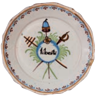
74 NEVERS. Assiette à bord contourné à décor polychrome patriotique dans un médaillon central feuillagé de l'inscription "Liberté" encadrée d'une épée, une croix papale et une pique sommée d'un bonnet phrygien. Fin du XVIII ème siècle, époque révolutionnaire. D. 22,5 cm 400/500 € Eclat restauré sur l'aile.

Il est rare de trouver un bonnet phrygien au bout d'une pique pour symboliser le Tiers Etat dans la représentation de la réunion des Trois Ordres.