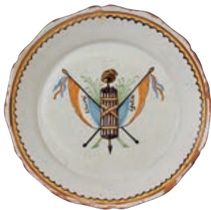
126 NEVERS. Assiette à bord contourné à décor patriotique polychrome d'un faisceau de licteur surmonté d'un bonnet phrygien, encadré de deux drapeaux tricolores portant les inscriptions "liberté, égalité". Fin du XVIIIème siècle, époque révolutionnaire. D : 22 cm 300/400 € Eclats. L'esprit républicain est très clair dans la représentation du faisceau de licteur et du bonnet phrygien ainsi que dans la devise "liberté égalité".

Modèle similaire Musée National de la céramique à ROUEN (inv. 2167).