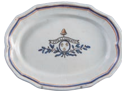
79 PARIS OLLIVIER. Plat ovale à bord contourné dit "cul noir" à décor patriotique polychrome de trois fleurs de lys dans un médaillon surmonté d'une banderole portant l'inscription "VIVE LA LIBERTE" et d'un bonnet phrygien au bout d'une pique. Branchages à la base. Filets bleu blanc rouge en bordure. Fin du XVIII ème siècle, époque révolutionnaire. L : 30,5 cm 500/600 €