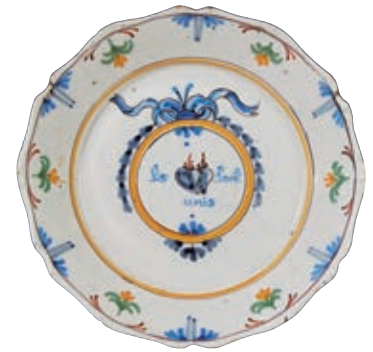
224 NEVERS. Assiette à bord contourné à décor polychrome de deux coeurs flammés portant l'inscription "ils sont unis" dans un médaillon surmonté d'un ruban bleu noué. Fleurs et rinceaux en bordure. Fin du XVIIIème siècle. D : 23,5 cm 300/400 €