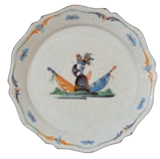
145 NEVERS. Assiette à bord contourné à décor patriotique polychrome d'un heaume surmonté d'une hache sur laquelle est perché un coq, encadré d'un drapeau bleu et d'un drapeau orange. Papillons sur l'aile. Fin du XVIIIème siècle, époque révolutionnaire. D : 23 cm 300/400 € Très légère fêlure.

Bibliographie C. BONNET, Faïences révolutionnaires. Collection Louis HEITSCHÉL, p.173 n°336.