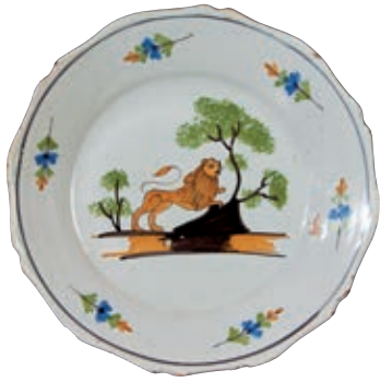
222 NEVERS. Assiette à bord contourné à décor polychrome d'un lion appuyé sur un tertre avec arbres traités à l'éponge. Tiges fleuries sur l'aile. Fin du XVIIIème siècle. D : 23 cm 100/150 € Le lion est un symbole du pouvoir.