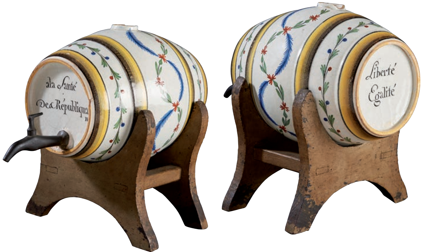
172 NORD. Grand tonnelet à anneaux en léger relief en jaune et manganèse alternés de guirlandes de fleurs polychromes, portant les inscriptions sur les fonds : "à la Santé De la République" et "Liberté égalité". Fin du XVIIIème siècle, époque révolutionnaire. Le tonnelet repose sur un socle en bois peint, robinet en étain patiné. L : 29 cm - L avec robinet : 39 cm Quelques éclats.