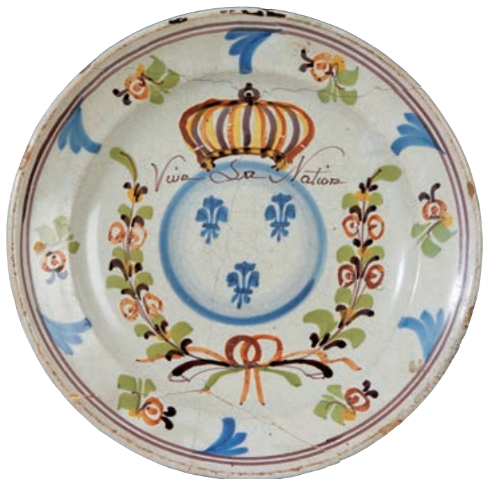
91 DESVRES. Plat rond à décor patriotique polychrome aux Armes de France et portant l'inscription en lettres cursives à l'anglaise "vive la Nation". D : 31 cm 100/200 € Cassé recollé.

Modèle similaire Musée National de la céramique à ROUEN (inv.2744).