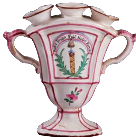
63 LES ISLETTES. Bouquetière d'applique à piedouche à trois tubulures et deux anses formées de rinceaux, à décor polychrome patriotique un petit feu d'un faisceau de licteur surmonté d'un bonnet phrygien, entre deux palmes, et d'une banderole tricolore portant l'inscription "notre union fait notre Force". Fin du XVIIIème siècle, période révolutionnaire. H : 14,5 cm 500/700 € Eclats et morceaux recollés au piedouche.

Cette rare pièce de forme présente une inscription unique.