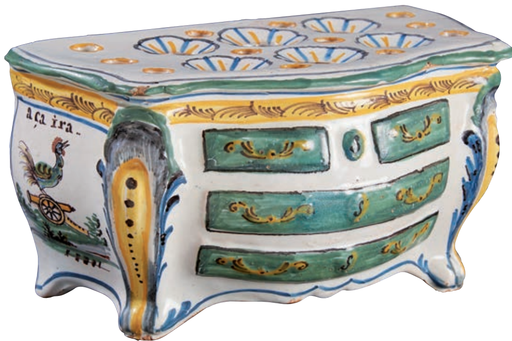
182 NEVERS. Exceptionnelle bouquetière en forme de commode de style Louis XV reposant sur quatre petits pieds, à rare décor patriotique polychrome présentant sur un côté l'arbre de la liberté sommé d'un bonnet phrygien au milieu d'un village avec deux personnages tenant des piques portant l'inscription "W la liberté"; sur l'autre, un coq perché sur un canon chantant "a ça ira", au revers "Mrs Jourdon et Durete. Nevers le 20 aoust 1792. L'an 4 me de Liberté". En façade quatre tiroirs, les poignées et entrées de serrure en trompe l'oeil, plateau à six orifices. Fin du XVIII ème siècle, époque révolutionnaire. L : 24 cm H : 13 cm Deux éclats au revers.