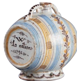
53 NEVERS. Tonnelet à alcool à double passant reposant sur un petit piédoche, à décor polychrome de cerclages alternés de guirlandes de fleurs et sur les fonds, les inscriptions : "W le Roy" (R Meulé) et "W la nation 1791". Fin du XVIIIème siècle, époque révolutionnaire. L : 12 cm 1 000/1 200 € Deux égrenures au col.

Bibliographie C. BONNET, Faïences révolutionnaires. Collection Louis HEITSCHHEL, p.213 n°470.