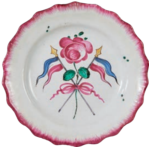
183 LES ISLETTES. Assiette à bord contourné à décor patriotique polychrome de petit feu, d'une rose entourée de deux drapeaux bleu blanc rouge, noués par un ruban. Peignés rose en bordure. Fin du XVIIIème siècle, époque révolutionnaire. D : 22,5 cm