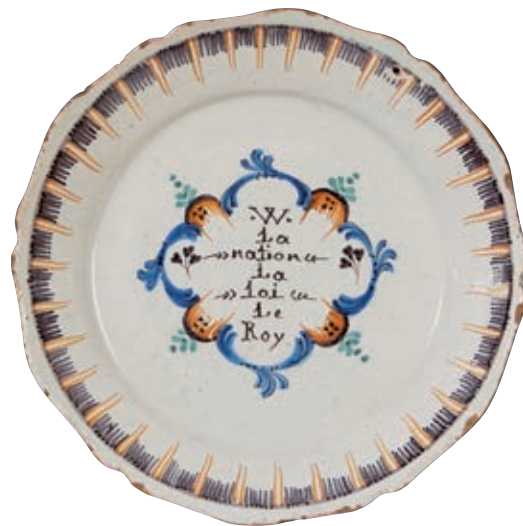
45 NEVERS. Assiette à bord contourné à décor patriotique polychrome d'une inscription dans un médaillon formé de rinceaux fleuris "W La nation la loi et le Roy". Peignés sur l'aile. Fin du XVIIIème siècle, époque révolutionnaire. Egrenures. D : 23 cm. 500/600 €

Cette pièce de commande à décor moucheté et manganèse est attribuée à la manufacture de Bethléem dirigée par Seuzier en raison d'un gobelet à son nom conservé au musée de Nevers. Provenance Etiquette de la galerie BOUCAUD.