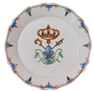
123 NEVERS. Assiette à bord contourné à décor patriotique polychrome des symboles de la réunion des Trois Ordres réunis par une large fleur de lys et sommés de la couronne royale, surmontant une banderole portant l'inscription "union, force". Fin du XVIIIème siècle, époque révolutionnaire. D : 23 cm 300/400 € Quelques égrenures.

Modèles similaires Musée Joseph DECHELETTE à ROANNE (collection Louis HEITSCHHEL) Musée de la céramique de ROUEN Musée municipal de NEVERS (inv NF 709)