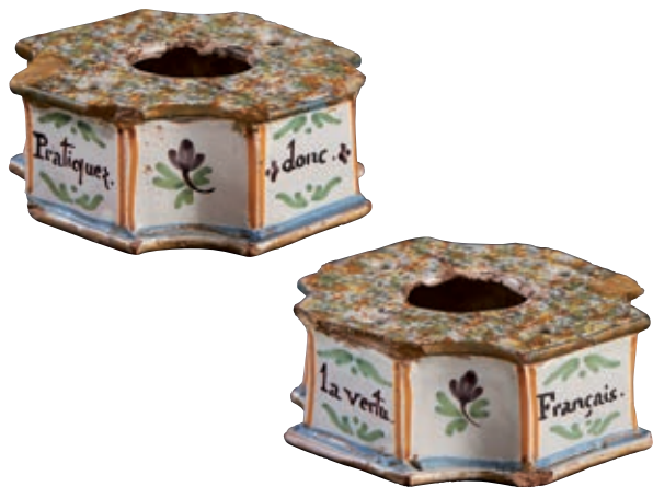
62 NEVERS. Encrier carré à angles incurvés, le plateau à décor à l'éponge est percé de quatre trous pique plume et d'un trou pour le godet. Les côtés portent les inscriptions "Français. Pratiquez. donc. La vertu." encadrées de fleurettes. Fin du XVIIIème siècle, époque révolutionnaire. Côté : 10,5 cm 1 000/1 200 € Eclats.

Cette rare pièce de forme présente une inscription unique.