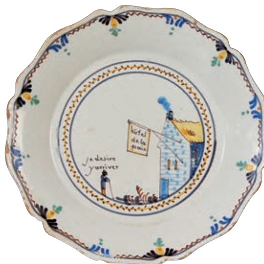
205 NEVERS. Assiette à bord contourné à décor patriotique polychrome dans un médaillon central d'une maisonnette avec une cheminée qui fume portant l'enseigne "hôtel de la paix" et en face un homme appuyé sur un bâton déclare dans une inscription : "je desire y arriver". Fleurs en chute sur l'ail. Fin du XVIIIème siècle, époque révolutionnaire. D : 22,8 cm 300/400 € Eclats en bordure.

Musée National de la céramique de ROUEN (Inv. 2195).