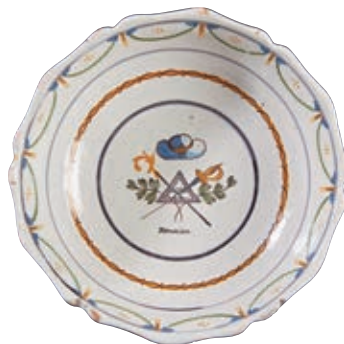
30 NEVERS. Jatte à bord contourné à décor patriotique polychrome représentant les symboles des Trois Ordres avec une herse et un chapeau de paysan pour le Tiers Etat, une crosse pour le Clergé et une épée pour la Noblesse, entre deux branchages, surmontant l'inscription "Reunion". Fin du XVIIIème siècle, époque révolutionnaire. D : 29,5 cm 1 500/2 000 €

Modèles similaires Musée de Nemours (inv.2020.33) Musée de Rouen (inv. 2250 et 2089)