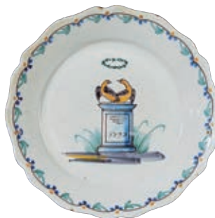
147 NEVERS. Assiette à bord contourné à décor de mariage républicain représentant l'autel de la patrie portant la date de 1793 et deux colombes se faisant face surmontées de la couronne de mariée. Fin du XVIIIème siècle, époque révolutionnaire. D : 23 cm 200/300 € Ce décor reprend le décor classique des assiettes "de mariage" fabriquées en grand nombre à Nevers, mais ici la date de 1793 et la présence de l'autel de la liberté indiquent bien qu'il s'agit d'un mariage républicain.

Modèle similaire Musée Joseph DECHELETTE à ROANNE (collection Louis HEITSCHÉL), inv.988.10.358.