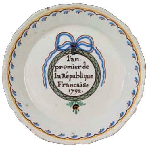
170 NEVERS. Assiette à bord contourné à décor patriotique polychrome dans un médaillon formé d'une guirlande de lauriers surmonté d'un large ruban tricolore noué présentant une inscription : "l'an premier de la République Française 1792." Fin du XVIIIème siècle, époque révolutionnaire. D : 22,5 cm 1 000/1 200 € Eclats restaurés sur l'aile.

Bibliographie C. BONNET, Faiences révolutionnaires. Collection Louis HEITSCHTEL, p.163 n°309.