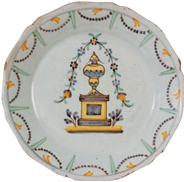
196 NEVERS. Assiette à bord contourné à décor patriotique polychrome dit "au tombeau de Mirabeau" représentant une urne funéraire. Fin du XVIIIème siècle, époque révolutionnaire. D : 23 cm Deux égrenures.