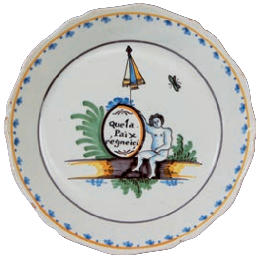
202 NEVERS. Assiette à bord contourné à décor patriotique polychrome représentant un amour assis sur un tertre tenant un médaillon portant l'inscription "que la Paix règne ici" surmonté d'un drapeau tricolore fermé. Fin du XVIIIème siècle, époque révolutionnaire. D : 23 cm 500/600 €