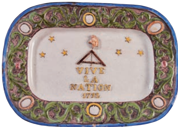
228 MALICORNE. Plat rectangulaire à angles arrondis à décor polychrome au centre d'un compas surmonté d'un bonnet phrygien, entouré de six étoiles et en dessous l'inscription "VIVE LA NATION 1792". Bordure à décor en relief de feuillages en enroulements alternés de six médaillons ovales. XIXe siècle. Long : 45 cm - Larg : 32 cm 100/120 €