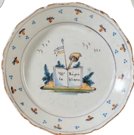
169 NEVERS. Assiette à bord contourné à décor patriotique polychrome d'un livre ouvert portant l'inscription "W la République" surmonté d'un bonnet phrygien et d'un drapeau tricolore dans un encadrement de branchages. Fin du XVIIIème siècle, époque révolutionnaire. D : 23 cm 1 000/1 200 € Egrenures en bordure.

Bibliographie C. BONNET, Faiences révolutionnaires. Collection Louis HEITSCHTEL, p.163 n°308.