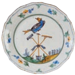
23 NEVERS. Assiette à bord contourné à décor patriotique polychrome des seuls symboles du Tiers Etat réunis par un ruban bleu, représentés par un râteau, une binette, et une bêche tête en bas avec un oiseau "symbole de liberté" posé sur le manche. Tiges fleuries sur l'aile. Fin du XVIIIème siècle, époque révolutionnaire. D : 23 cm 200/300 €

Bibliographie C. BONNET, Faiences révolutionnaires. Collection Louis HEITSCHHEL, p.121 n°174. J GARNIER, Les faiences patriotiques, N°IX FIG 293 p.117.