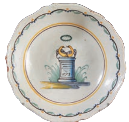
148 NEVERS. Petite jatte à bord contourné à décor polychrome d'un autel de la patrie portant la date 1793 sommée de deux colombes se faisant face surmontées d'une couronne de mariée dans un large médaillon central. Fin du XVIIIème siècle, époque révolutionnaire. D : 25 cm 300/400 € Restaurations.

Modèle similaire Musée Joseph DECHELETTE à ROANNE (collection Louis HEITSCHÉL), inv.988.10.358.