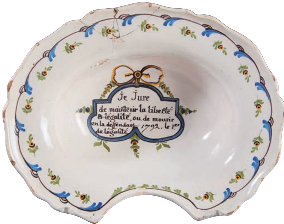
104 NEVERS. Plat à barbe à bord contourné à décor patriotique polychrome de l'exceptionnelle inscription "Je jure de maintenir la liberté et l'égalité ou de mourir en la défendant 1792. Le 1er de l'égalité" dans une réserve encadrée de feuillages surmontée d'un ruban jaune. Fleurettes et rinceaux en bordure. Fin du XVIIIème siècle, époque révolutionnaire.