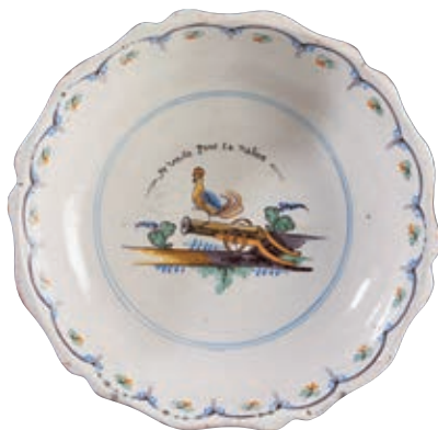
146 NEVERS. Jatte à bord contourné à décor patriotique polychrome dans un médaillon central d'un coq perché sur un canon posé sur une terrasse fleurie une patte levée, et au-dessus l'inscription "Je veille Pour la nation". Fin du XVIIIème siècle, époque révolutionnaire. D : 34,5 cm 1 000/1 200 €

Modèle similaire Musée national de la céramique à ROUEN (inv. 2220).