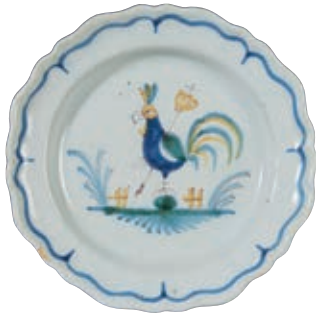
143 SUD OUEST. Assiette à bord contourné à décor patriotique polychrome d'un coq perché sur un tertre, tenant dans sa patte droite une pique surmontée d'une couronne et d'une croix. Fin du XVIIIème siècle, époque révolutionnaire. D : 24 cm 300/400 € Égrenure.

Très rares sont les décors patriotiques sur les faïences de cette région et ils représentent presque toujours un coq.