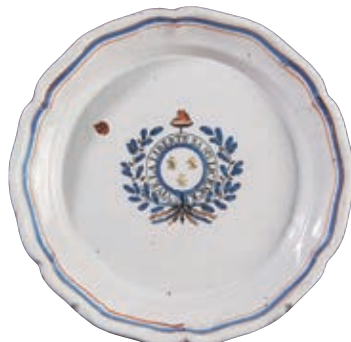
78 PARIS OLLIVIER. Plat rond dit "cul noir" à bord contourné à décor patriotique bleu et rouge sur fond blanc de trois fleurs de lys dans un médaillon central portant la devise "VIVE LA LIBERTE SANS LICENCE" entourée de deux branches de feuilles de chêne. Filets tricolores en bordure. Marqué en creux OLLIVIER A PARIS. Fin du XVIII ème siècle, époque révolutionnaire. D : 28 cm 500/600 €

Dans une allégorie de la Constitution de 1791, celle-ci est décrite comme tenant à sa main gauche la charte constitutionnelle et à sa main droite une pique surmontée d'un bonnet phrygien, la Constitution fait face au peuple et à la Garde Nationale.