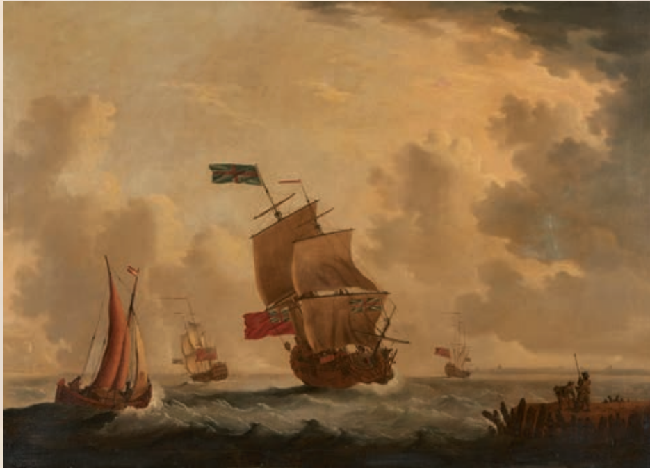
Francis SWAINE - Huile sur toile - 6 000 / 8 000 € Présentée à Drouot le 12 Novembre prochain par nos soins lors de la vente collégiale de tableaux anciens