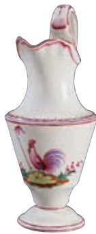
141 SAINT CLEMENT. Pichet en faïence fine de forme balustre sur piédouche, à décor patriotique polychrome en petit feu d'un coq sur une terrasse fleurie tenant une pique sommée d'un bonnet phrygien penché. Fin du XVIIIème siècle, époque révolutionnaire. H : 30 cm 1 200/1 500 € Restaurations anciennes au niveau de l'anse.

Bibliographie C. BONNET, Faïences révolutionnaires. Collection Louis HEITSCHÉL, p.196 n°405.