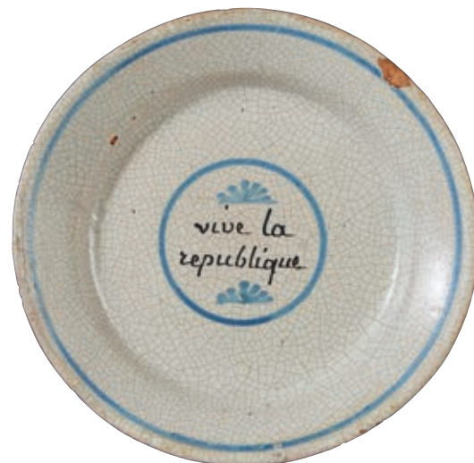
171 ANCY LE FRANC. Assiette à bordure circulaire, à décor patriotique polychrome dans un médaillon de l'inscription en manganèse "vive la république". Fin du XVIIIème siècle, époque révolutionnaire. D : 22,3 cm 200/300 € Email craquelé, un éclat en bordure.

Bibliographie C. BONNET, Faiences révolutionnaires. Collection Louis HEITSCHTEL, p.162 n°306