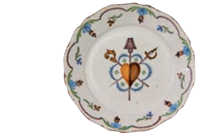
25 NEVERS. Assiette à bord contourné à décor patriotique polychrome représentant les symboles des Trois Ordres réunis par un large coeur sur fond de marguerites. Fin du XVIIIème siècle, époque révolutionnaire. D : 23 cm 200/300 € Quelques égrenures.

Bibliographie C. BONNET, Faiences révolutionnaires. Collection Louis HEITSCHHEL, p.87 n°73. J. GARNIER, Faiences patriotique, N°IX Fig. 180.