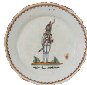
82 NEVERS. Assiette à bord contourné à décor patriotique polychrome d'un grenadier en faction armé à l'épaule debout sur une terrasse feuillagée surmontant l'inscription "W la nation". Fin du XVIII ème siècle, époque révolutionnaire. D : 23,5 cm 1 000/1 200 € Petits éclats en bordure.

Bibliographie C. BONNET, Faïences révolutionnaires. Collection Louis HEITSCHTEL, p.141 n°244 bis.