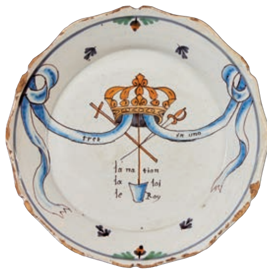
47 NEVERS. Assiette à bord contourné à décor patriotique polychrome d'une couronne royale et de rubans bleus portant l'inscription latine "tres in uno" surmontant les symboles de la réunion des Trois Ordres entourés de l'inscription "La Nation La Loi et Roy". Fin du XVIIIème siècle, époque révolutionnaire. D : 22,2 cm Eclats en bordure. 500/600 €

L'expression "notre bon Roy" démontre à l'évidence le respect et l'amour du peuple pour son Roi. Seul modèle connu.