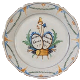
122 NEVERS. Assiette à bord contourné à décor patriotique polychrome d'un tambour, six boulets de canon, fûts de canon, surmontés de deux réserves ovales portant les inscriptions "union force" et "liberté patrie" et la date 1791, sommés du symbole du clergé et d'une double représentation du Tiers Etat avec une bêche et un pique sommée du bonnet phrygien. Fin du XVIIIème siècle, époque révolutionnaire. D : 23 cm 800/1 000 € Infimes usures en bordure.

Modèle similaire Musée national de la céramique de ROUEN, deux assiettes et un plat de barbier datés 1791 et 1792 (inv. 2145, 2144, 2304).