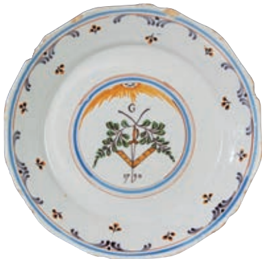
105 NEVERS. Assiette à bord contourné à décor patriotique polychrome maçonnique dans un médaillon entouré de filets tricolores, d'un soleil rayonnant entre deux rameaux croisés surmontés de la lettre G, équerre et poignard et la date 1790.

Pièce unique de commande reprenant le nouveau serment obligatoire dit "liberté-égalité" du 14 août 1792, que les prêtres constitutionnels et réfractaires vont devoir prêter "je jure d'être fidèle à la nation et de maintenir la liberté et l'égalité ou de mourir en les défendant".