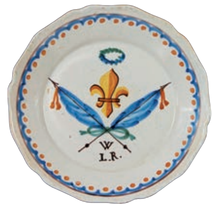
229 NEVERS. Assiette à bord contourné à décor polychrome monarchiste représentant une large fleur de lys sommée d'une couronne de fleurs, encadrée par deux drapeaux bleus surmontant l'inscription "W.L.R" (vive le roi). Epoque Restauration, vers 1815/1820. D : 23 cm 100/120 €