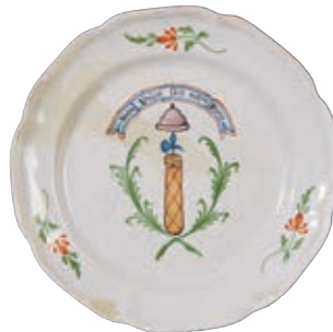
127 WALY. Assiette à bord contourné à décor patriotique polychrome au centre d'un faisceau de licteur sommé d'une hache et d'un bonnet phrygien, encadré de deux palmes, surmonté d'une banderole tricolore portant l'inscription "Notre Union fait notre Force". Fin du XVIIIème siècle, époque révolutionnaire. D : 22,5 cm 300/400 € Restaurations anciennes.

Bibliographie C. BONNET, Faïences révolutionnaires. Collection Louis HEITSCHHEL, p.114 n°147.