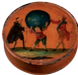
106 BOITE circulaire en papier mâché à fond ocre. Le couvercle présente une caricature à charge des Trois Ordres : le Tiers Etat figuré par un homme ployant sous le poids d'une sphère symbolisant la charge du Clergé à gauche et de la Noblesse à droite.

C. BONNET, Faïences révolutionnaires. Collection Louis HEITSCHHEL, p.98 n°102.