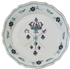
26 NEVERS. Assiette à bord contourné à décor patriotique en vert et manganèse des symboles de la Réunion des Trois Ordres liés par un ruban encadrés de trois fleurs de lys, et trois coeurs flammés. Fin du XVIIIème siècle, époque révolutionnaire. D : 22,5 cm 200/300 €

Modèle similaire Musée Joseph DECHELETTE à ROUANNE, Collection Louis HEITSCHHEL, un plat de barbier.