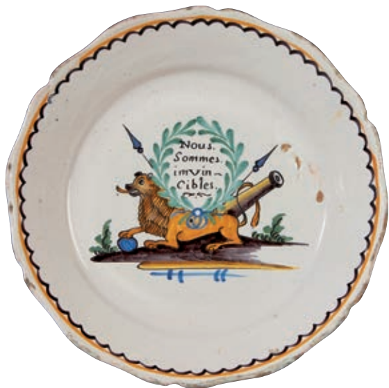
186 NEVERS. Assiette à bordure contournée à décor patriotique polychrome d'un médaillon cerné de deux branches de laurier portant l'inscription "nous sommes invincibles" surmontant un lion rugissant une patte sur un boulet de canon couché sur une terrasse fleurie avec fût de canon et deux piques. Fin du XVIIIème siècle, époque révolutionnaire. D : 23 cm

Le lion dans les décors les plus simplifiés est seulement "armé" d'un boulet.