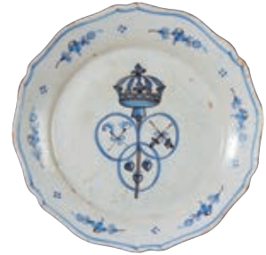
28 NEVERS. Assiette à bord contourné à décor patriotique en camaïeu bleu de trois médaillons ovales décorés de deux crosses, deux épées liées par un ruban, trois coeurs flammés et au milieu une bêche tête en haut soutenant la couronne royale. Tiges fleuries sur l'aile. Fin du XVIIIème siècle, époque révolutionnaire. D. 23 cm 200/300 € Quelques usures en bordure. Modèle rare en camaïeu bleu.

Dans ce décor on souligne l'importance du Tiers Etat qui est représenté trois fois par trois outils agraires.