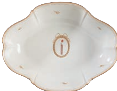
81 SAINT CLEMENT. Bassin d'aiguière ovale à bord contourné à décor patriotique en rouge et bleu au centre d'un faisceau de licteur surmonté d'une hache et d'un bonnet phrygien dans un médaillon ovale doré noué par un ruban, fleurs et filets dorés en bordure. Fin du XVIII ème siècle, époque révolutionnaire. L : 32,5 cm 1 000/1 200 €