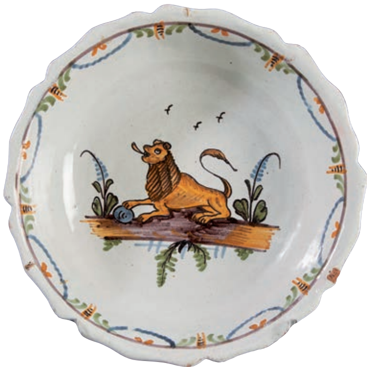
185 NEVERS. Jatte à bord contourné à décor patriotique polychrome représentant un important lion rugissant couché une patte sur un boulet de canon, sur un tertre fleuri. Guirlandes et feuillage sur l'aile. Fin du XVIIIème siècle, époque révolutionnaire. D : 30 cm

Musée National de la céramique de Rouen (Inv. 2361)