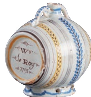
50 NEVERS. Tonnelet à alcool à double passants reposant sur un petit piédoche, à décor polychrome de cerclages alternés de guirlandes de feuillages et sur les fonds, les inscriptions : "W le Roy 1791" et "W la loi 1791". Fin du XVIIIème siècle, époque révolutionnaire. L : 12 cm 1 000/1 200 € Egrenures.

On notera qu'en 1792 on croit encore à la réunion des Ordres.