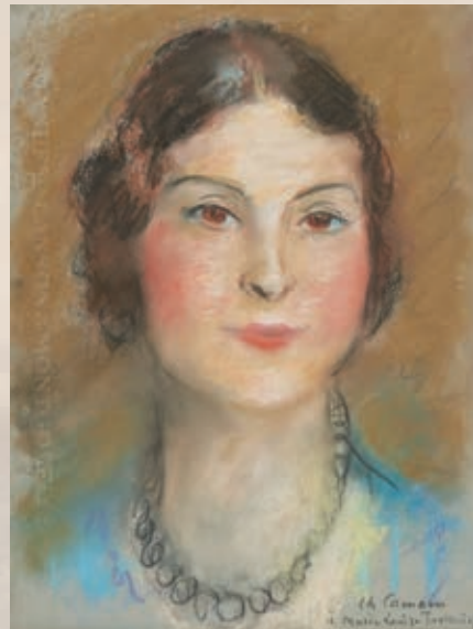
Vente d'art moderne & contemporain en préparation le 30 novembre prochain