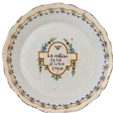
48 NEVERS. Assiette à bord contourné, à décor patriotique polychrome dans une réserve entourée de feuillage de l'inscription "W La nation la loi et le Roi.1790". Guirlande de feuillages stylisés en bordure. Fin du XVIIIème siècle, époque révolutionnaire. D : 23 cm 600/800 € Quelques égrenures.

Bibliographie C. BONNET, Faïences révolutionnaires. Collection Louis HEITSCHHEL, p.131 n°213.