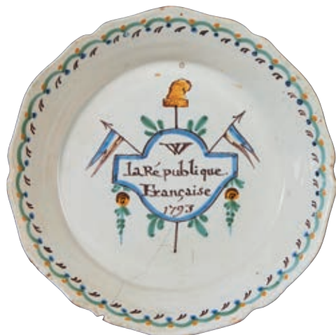
167 NEVERS. Assiette à bord contourné à décor patriotique polychrome d'une inscription "W la République Française 1793" dans une réserve surmontée d'une pique avec un bonnet phrygien et encadrée de deux drapeaux tricolores. Guirlandes de fleurs sur l'aile. Fin du XVIIIème siècle époque révolutionnaire. D : 22,5 cm 1 500/2 000 € Une fêlure.

Bibliographie C. BONNET, Faiences révolutionnaires. Collection Louis HEITSCHTEL, p.163 n°307, un saladier.