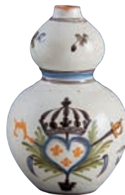
27 NEVERS. Gourde à double renflement dite "calebasse", à décor polychrome d'un côté des symboles des Trois Ordres réunis par un ruban vert surmonté d'une fleur de lys bleu de l'autre côté : trois fleurs de lys dans un coeur surmonté de la couronne royale entouré des Trois Ordres sur fond de feuillage et d'une inscription "manti..ble " 1790" (intraduisible). XVIIIème siècle. H : 15 cm 1 000/1 200 €

Modèle similaire Musée Leblanc Duvernoy à AUXERRE.