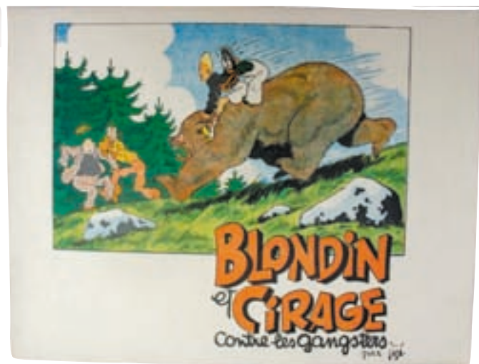
Lot n° 56