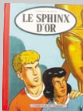
Lot n° 200