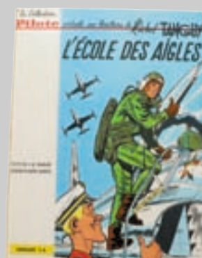
Lot n° 378