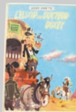
Lot n° 253