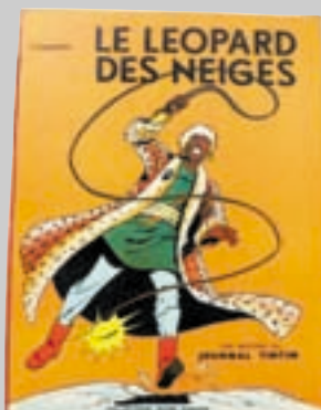
Lot n° 317