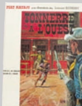
Lot n° 63