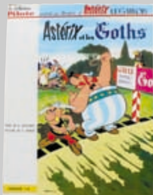
Lot n° 24