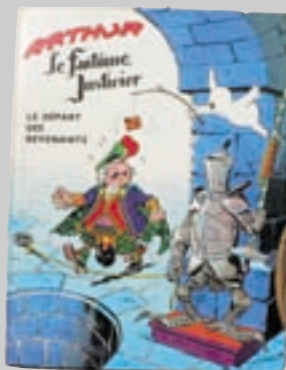
Lot n° 32