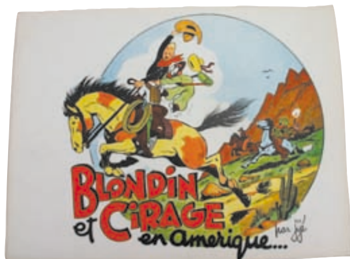
Lot n° 55