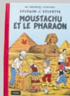
Lot n° 377